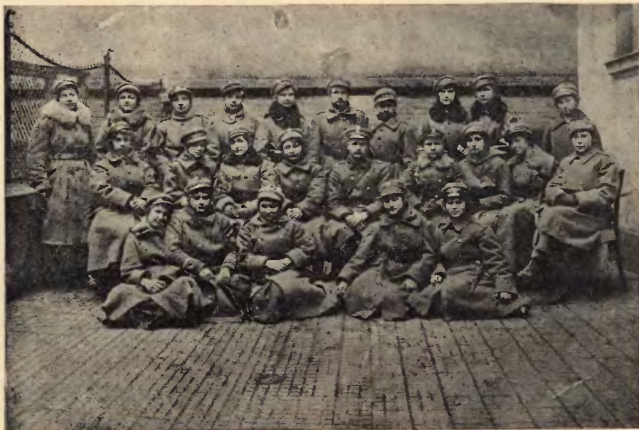
Legja Kobiet w Obronie Lwowa i Kresów]