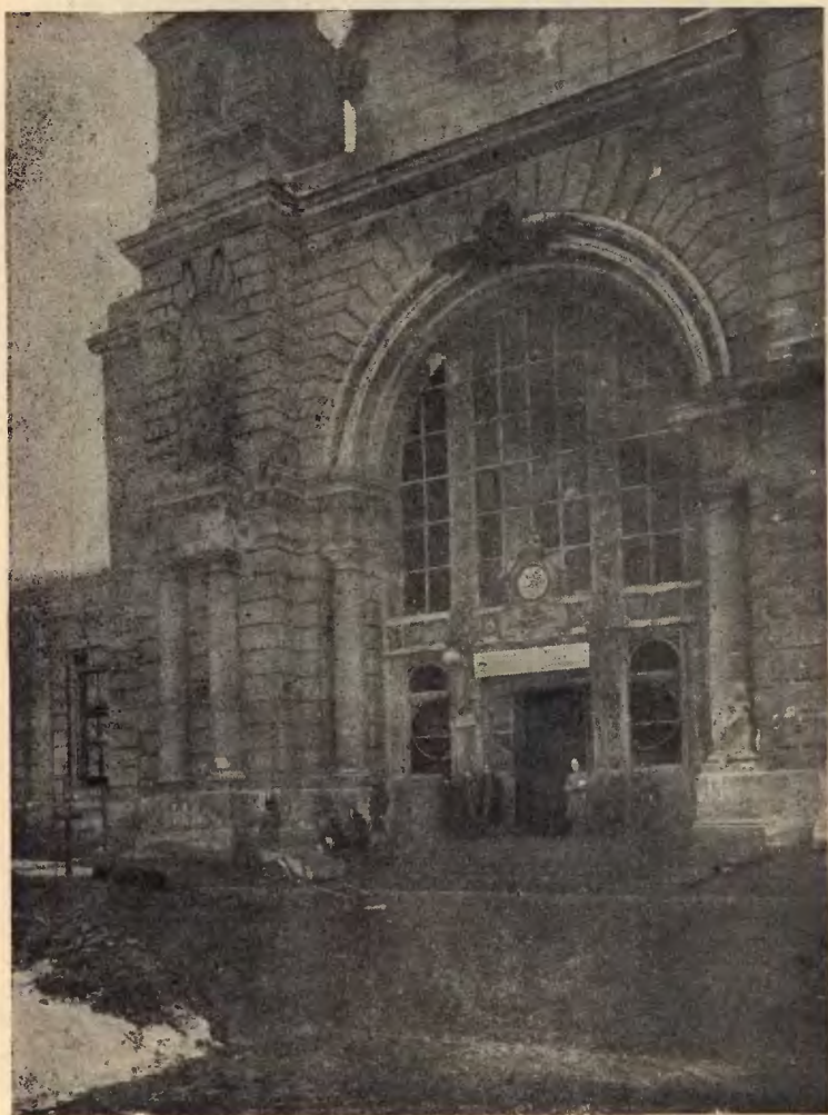
Dworzec główny w czasie walk 1918 r.