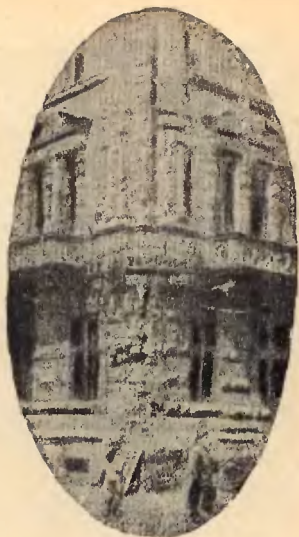
Róg gmachu poczty