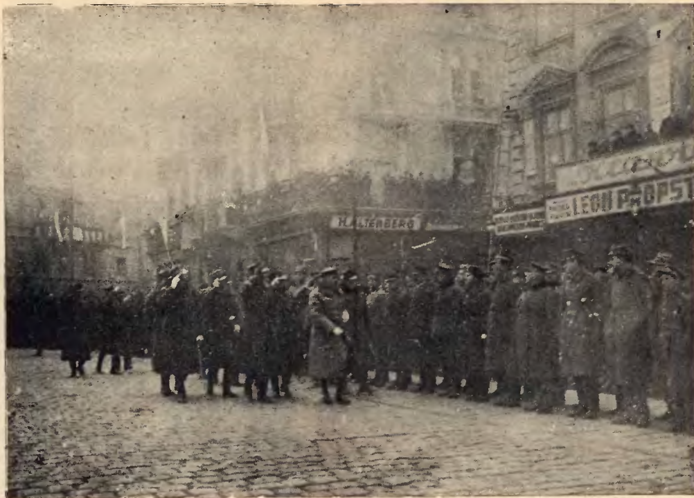
Naczelnik Państwa dekoruje w 1920 r. Miasto Lwów i obrońców Lwowa orderem „Virtuti Militari“