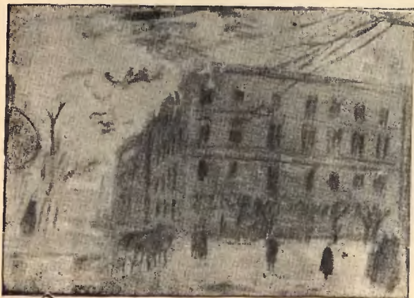
Pałace się skrzydło Sejmu we Lwowie w 1918 r.