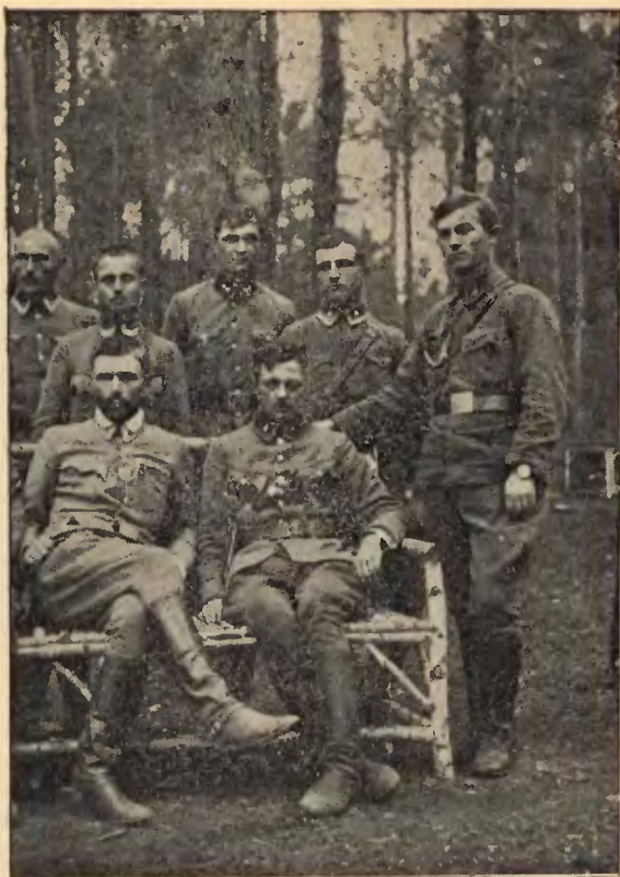
GEN. DYW. BOLESŁAW ROJA,