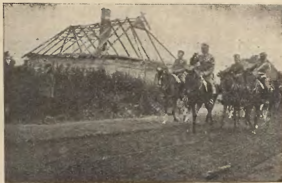
WJAZD KOMENDANTA DO LESZNIEWKI 1916 r.