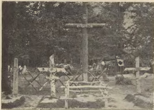
GRÓB Ś. P. POR. UDOŁOWICZA w Rudce Sitowieckiej