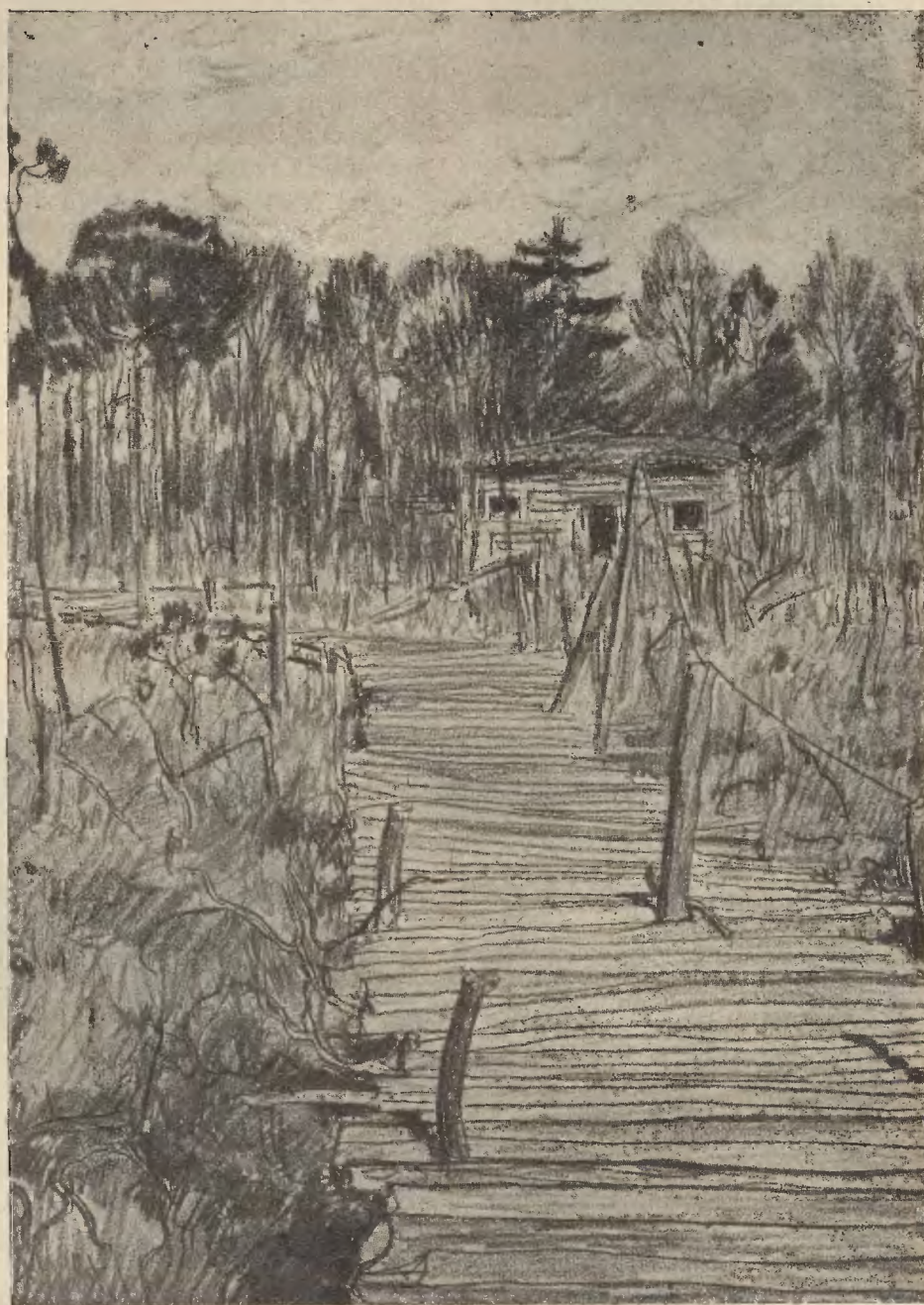
Placówka 4. p. p. Legionów Polskich w 1916 r. nad Styrem

Czysty dochód na budowę Domu Legionistów Polskich we Lwowie.