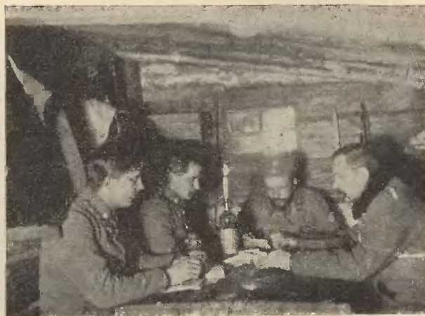
OFICEROWIE 5 P. P. W ZIEMIANCE

W drutach kolczastych, w złotej otoczy rdzawych, ostrych kolców życie zakończył.