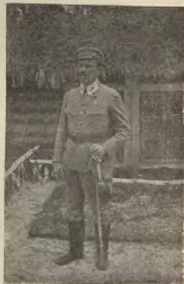
GEN. DYW. LEON BERBECKI pod Kościuchówką w 1916 r.

Ciężkie, a jednak lotne łzy padały wokoło.