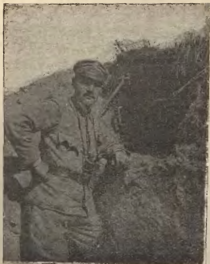
PUŁK. BOLESŁAW POPOWICZ w 1916 r.