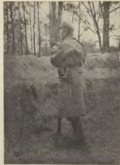
CZUJKA POD KOŚCIUCHNÓWKĄ