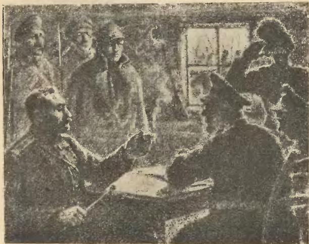
Król-Kaszubski przed sądem polowym Rysunek Józefa Ryszkiewicza

Schorowany, zbiedowany, obdarty, błotem powalany, cień owego Strzelca, który dnia 6 sierpnia 1914 r. opuszczał Kraków z piosenką na ustach,