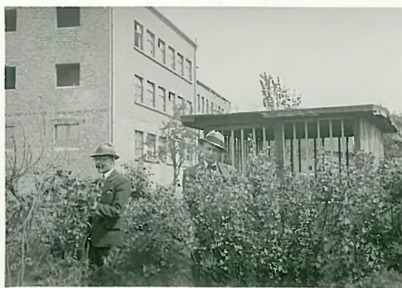
Nowe części budynku szkolnego.