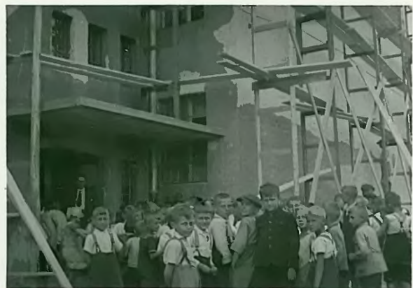
W jakich warunkach odbywała się praca szkolna podczas przebudowy.