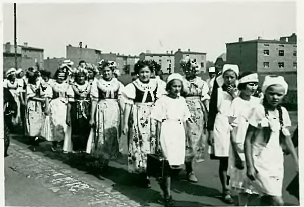
Kucharki i Sławniki.