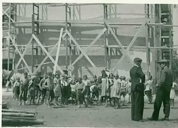
W czasie przebudowy szkoły od strony boiska.