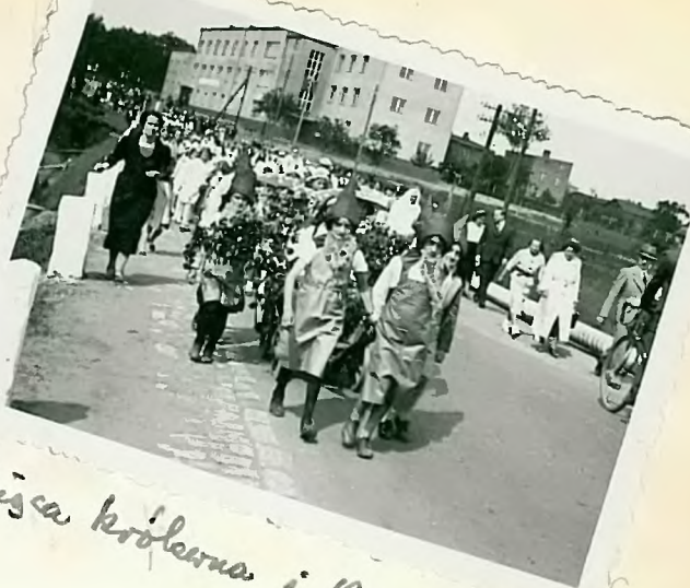
Ćwisa królewna i Kanceli.