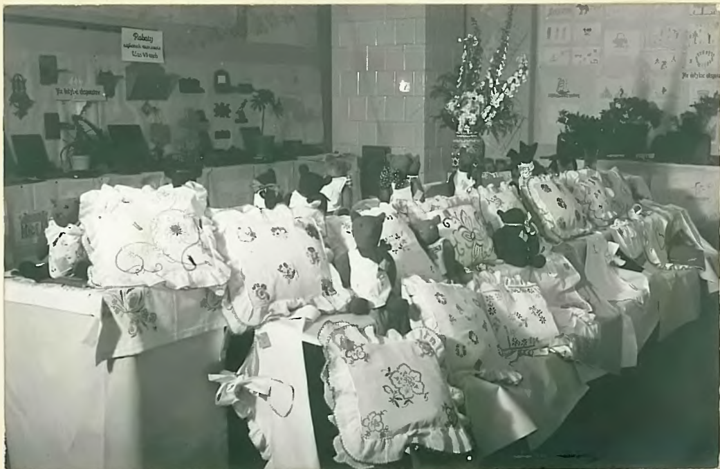
Работы художественной и хозяйственной.