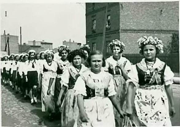
Hysaraki i Marynarki.