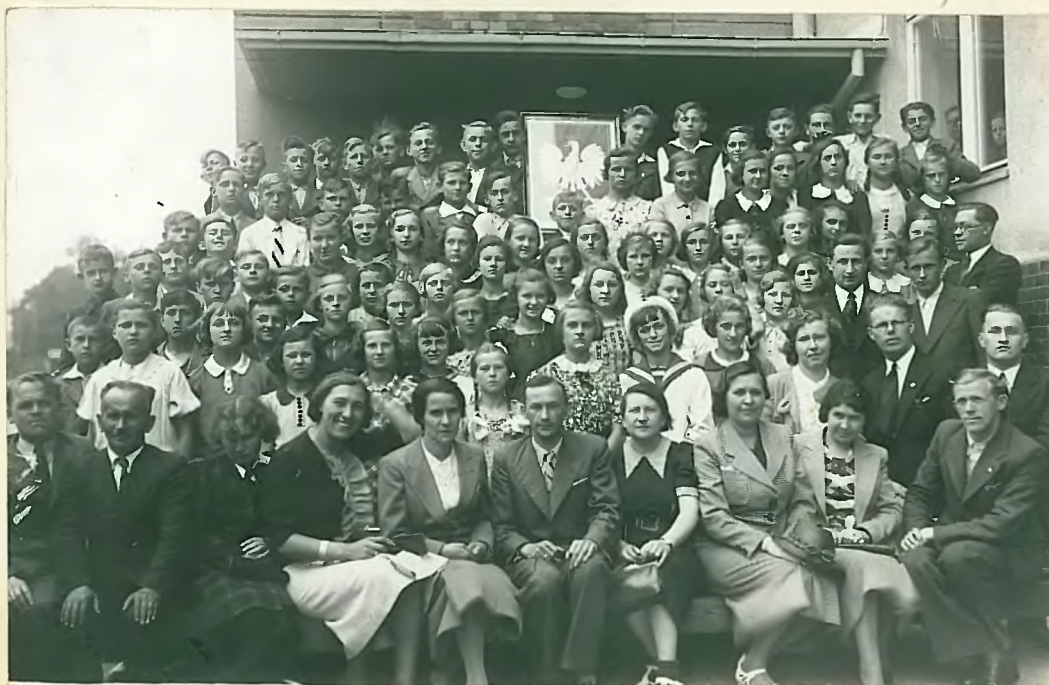
Собрание учащихся и преподавателей школы в 1937/38.