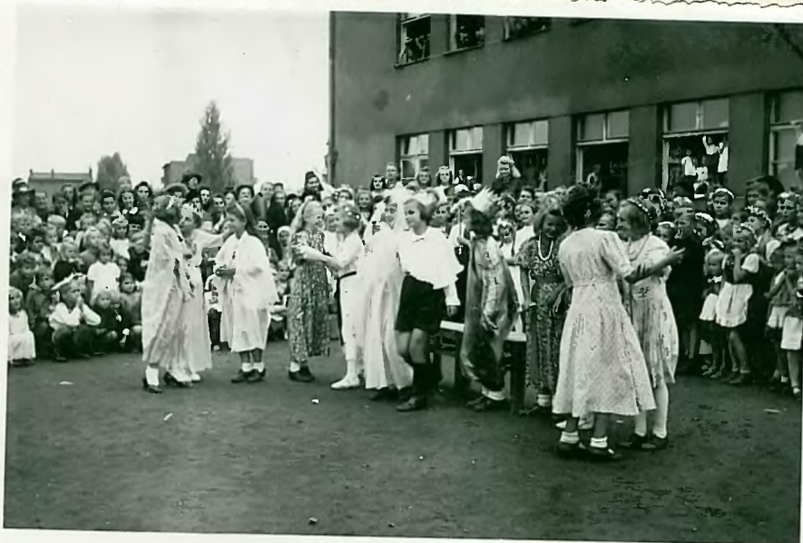
Inscenizācija bajki "Kopciņš"