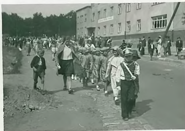
Kibiki z ptaszkiem na ciele.