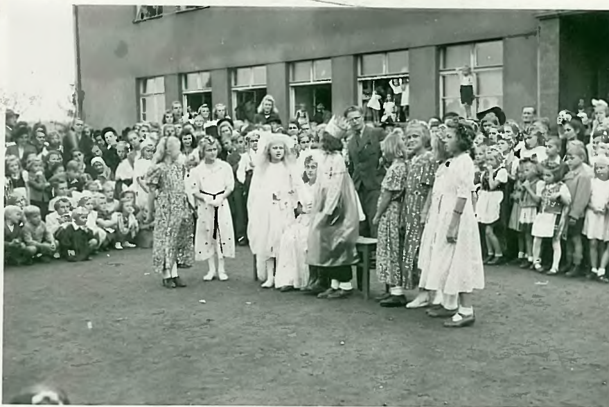
Inscenizācija bajki "Kopciņš"