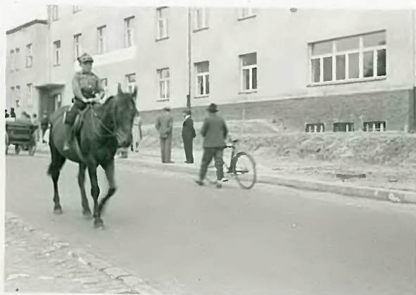
Kawalenyotz porradhczy pochod.