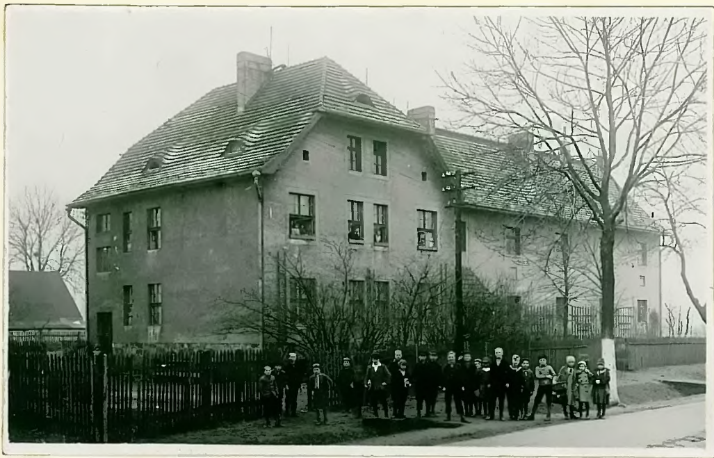
Stary budynek szkolny.