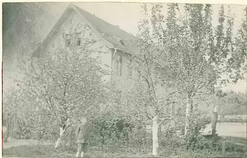
Stary budynek szkolny od strony ogrodu.