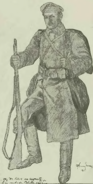
pol. Nr. 1244 na baganach, p. Zy. emulacja Pol. Nr. 1244