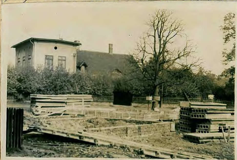
Stan robót w dniu 15 IX 1963.

W jesieni zaczęto sworzyć materiały i elementy. Do budowy wzięto auto-dźwig. Roboty ziemne wykonano bardzo szybko.