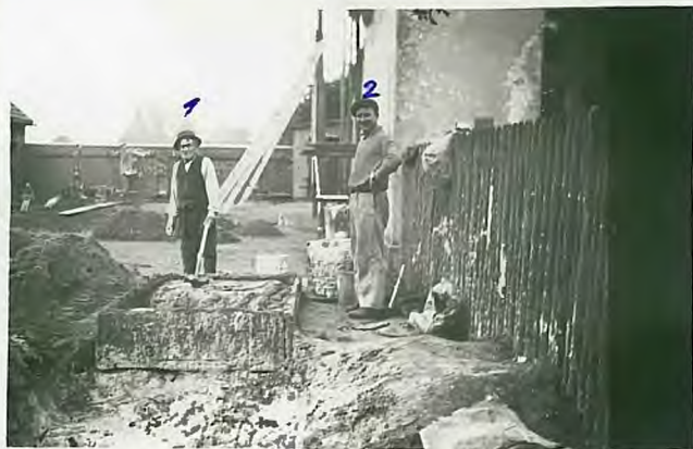
1. Simka 2. Ryguta Paweł