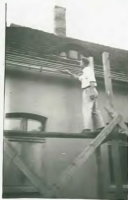
Właściciel prace kier. sekcji