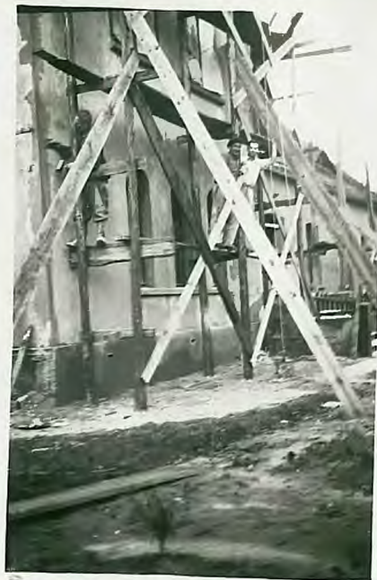
Prace przy ty- kowaniu. Właściciel właściciel kier. sekcji przez komitetu i mu- row. Włocławek Ruffin