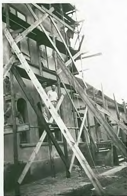
Właściciel kier. sekcji i przez komitetu