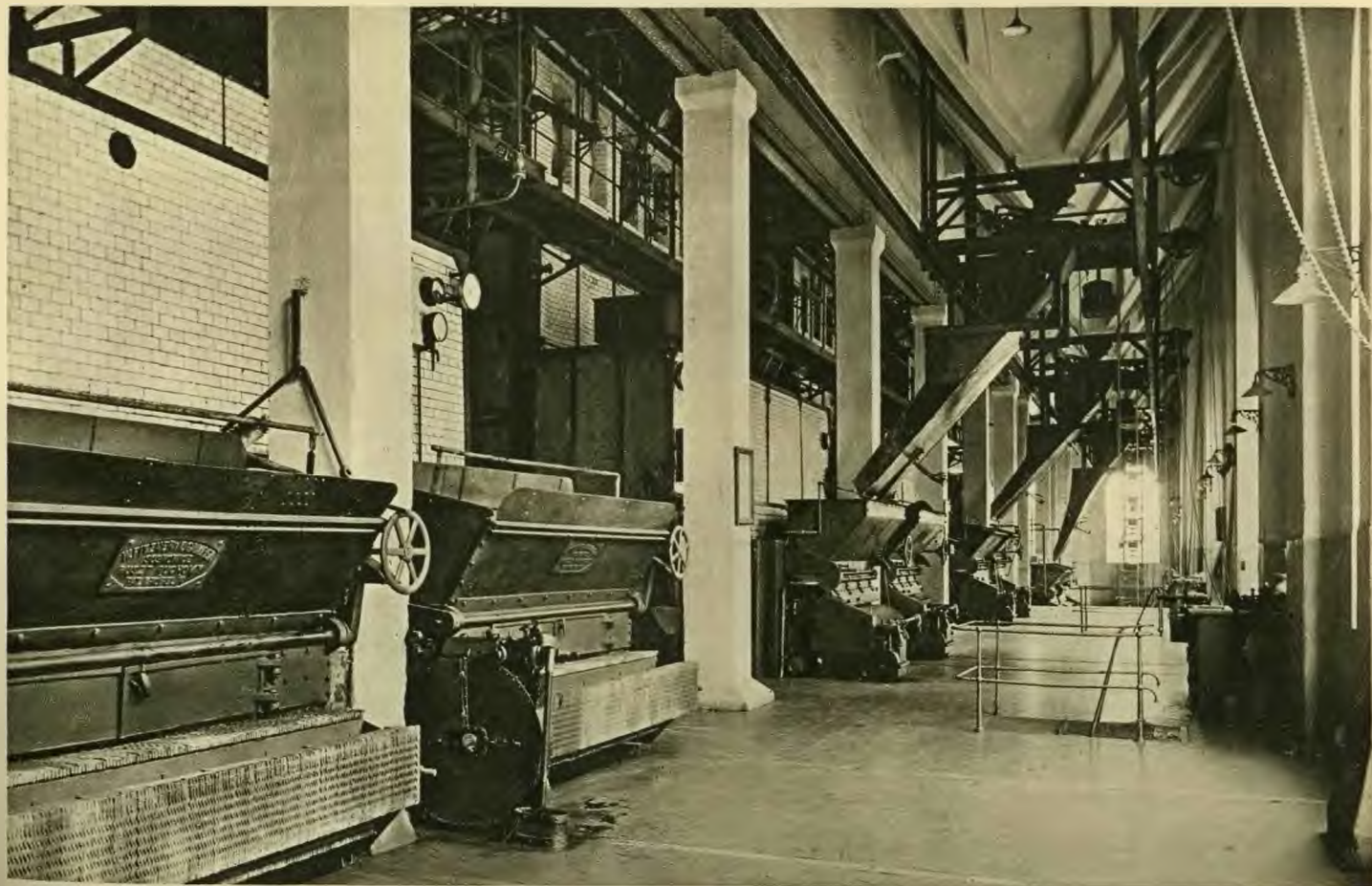
Kesselanlage auf der Grube „Jowisz“.

Diese Fähigkeiten konnte die Gesellschaft bis jetzt nicht ganz ausnutzen, weil die Kohlenproduktion in Polen durch die Polnische Kohlen-Konvention, die alle Steinkohlengruben in sich vereinigt, je nach dem Bedürfnis der Absatzmärkte, normalisiert wird.