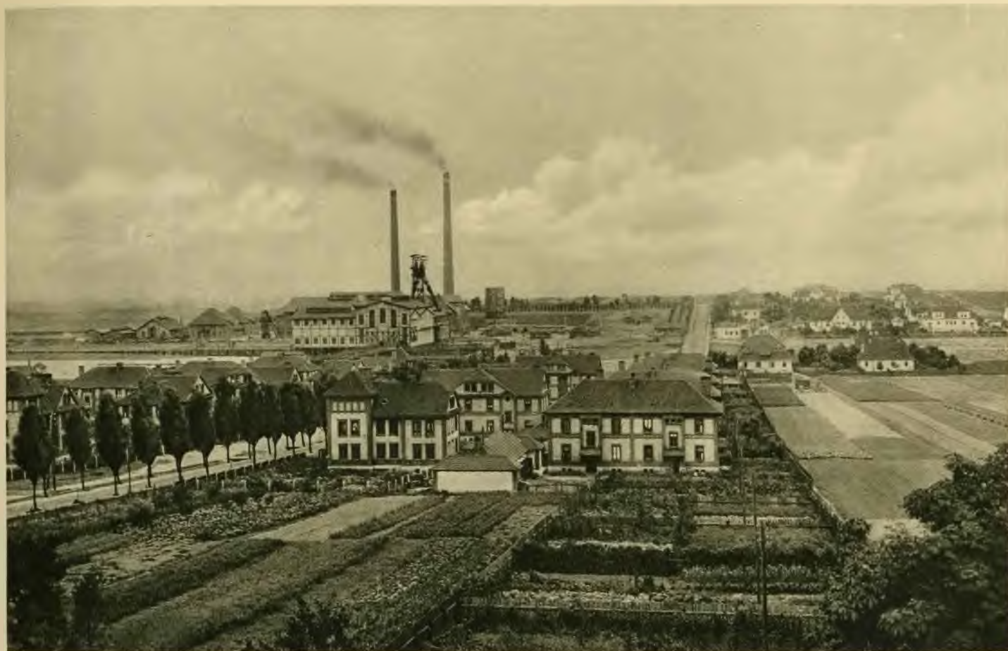
Totalansicht der Grube „Jowisz“.

Die Gesellschaft exploitiert in ihren drei Gruben: „Saturn“, „Jowisz“ und „Mars“ Steinkohle, deren Sortimente über 40 mm Stärke für Küchen und Heizung im Haushalt Anwendung finden, wogegen die Sortimente unter 40 mm für Industriezwecke dienen.