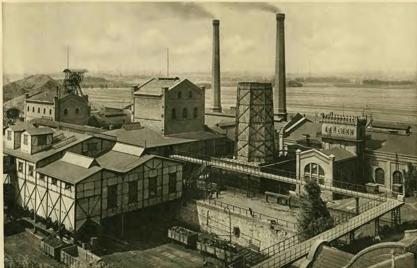
Totalansicht der Grube „Saturn“.