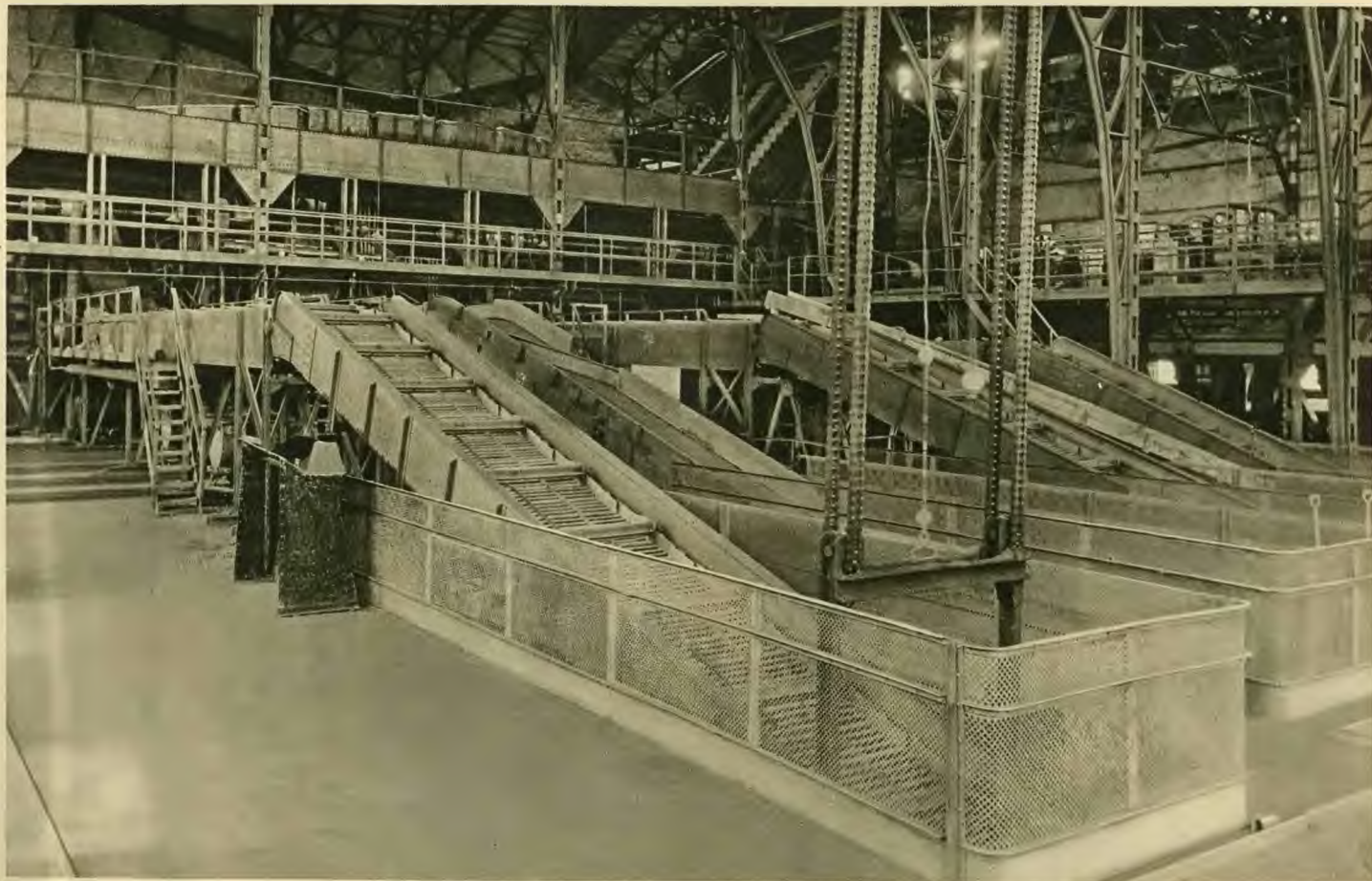
Sortieranlage der Grube „Jowisz“.

Die Produktionsfähigkeit unserer Gruben, wie auch die Ausrüstungen der Sortieranlagen geben eine Förderungsmöglichkeit bis 10.000 Tonnen Kohle pro Tag, was jährlich ca. 3.000.000 Tonnen ergibt.