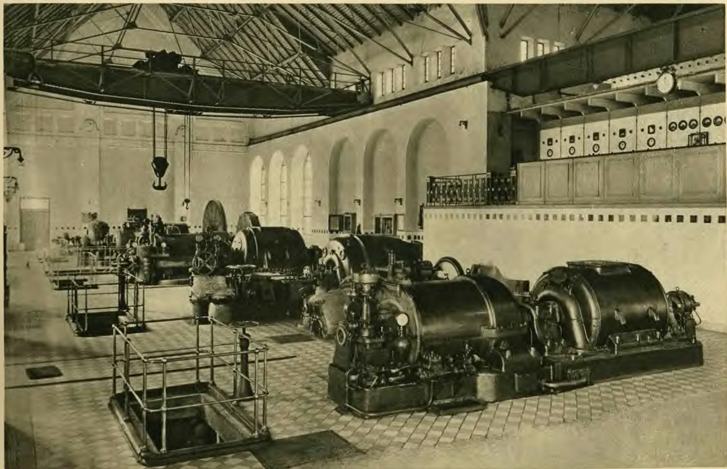
Elektrizitätswerk der Grube „Jupiter“.