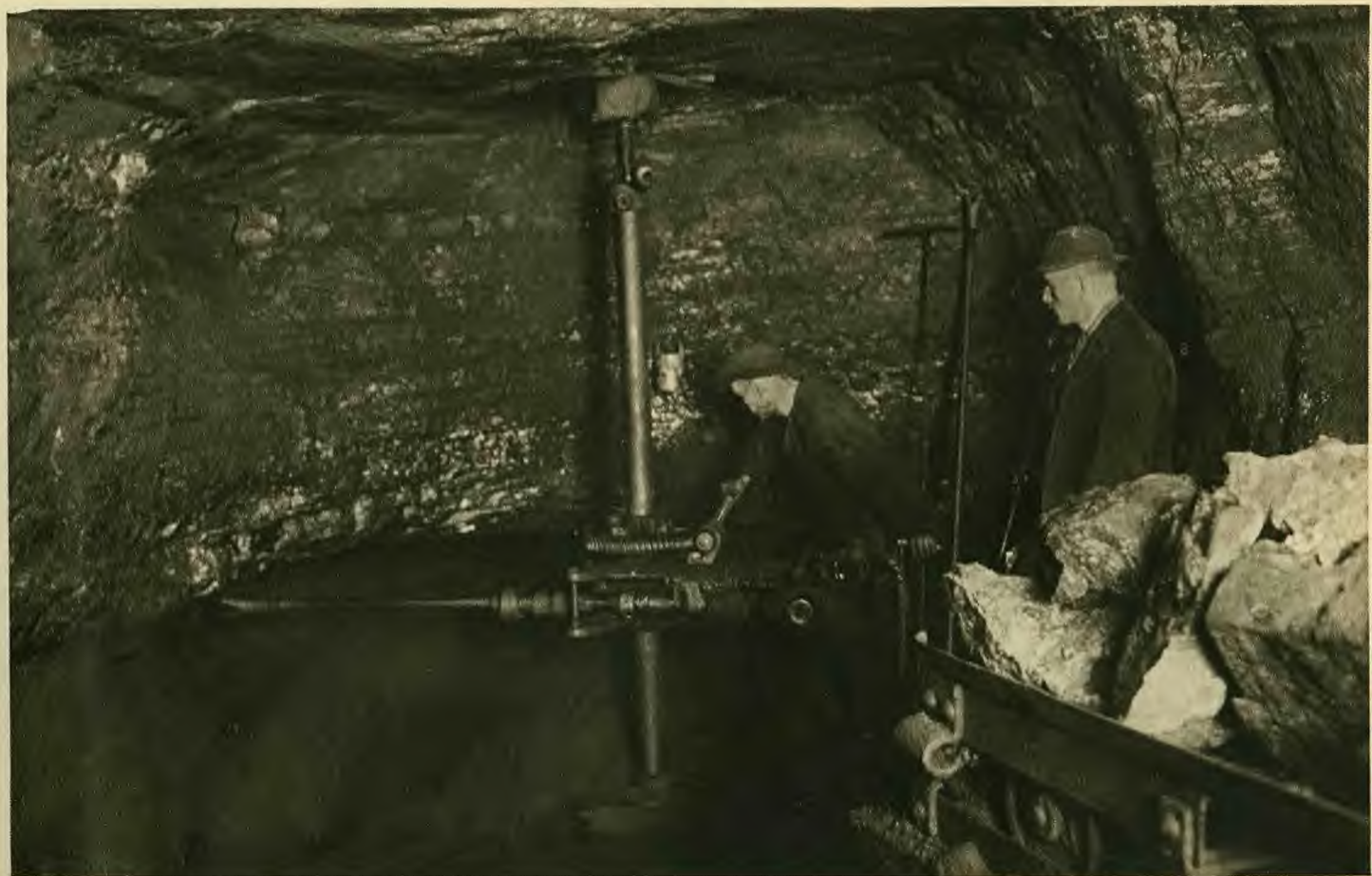
Arbeitsmotiv der Schremmaschine beim Streckenbetrieb.