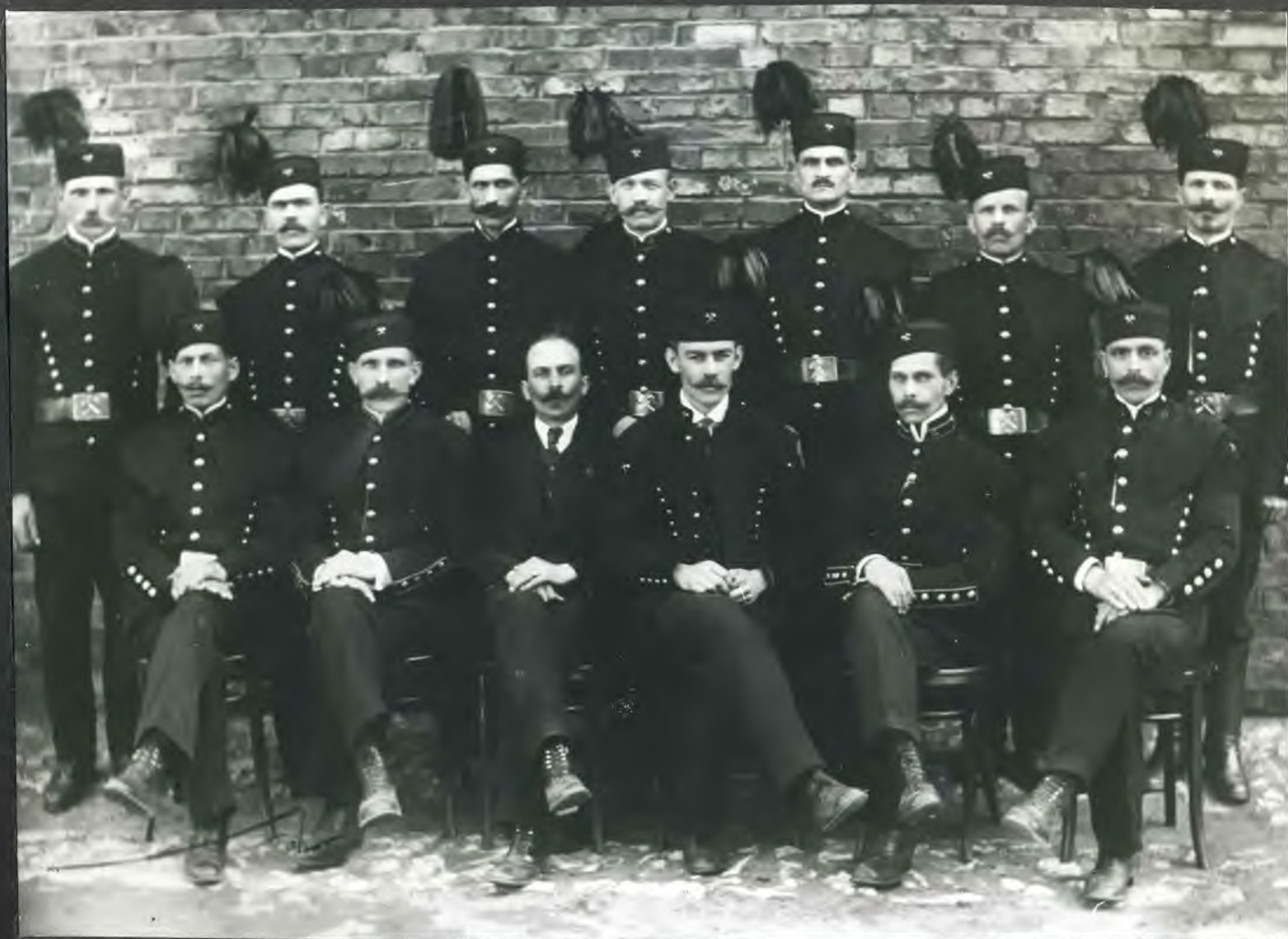
Gornicy kopalni "Saturn" - 1930 r.