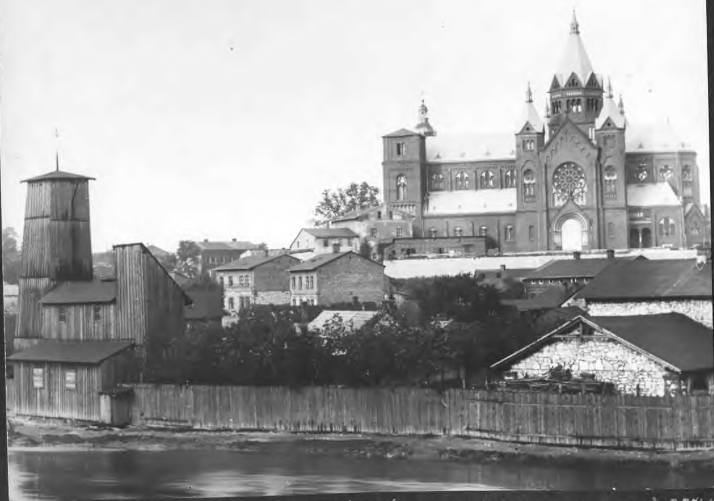
Nowy Kościół - 1914 r. (WIEŻE JESZCZE NIE WYKONCZONE) Z TYTU Z LEWEJ - STARA REMIZA STRAŻACKA (CAŁA Z DREWNA) WIDĄC SZŁYT WIEŻ STAREGO KOŚCIOŁA