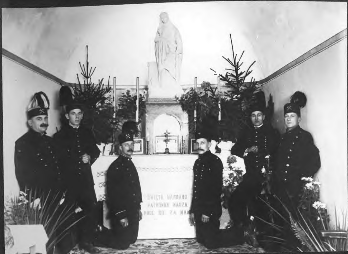
Altarz św. Barbary na poziomie I. kopalni "Saturn"