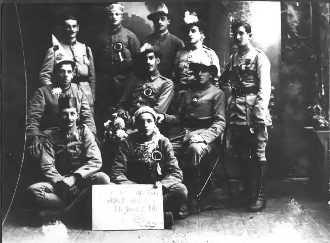
Wojska francuskie na kwaterze w Czeladzi-1919 r.