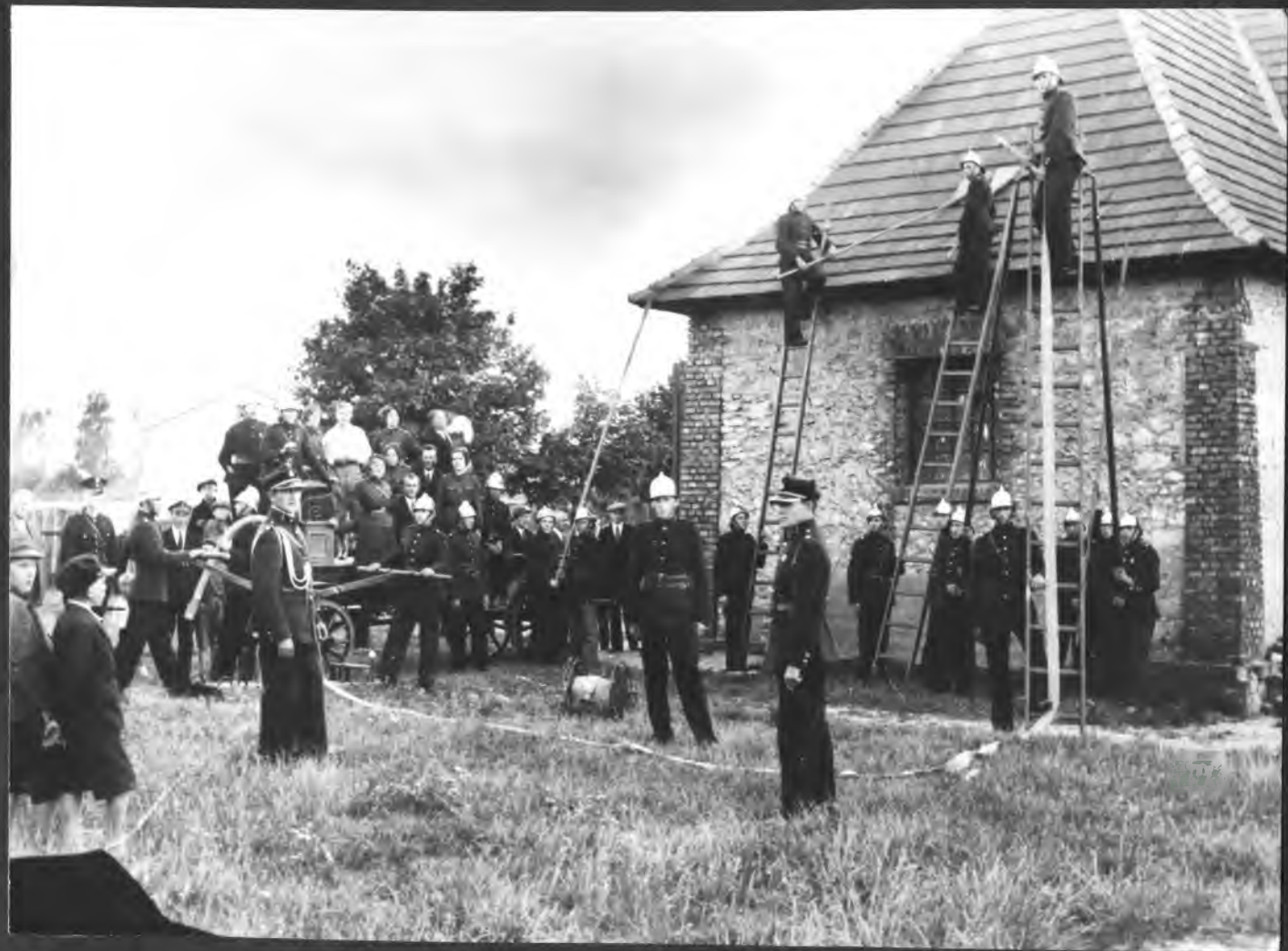
Straż Ogniowa w czasie ćwiczeń - 1930 r.