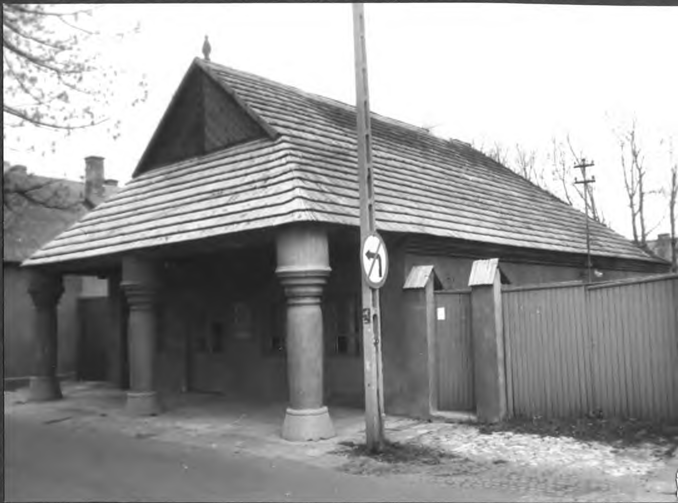
Budynek z podcieniami przy ul. Kościelnej. 1990 r.