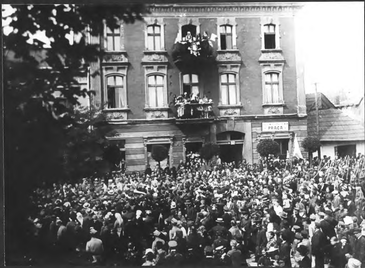
Zgromadzenie na Rynku po 1918 r.