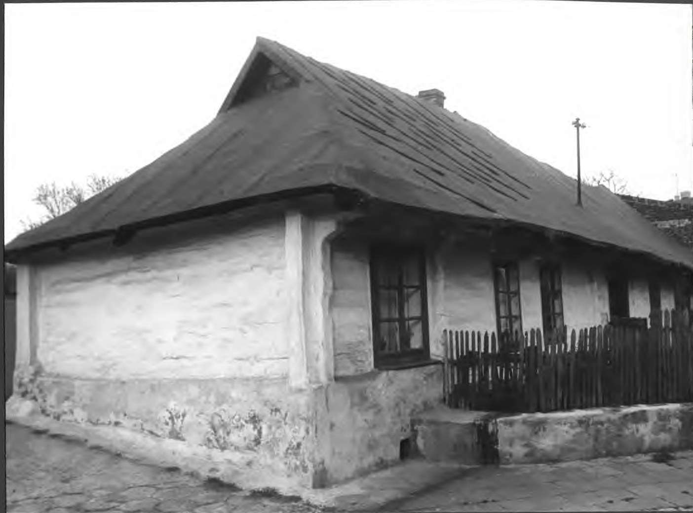
DOM RODZINY JUSZCZYKÓW PRZY UL. KSIĘDZA PIENKOWSKIEGO - 1990 R.