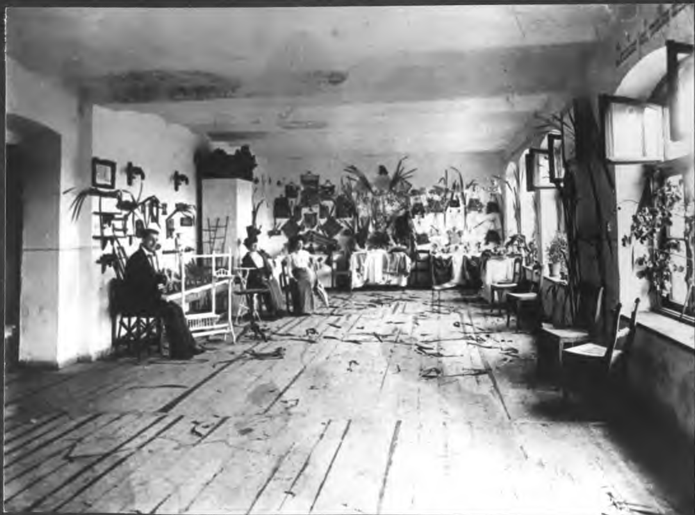
Wystawa rękodziela ludowego - 1910 r.