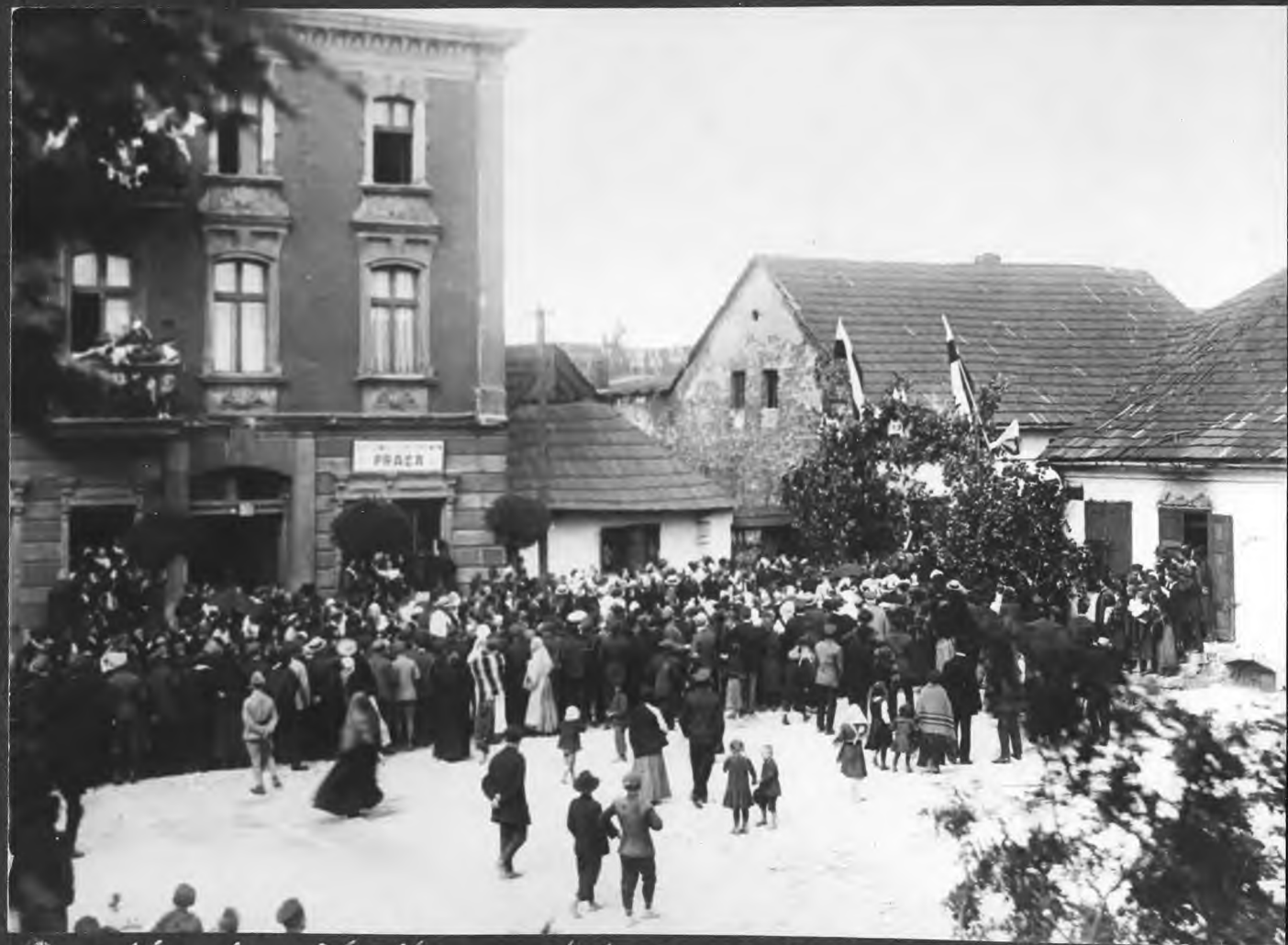
Powitanie Hallerczyków - 1919 r.