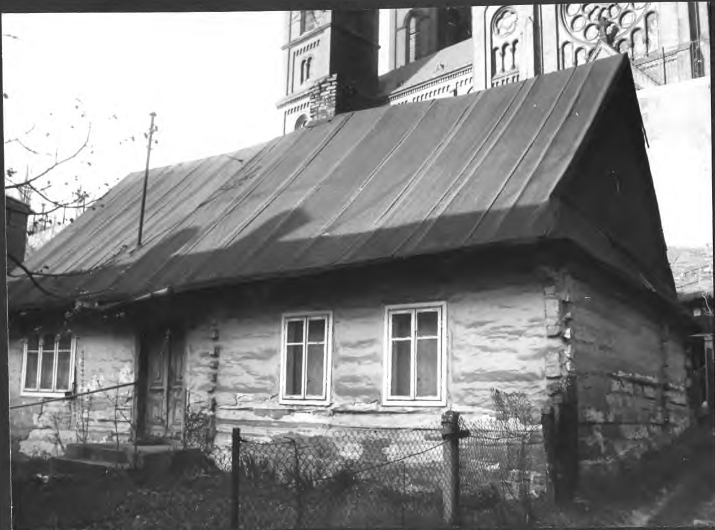
DOM RODZINY LESZCZYŃSKICH - PRZY UL. PODWALNEJ - 1990 R.