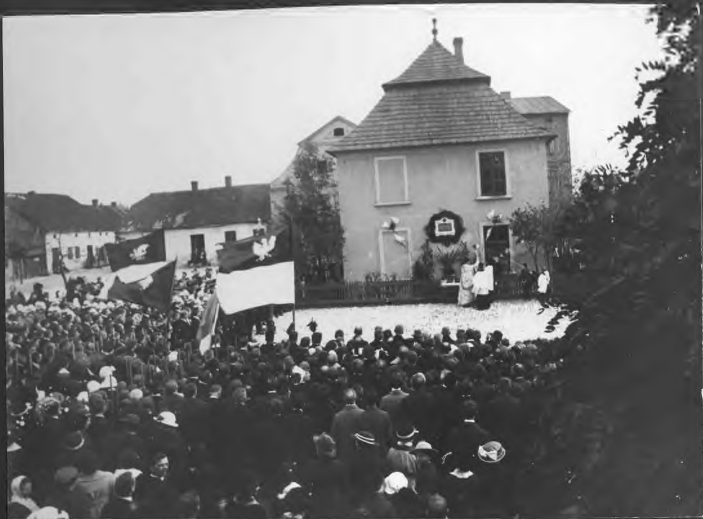
Poswiecenie tablicy na Ratuszu ku czci T. Kosciuszki. 1917 r.