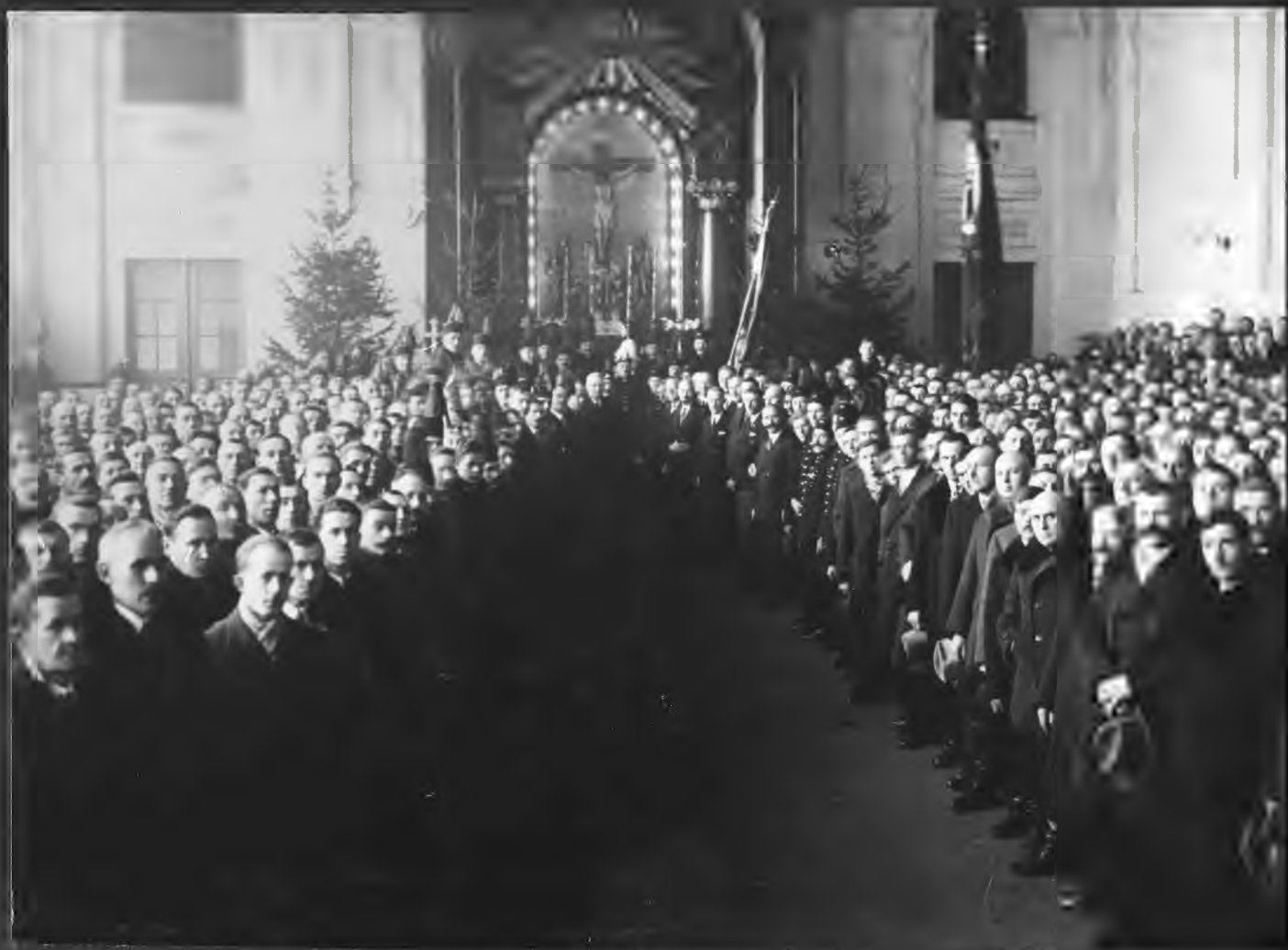
Hala Zborna kopalni "Saturn" - 4. XII. 1930 r.