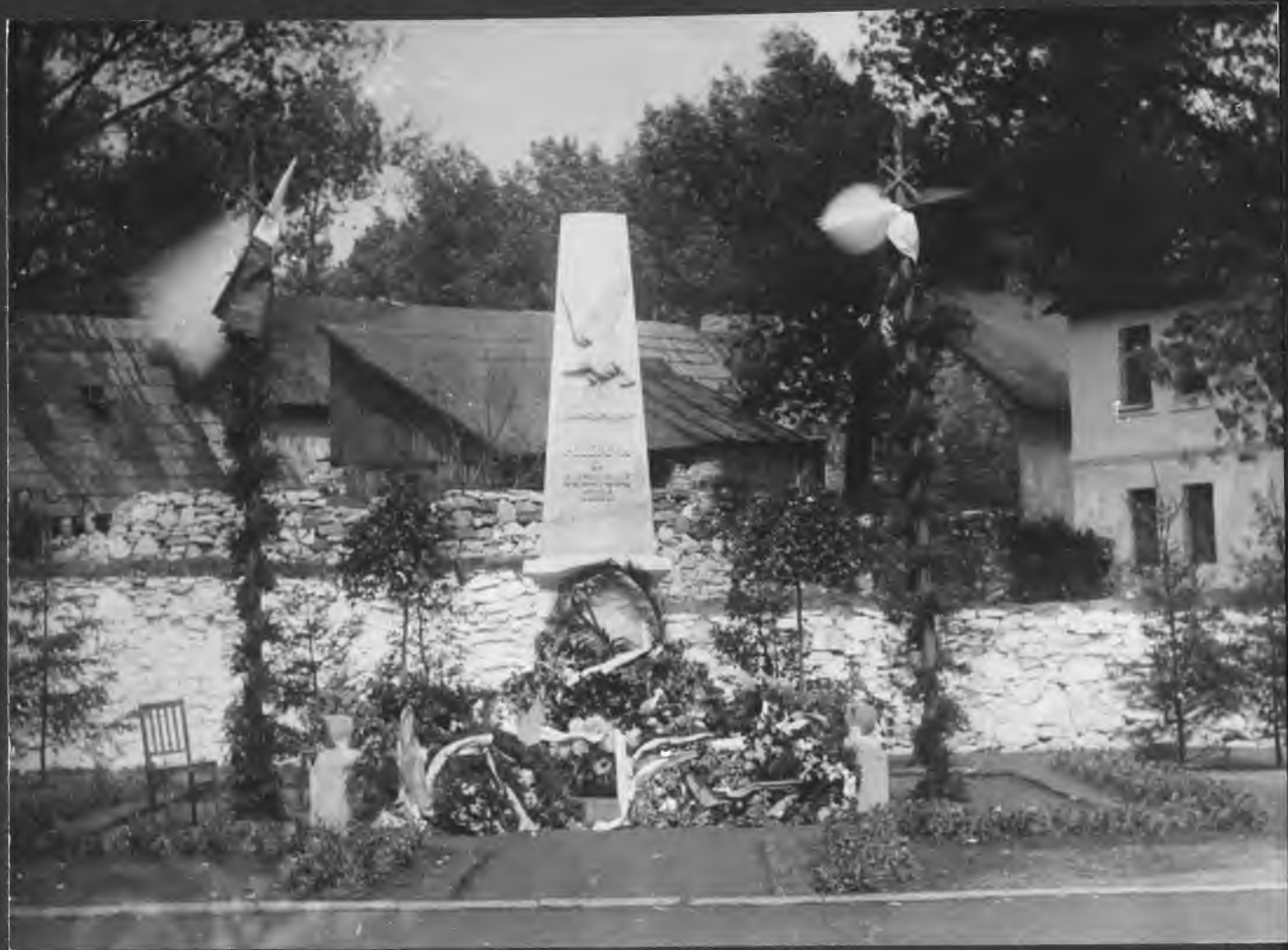
Pomnik "Poległym za Ojczyznę" przy ul. Miłowickiej. 1929 r.