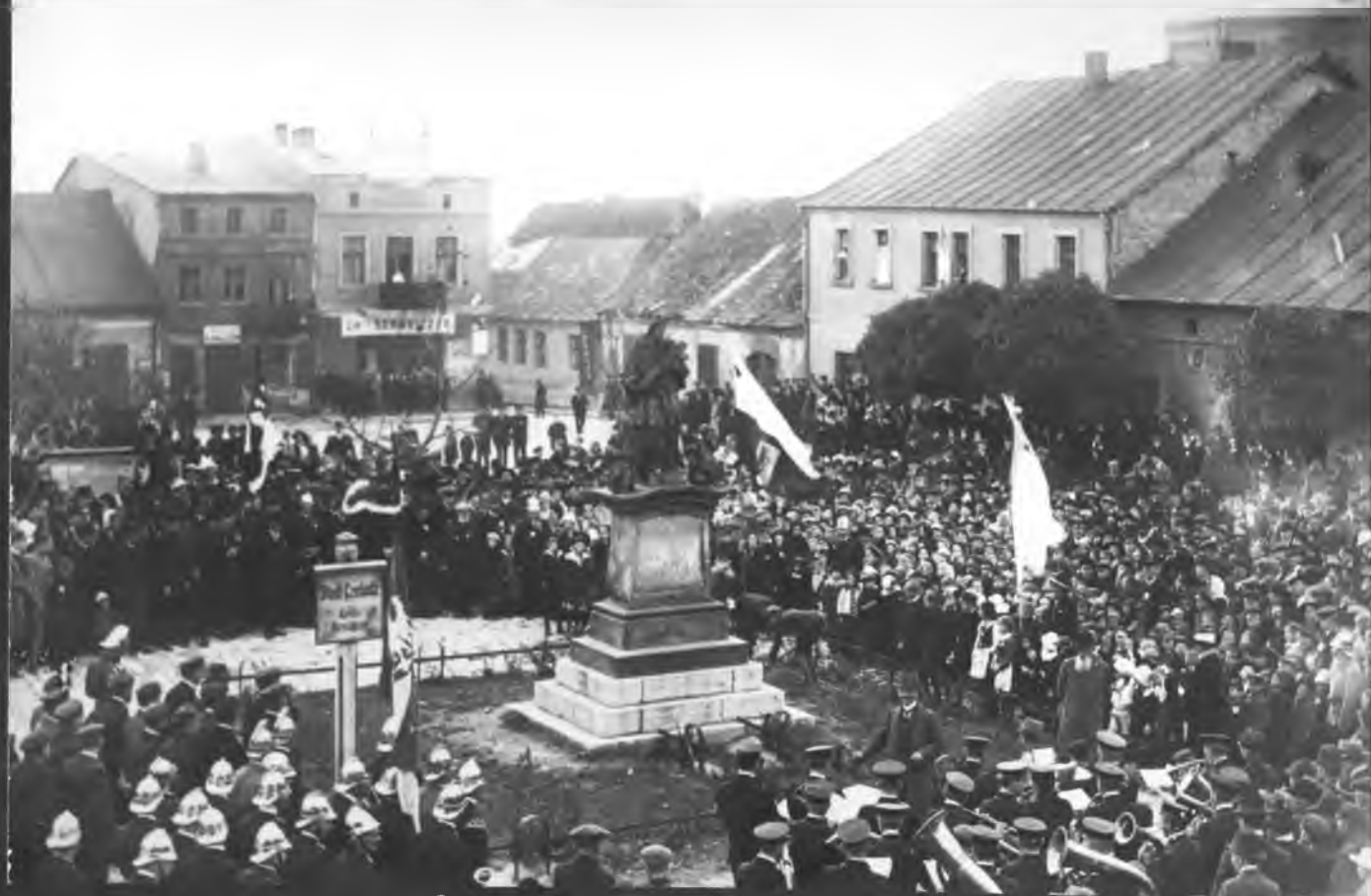
Zgromadzenie na Ryнку po 1916 r. PRZED FIGURĄ ŚW. JANA NEPOMUCENA