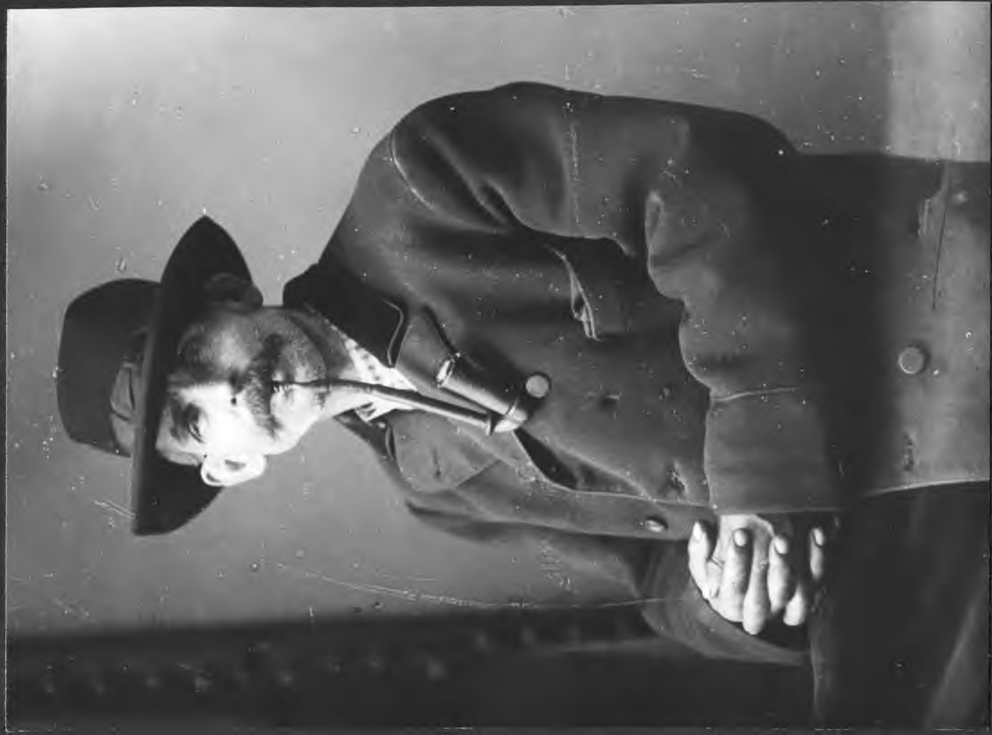
OBYWATEL CZELADZKI. 1910 R.