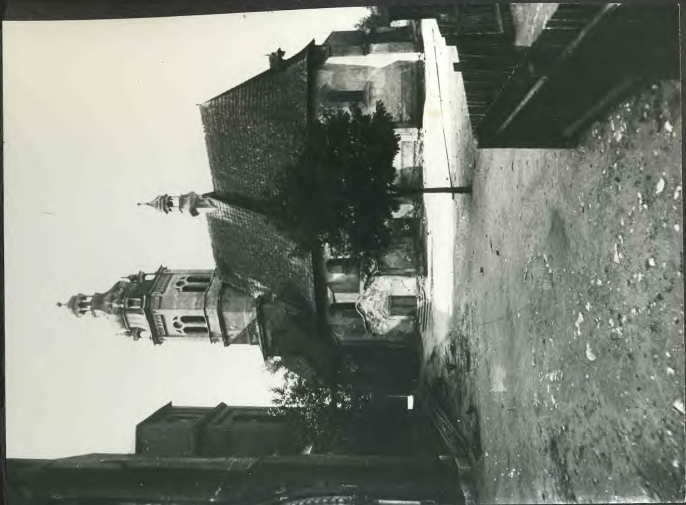
Stary Kościół w 1914 z XVI wieku