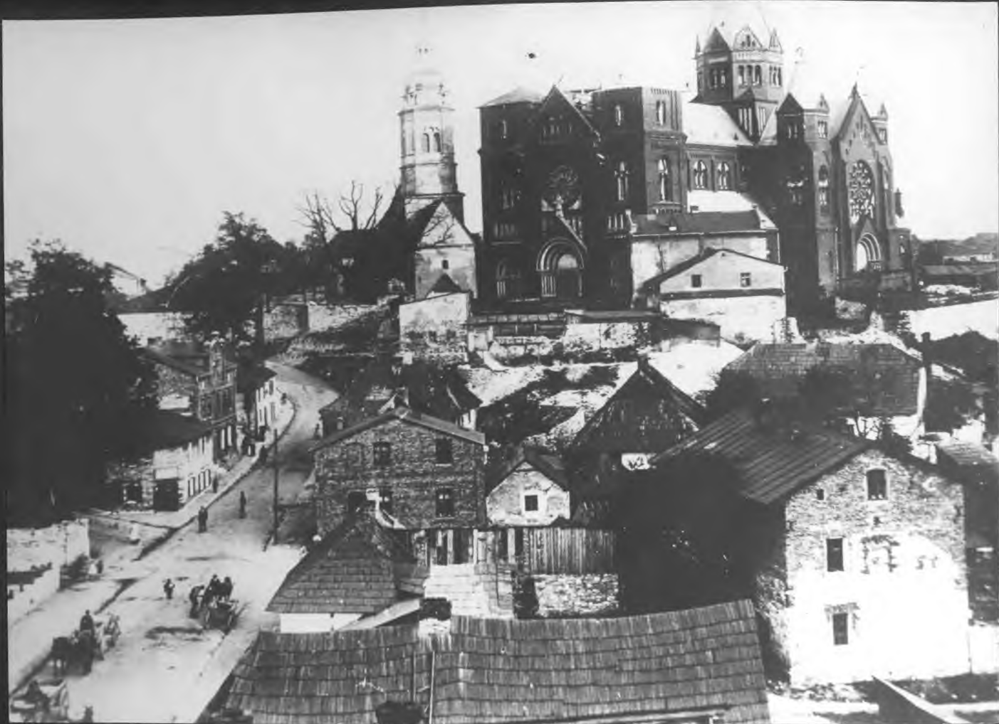
Czładź - 1912 r.