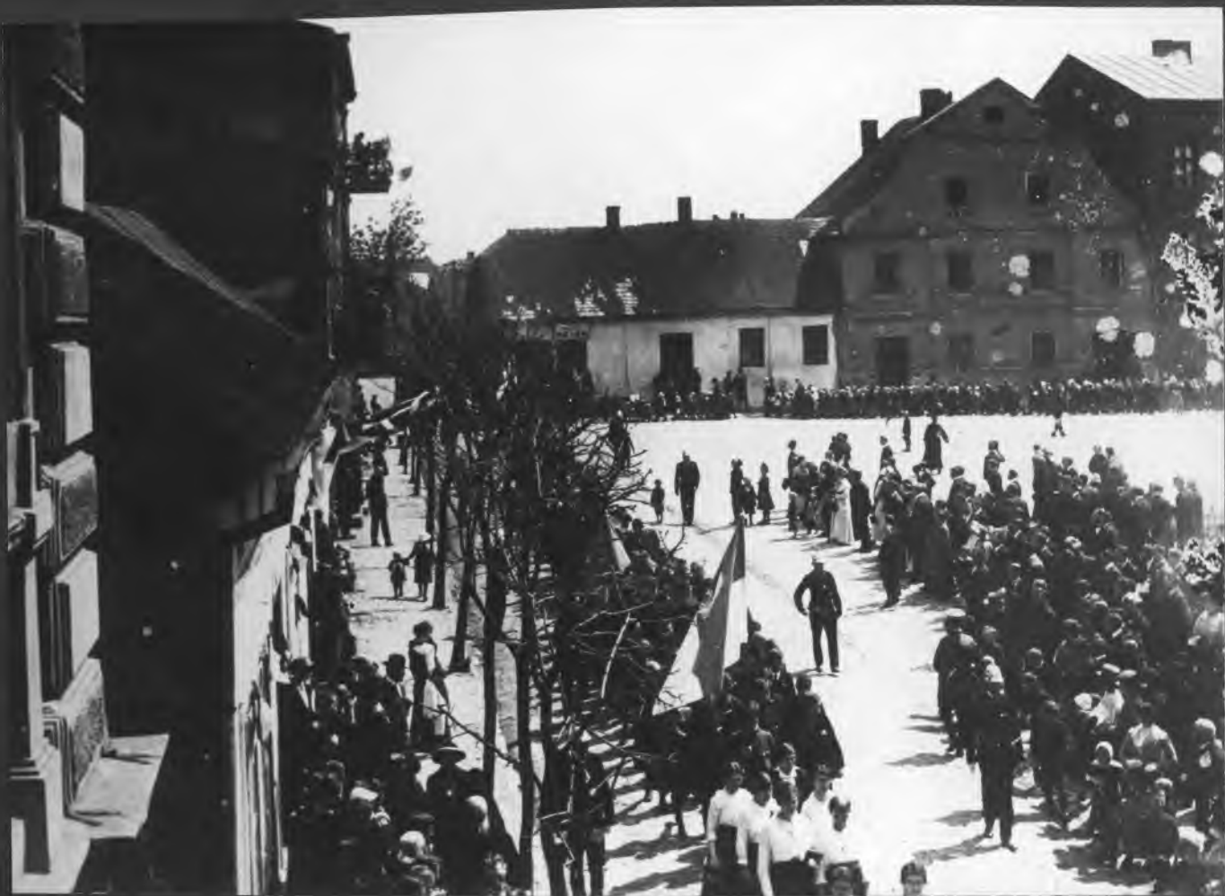
Obchody 125 rocznicy uchwalenia Konstytucji 3 Maja ~ 1916r. RYNEK W CZELADZI