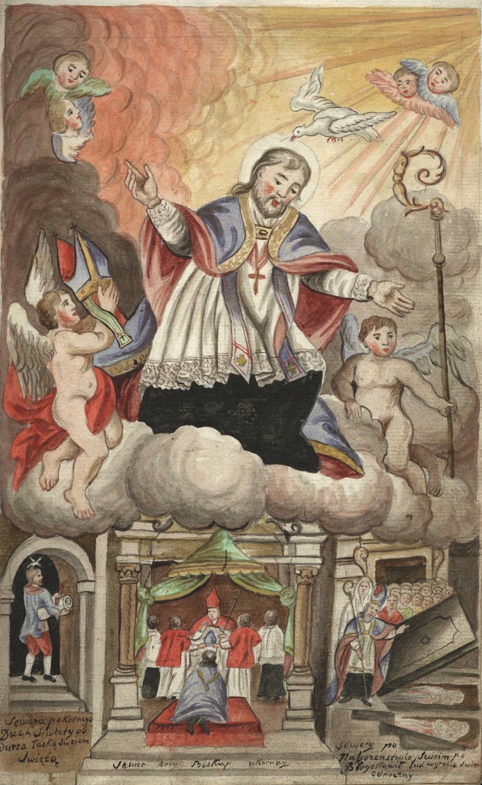
Severus pokornego Duch Święty ob Dusza Tęską swoim Święta