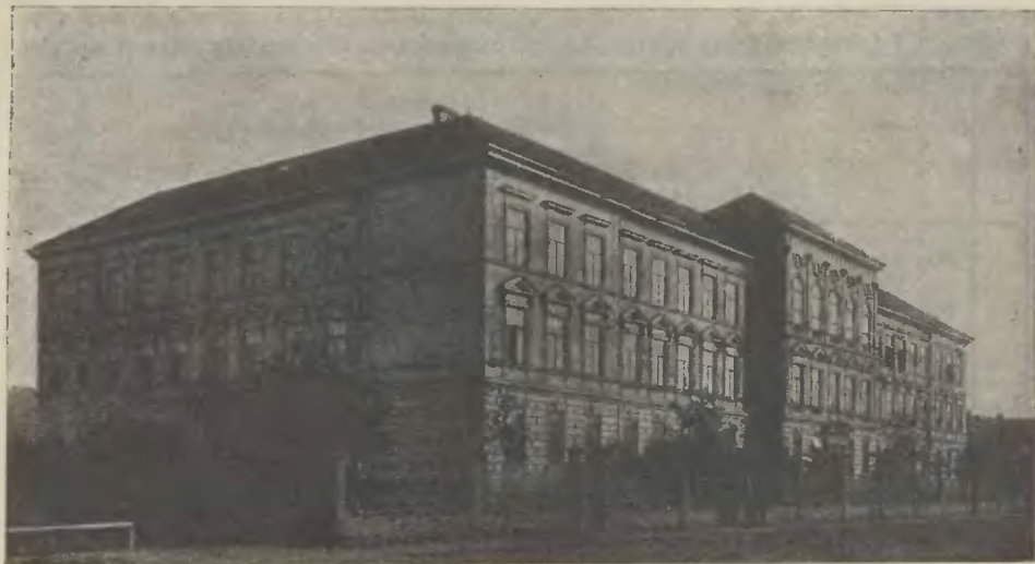
GIMNAZJUM W ŻYWCU