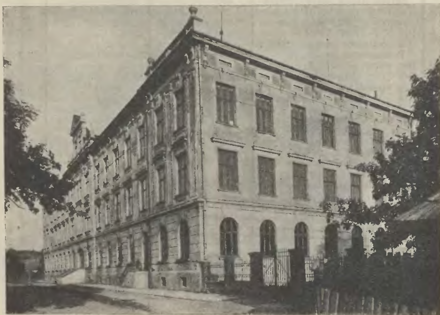
SZKOŁA WYDZIAŁOWA ŻEŃSKA W ŻYWCU

na budowę których przeznaczyła w swoim czasie Kasa Oszczędności miasta Żywca z czystych zysków łączną kwotę Koron austr. 181.369·19 i Mp. 22.455.—.