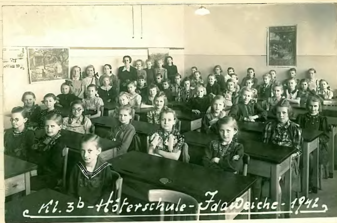
Kl. 3 b - Höferschule - Fdoweihe - 1942,