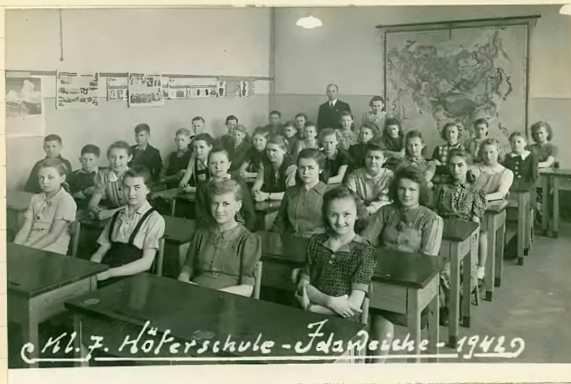
El. 7. Höferschule - Falsche - 1942