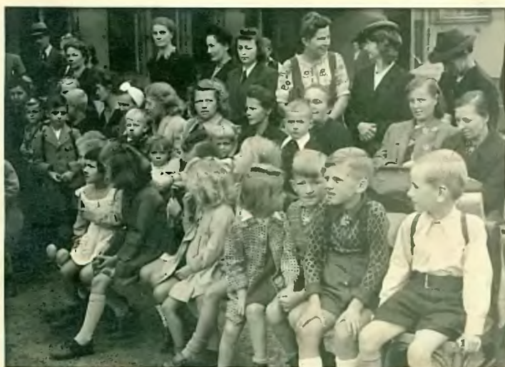
Bald komme ich dran!