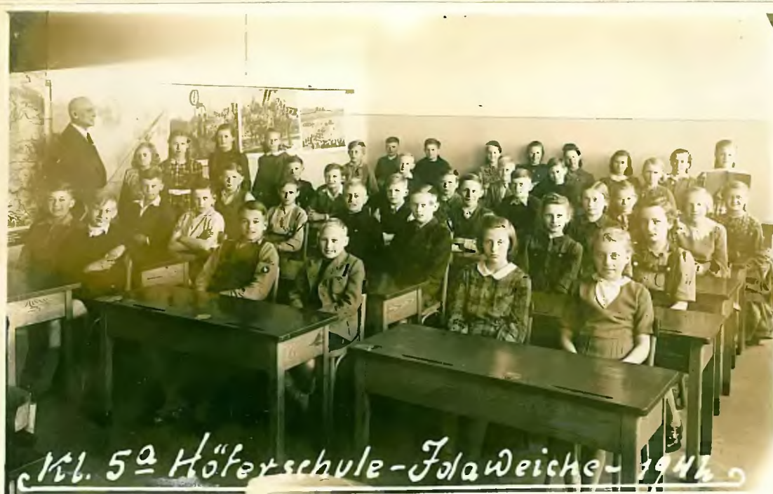
Kl. 5a Höferschule - Jda Weiche - 1942