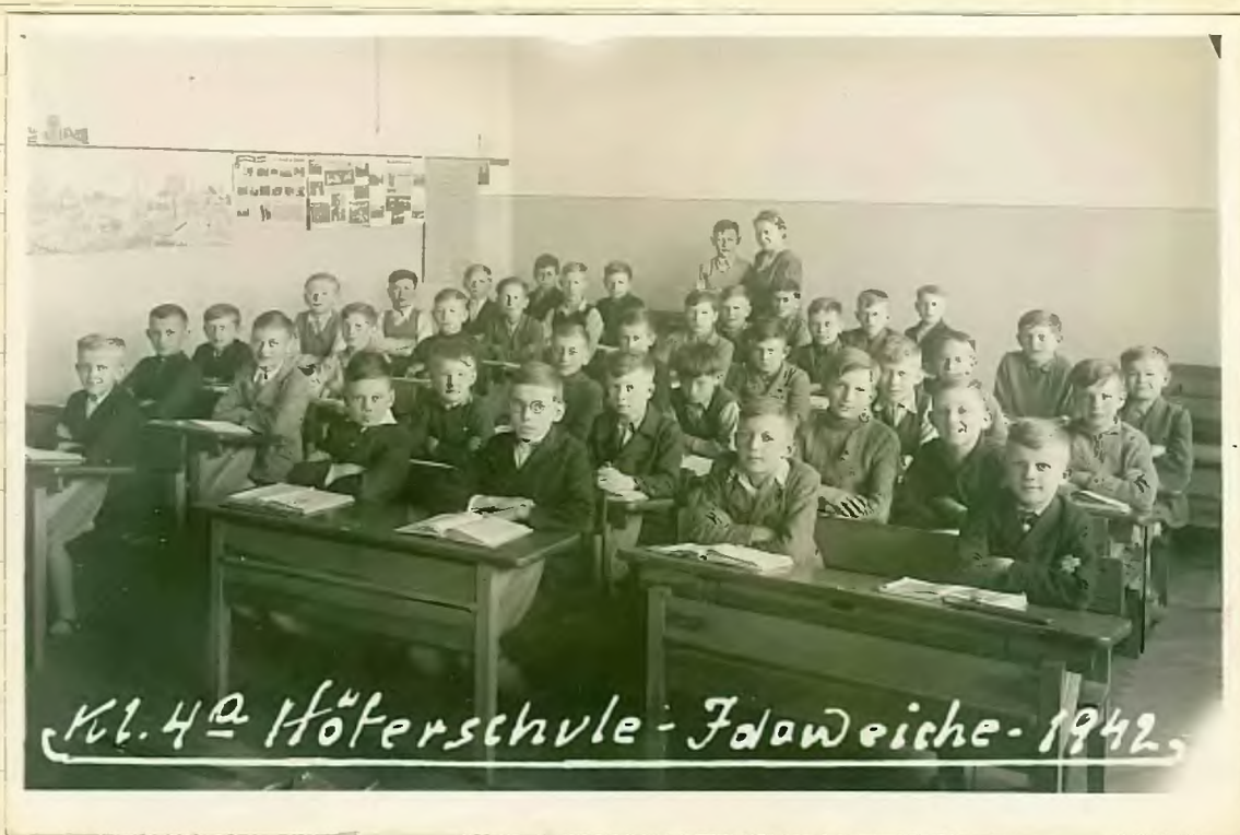
Kl. 4 a Höferschule - Fdoweihe - 1942,