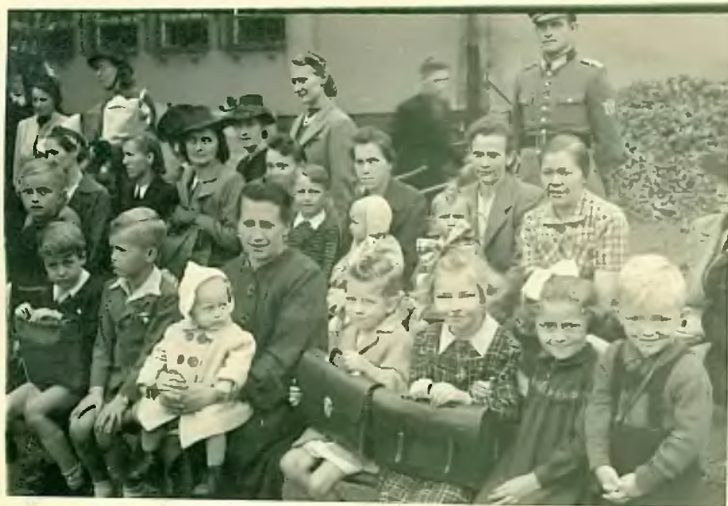
In Erwartung des Aufrufs.