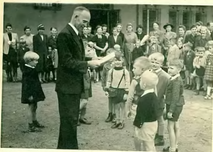
Aufnahme der Schulneulinge.