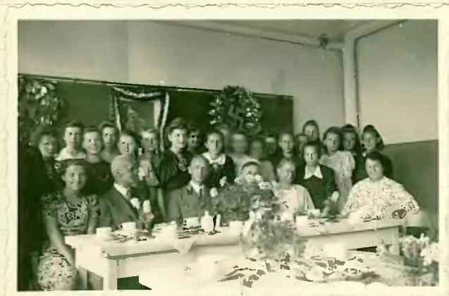
Die Entlassschüler der Klasse 7

Das alte Schuljahr 1941/42 endete am 12. Juli mit der feierlichen Entlassung von 22 Knaben und 30 Mädchen.