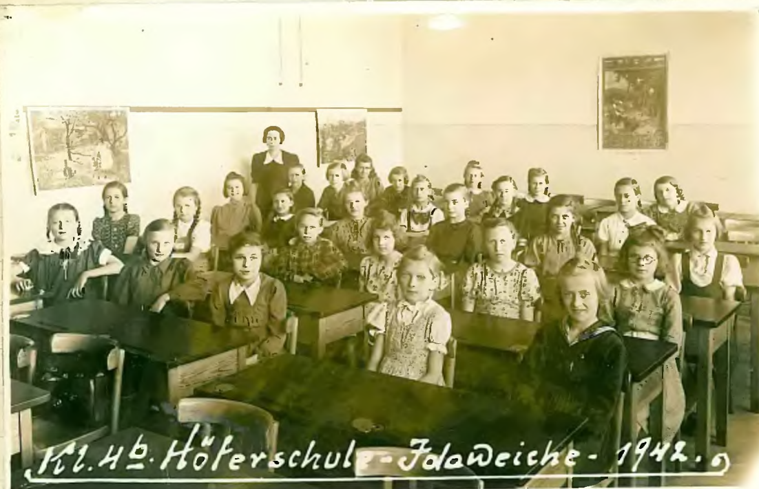
Kl. 4b Höferschule - Jda Weiche - 1942