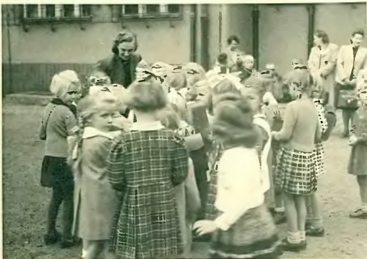
Unsere neue Lehrerin,