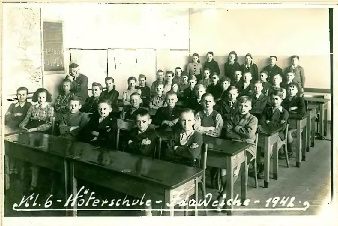
Nr. 6 - Höferschule - Schwetche - 1942.