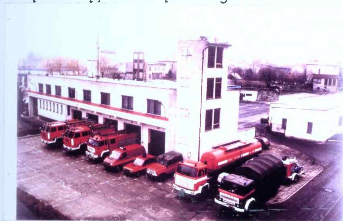
Siedziba Komendy Powiatowej i Zarodowej Straży Pożarnej od 1971 r. - zdjęcie przedstawia stan na 1998 r.

1 stycznia 1968 r. decyzją Wojewody Opolskiego została utworzona Zarodowa Straż Pożarna przy Powiatowej Komendzie Straży Pożarnych w Głubczycach, co spowodowało konieczność budowy w latach 1968-1971 nowej strażnicy. W 1968 r. rozpoczęła się budowa strażnicy przy ul. Kołłątaja a Zarodowa Straż Pożarna wraz z Komendą Powiatową przenieśli się do nowego obiektu w 1971 r.