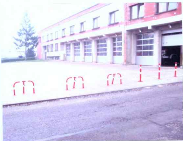
Straznica w trakcie rozbudowy- V ETAP wrzesień 2007 r.