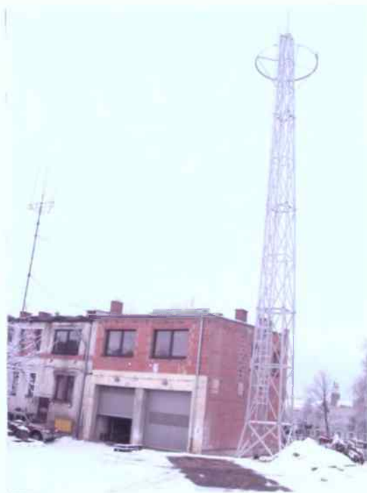
Strażnica w trakcie rozbudowy - III ETAP grudzień 2005 r.