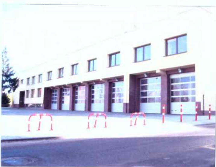
Straznica w trakcie rozbudowy- VI ETAP grudzień 2007 r.