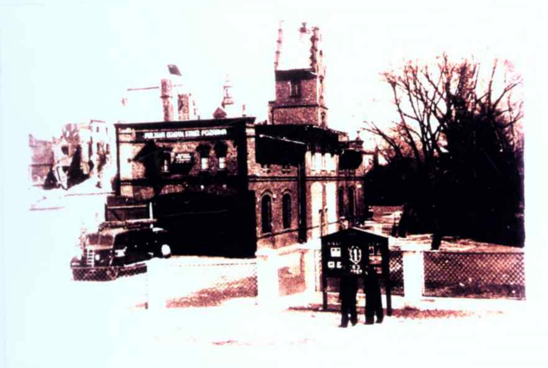
Budynek strażnicy przy ul. Moniuszki w Głubczycach - stan w dniu 1952 r.

W latach 1950 - 1967 zabezpieczenie operacyjne powiatu głubczyckiego zapewniała Ochotnicza Straż Pożarna w Głubczycach, działająca przy Powiatowej Komendzie Straży Pożarnych wraz z obsadą etatową kierowców zawodowych. Stan etatowy jednostki wynosił 18 strażaków a strażnica mieściła się w budynku przy ul. Moniuszki (zdjęcie poniżej)