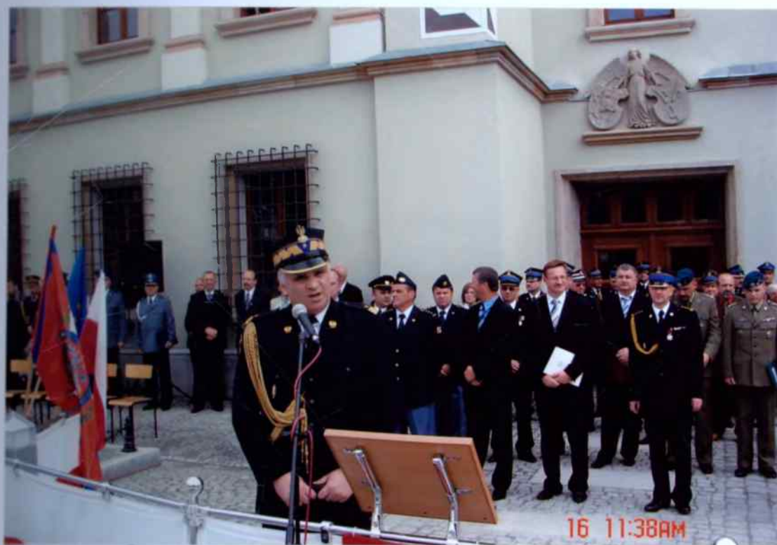
Zastępca Komendanta Głównego PSP nadbryg. Janusz Skulich

Zaproszeni goście kolejno zabierali głos gratulując wyróżnionym i składając życzenia wszystkim strażakom i sympatykom pożarnictwa