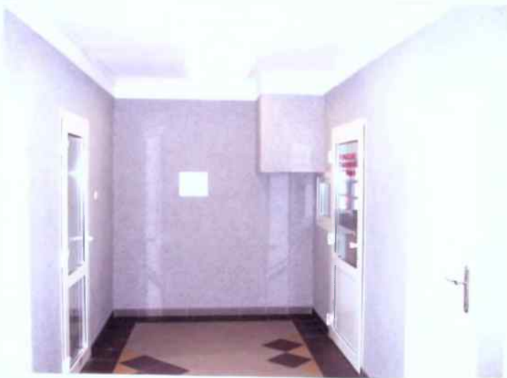
Strażnica w trakcie rozbudowy - II ETAP sierpień 2005 r.