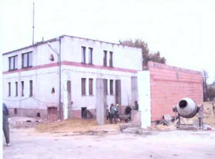
Strażnica w trakcie rozbudowy - I ETAP grudzień 2004 r.