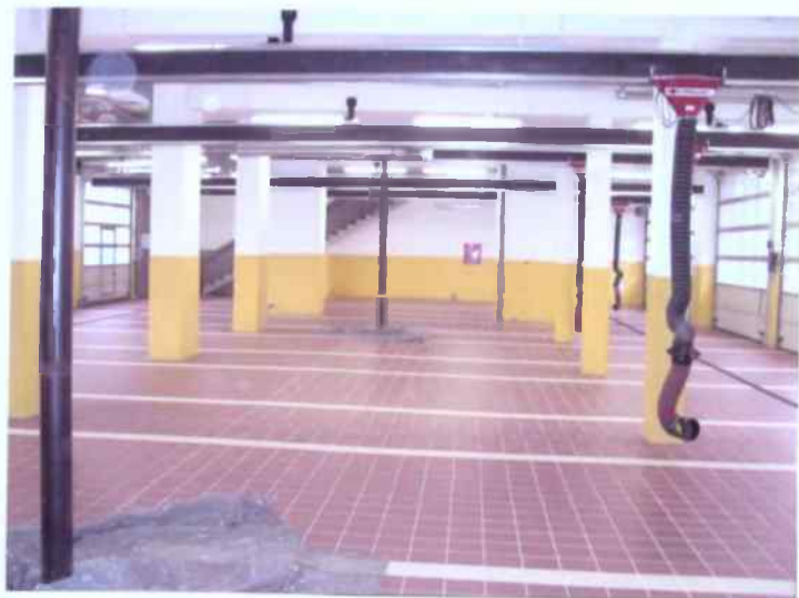
Strażnica w trakcie rozbudowy - IV ETAP lipiec 2006 r.