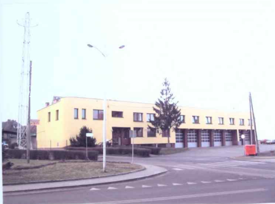
Straznica - stan obecny