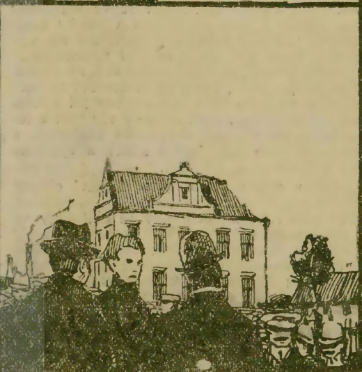
Národně sociální stávkokazové a továrna pod ochranou četníků.

Velký a prudký zápas sociální odehrává se právě v Litomyšli. Obuvnické dělnictvo továrny Lederer a Adler předložilo firmě své skrovné mzdové požadavky a když tyto byly brskně odmítnuty, zahájilo stávku. Leč co následovalo? Národně sociální sekretář Červinka ujednal se židovsko-německou firmou tajnou smlouvu, stávkující dělnictvo zradil a do továrny dodal »bratry stávkokaze«. Černý tento skutek vyvolal nejvyšší rozhořčení mezi litomyšlským dělnictvem,