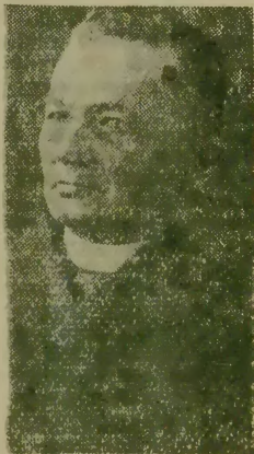
Senator ks. Józef Londzin.