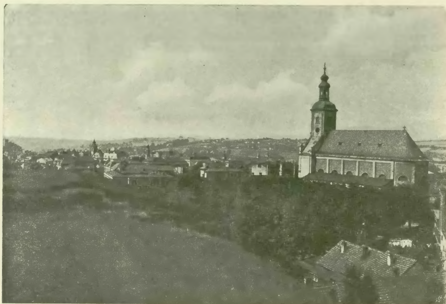
Widok Cieszyna od wschodu.