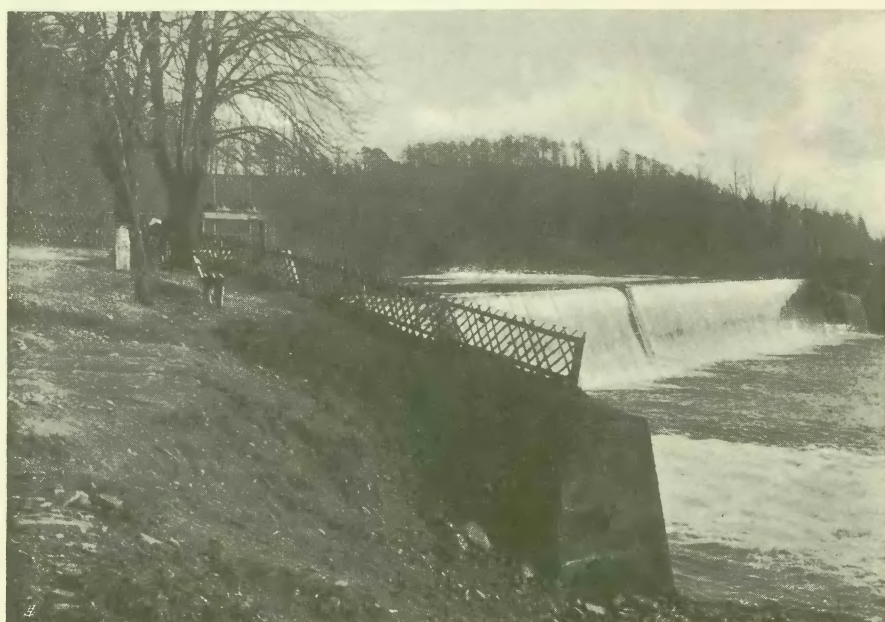
Nowa tama na rzece Olzie.