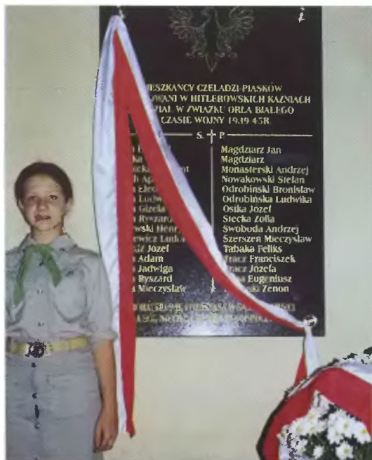
9 V 2001 r. Odsłonięcie tablicy pamiątkowej, w Kościele Matki Boskiej Bolesnej na Piaskach, poległym w czasie okupacji hitlerowskiej pochodzącym z Czeladzi-Piasków za udział w Związku Orła Białego.