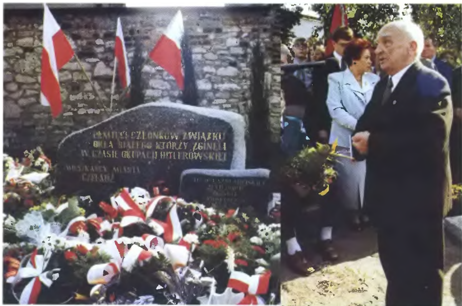
27 IX 2000 r. Uroczystości odsłonięcia obelisku poległych członków Związku Orła Białego