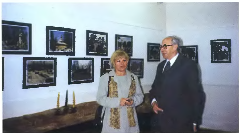
28 X 1999 r. Wystawa fotografii Jerzego Żymirskiego.