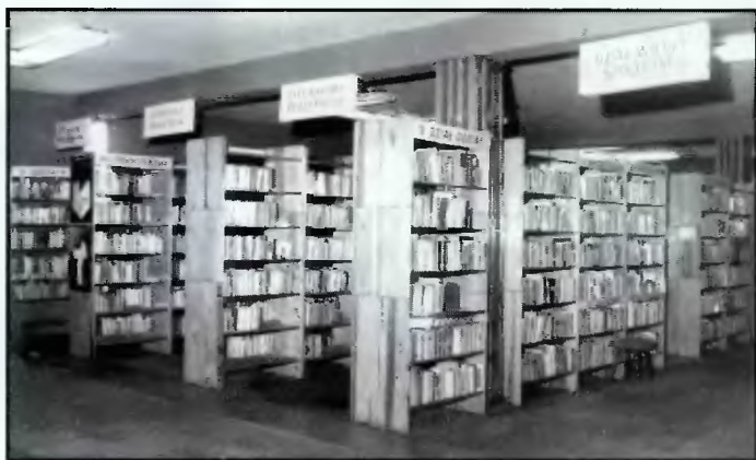
3. Wypożyczalnia dla dorosłych w nowym budynku biblioteki

W 1975 roku wraz ze zmianami administracyjnymi Powiatowa i Miejska Biblioteka Publiczna została podporządkowana Miejskiej Radzie Narodowej i przyjęła nazwę Miejskiej Biblioteki Publicznej. Sieć MBP liczyła wówczas 11 filii. W latach 1970 - 88 otwierano nowe placówki (filia szpitalna w Rydułtowach, filie w Wodzisławiu Śl.: na os. XXX - lecia, w dzielnicy Jedłownik, os. Piastów). Na mocy decyzji Wojewody Katowickiego, MBP w Wodzisławiu Śl. pełniła wówczas funkcję biblioteki rejonowej, sprawując merytoryczną opiekę nad bibliotekami gminnymi wraz z ich filiami. W latach 1982 - 1990 biblioteka finansowana była z Funduszu Rozwoju Kultury.