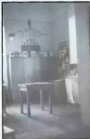
2. Pomieszczenie biblioteczne w latach 50-tych