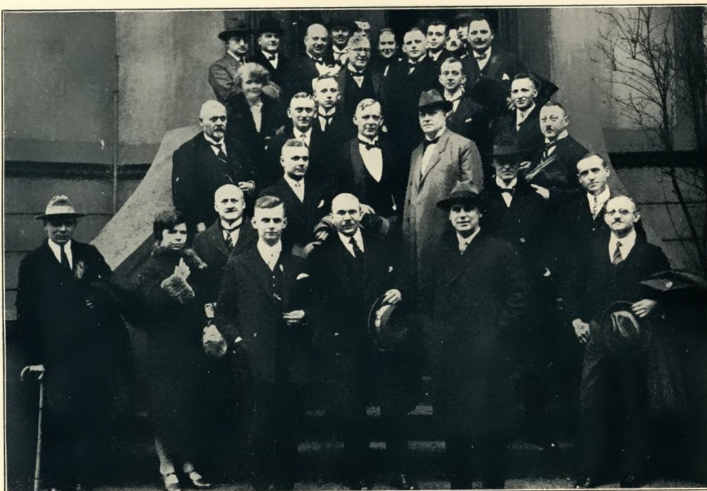
Die Zahnärzte-Tagung in Hindenburg