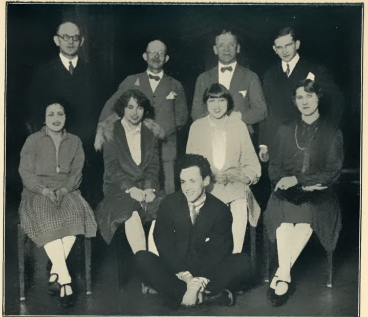
Das Modefest in Hindenburg

Ein für die Stadt Gleiwitz besonders wichtiger Bau wurde in den letzten Wochen fertiggestellt, der so unbedingt notwendige Anbau der Mittelschule. Wenn überall über das Fehlen der nötigen Schulräume geklagt wird, so haben die oberschlesischen Orte dazu ihr besonderes Recht. Sind doch heute noch