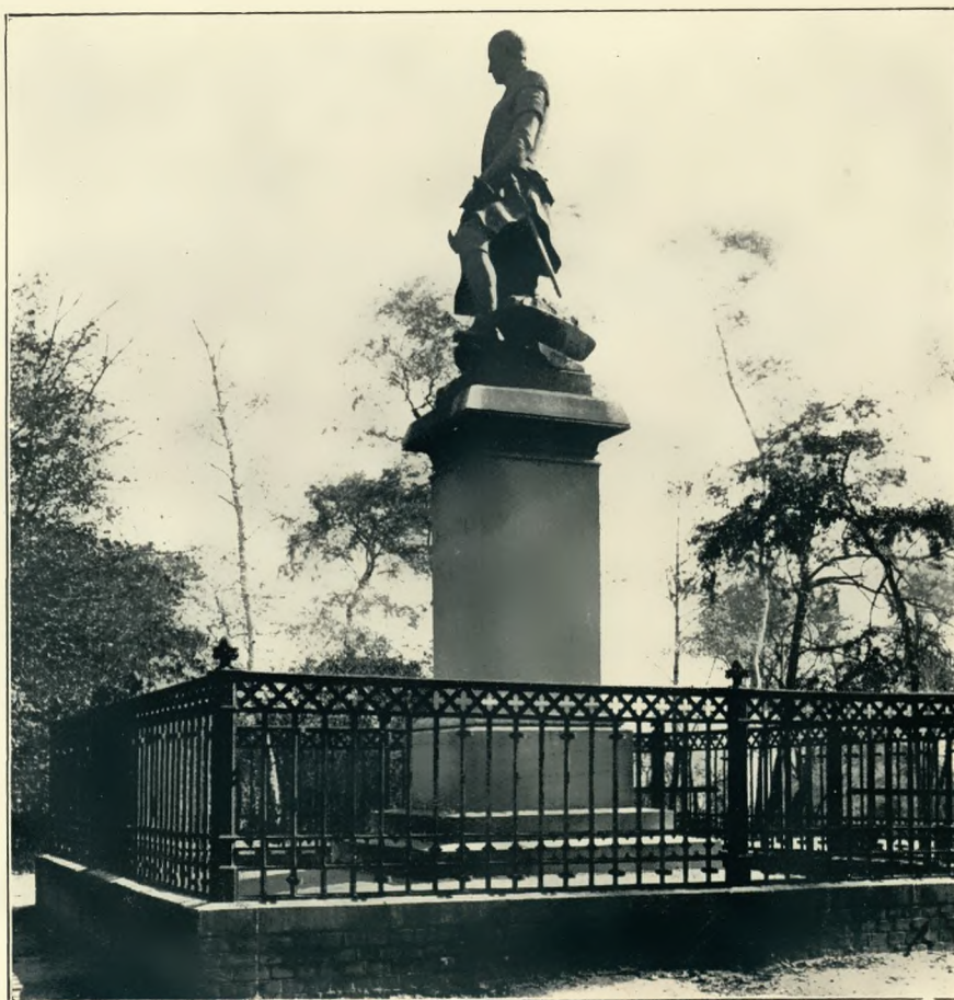
Das Redendenkmal in Königshütte