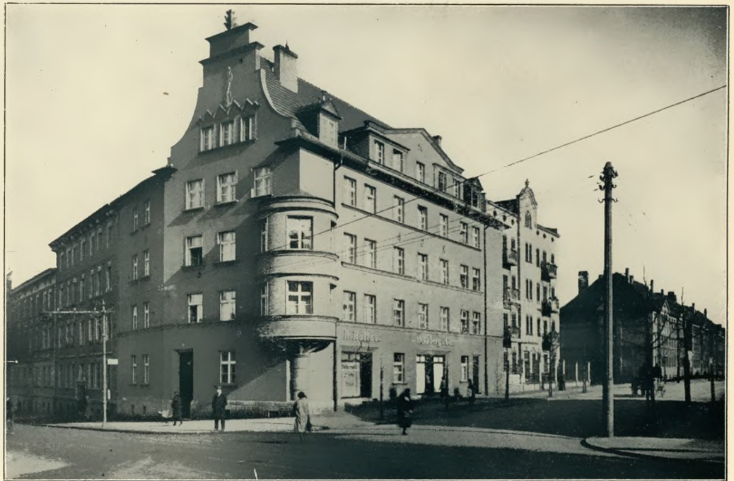
Die neue Ecke Friedrich-Kieferstädteler Straße

Mit welchen ungeheuren Schwierigkeiten ein künstlerisch empfindender Mensch, dem die städtebauliche Ausgestaltung einer oberschlesischen Industriestadt anvertraut ist, zu kämpfen hat, darüber braucht man wirklich nichts mehr zu sagen. Und trotz dieser Schwierigkeiten können wir, die wir diese Zeit des allmählichen Umgestaltens miterleben, sehen, daß ein künstlerischer Wille, verbunden mit Tatkraft, selbst aus den entsetzlich verbauten Städten des Industrielandes allgemach etwas zu gestalten weiß, das den Vergleich mit viel glücklicheren Städten aushält. So in Gleiwitz. Immer mehr dehnt sich die Stadt aus; verhältnismäßig viele Neubauten erstehen. Man ist in der Öffentlichkeit zu gerne geneigt, Urteile über die Einzelercheinung zu sprechen, ohne zu bedenken, daß sich im einzelnen Bau nur ein Teilchen des großen zielbewußten Planes zeigt, nach dem erst langsam eine großzügige Um- und Neugestaltung erstrebt wird. Es ist nicht leicht, allen Forderungen im Städtebau des Heute gerecht zu werden, und nicht mit Un-