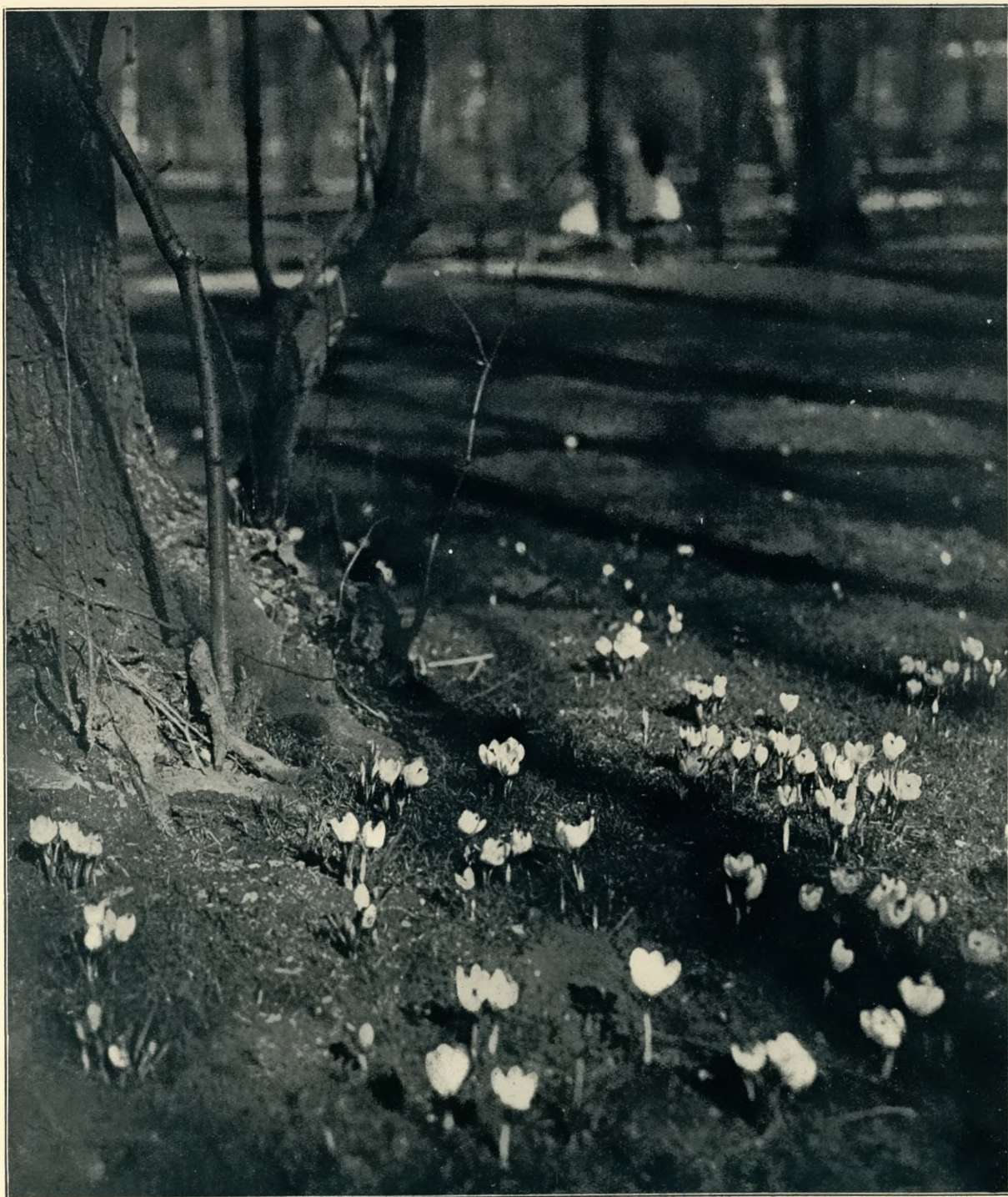
Erster Frühling im Gleiwitzer Stadtpark

Wöchentliche Unterhaltungsbeilage des obererschlesischen Wanderers.