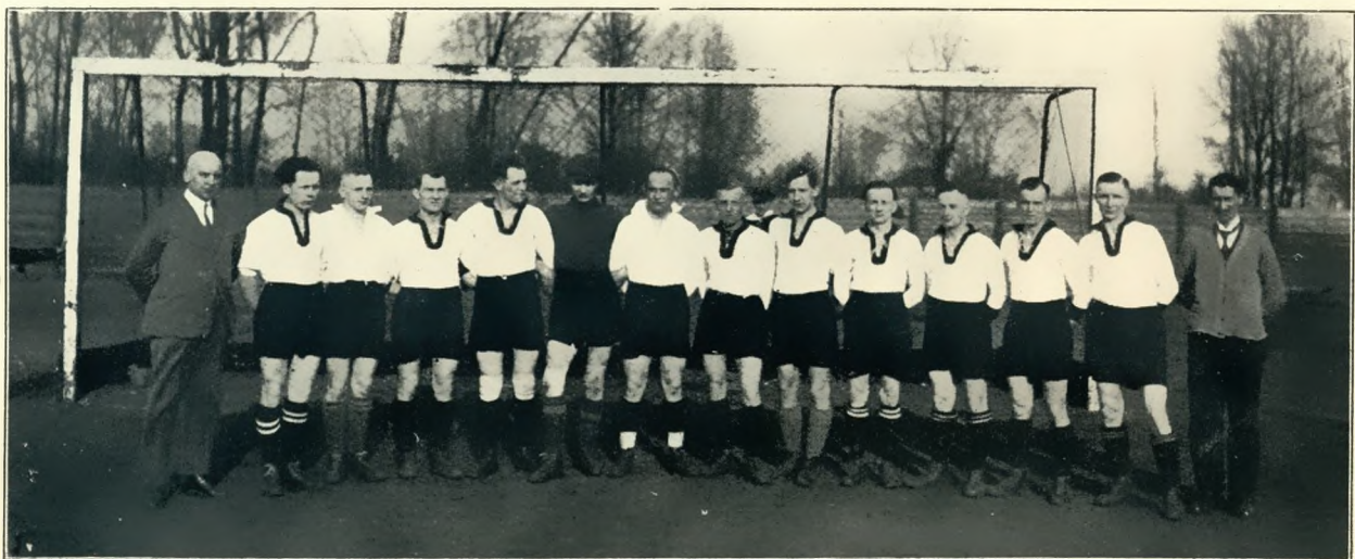
Der neugegründete Eisenbahner-Sportverein Gleiwitz