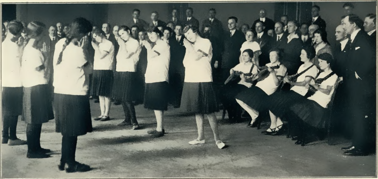
Die bei der Gautagung vorgeführten Volkstänze (Proben für das Gaufest)