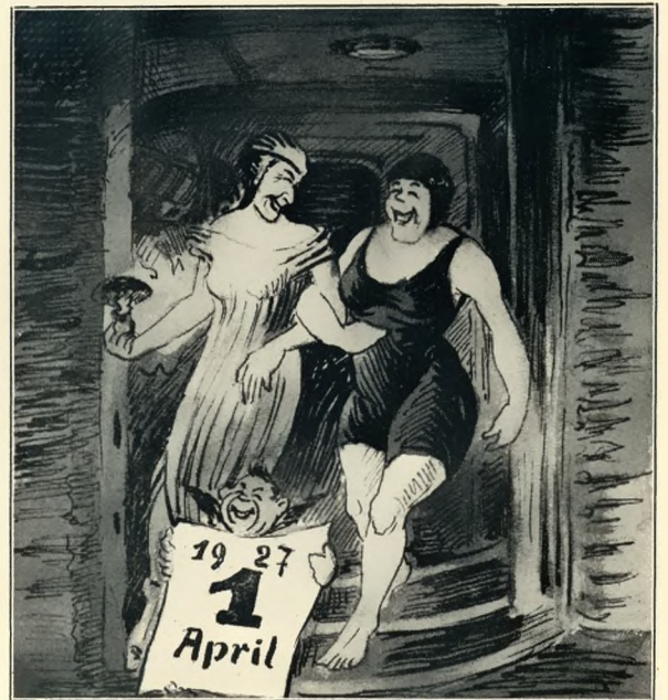
Die April-Missetäter. „Wenn sie uns nur nicht unsere Aprilscherze gar noch übelnehmen!“