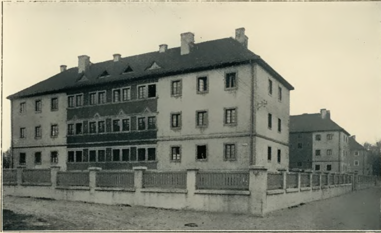
Reichsbauten an der Bergwerkstraße