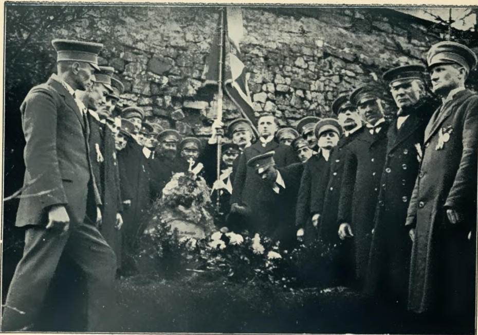
Die Ehrung der gefallenen Selbstschutzkämpfer in St. Annaberg