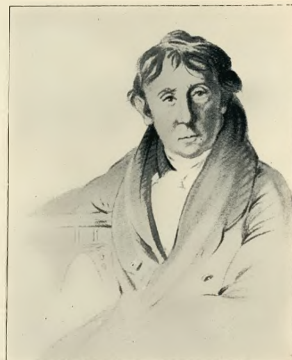
Graf von Reden in seinem letzten Lebensjahr

175 Jahre waren es nun am 23. März d. Js., daß Graf von Reden das Licht der Welt erblickt hatte. Wie viele, besser wie wenige werden auch hier in Oberschlesien, für das der tatenvolle Bergbeamte die Hauptarbeitskraft seines ganzen Lebens mit aller Liebe zu dem Lande aufopferte, daran gedacht haben! Daß mehr und mehr wieder der um Oberschlesien hochverdienten Männer gedacht werde, diesem Ziele möge diese Erinnerung an Reden dienen!