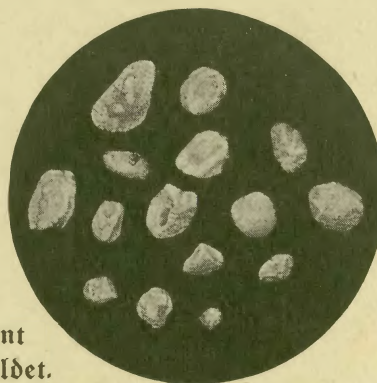
Diese Nierensteine wurden ohne Operation entfernt und sind in natürlicher Größe abgebildet.