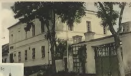
Kosellek's Gasthaus m. Denkmal