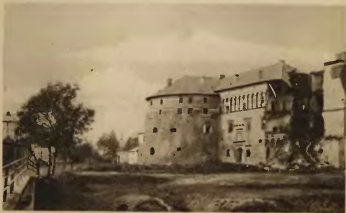
7. Brzeżany. Zamek

Zewnętrzna ściana pld.-wsch. narożnika, najwięcej ozdobiona, ma okna w pięknych kamiennych oprawach, u góry szeroki arkadowy fryz z pilastrami, w których mieściły się strzelnice — dotkliwie uszkodzone w czasie wojny pociskami rosyjskimi) wyłom w ścianach i dach zniszczony). Na szczęście ocalała znajdująca się tu piękna