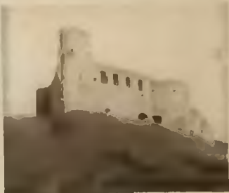
23. Sidorów. Ruiny zamku. Fot. Radomski

Na południe 7 klm. od Husiatyna w Sidorowie wznoszą się na cyplu wzgórza okazałe ruiny zamku niegdyś Kalinowskich, pochodzącego z XVII w. Zamek ten był wielokrotnie zdobywany przez Turków, Tatarów, Kozaków i jeszcze do końca w. XVIII był zamieszkały. Zamek zbudowany z łamanego kamienia, w formie wydłużonego prostokąta, z kilkoma basztami. Jedna z tych baszt była trójkątną na trzy piętra wysoką z kazamatami parterowymi zaopatrzonemi w strzelnice i ubikacjami mieszkalnemi na piętrach, a obok znajdowały się dwie półokrągłe potężne baszty, które razem tworzyły najsilniejszą i najlepszą do dziś zachowaną część zamku. Ponadto zewnętrzne ściany zamku były wzmocnione od strony zachodniej trzema, od wschodniej zaś dwoma basztami piętrowymi zaopatrzonemi w strzelnice.