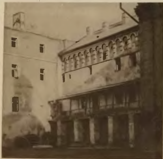
9. Brzeżany . Dziedziniec zamkowy.