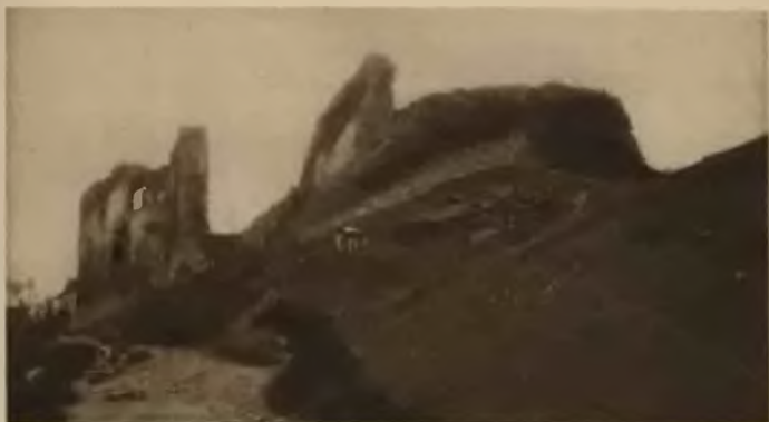
12. Buczacz. Ruiny zamku.