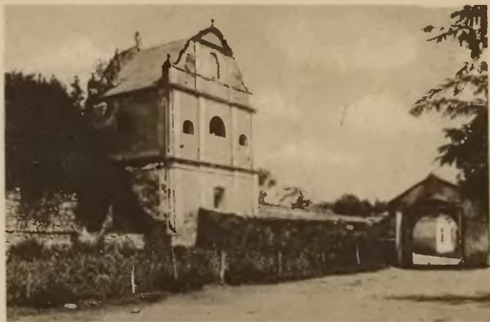
57. Zbaraż. Dzwonnica kościoła OO. Bernardynów.

i zawalone gruzami, zachowały się jedynie ściany zewnętrzne. Obramienia okien i drzwi ciosowe, u góry gzymsy. Pod pałacem widać sklepione piwnice i chodniki zawalone gruzami, chodniki te miały łączyć również zamek z klasztorem, a świadczy o tem fakt, że przy kopaniu fundamentów, w mieście napotyka się często na sklepione piwnice lub chodniki. Budowa pałacu wskazuje, że wzniesiony był wedle dokładnie opracowanego planu z wielką symetrią i starannością.