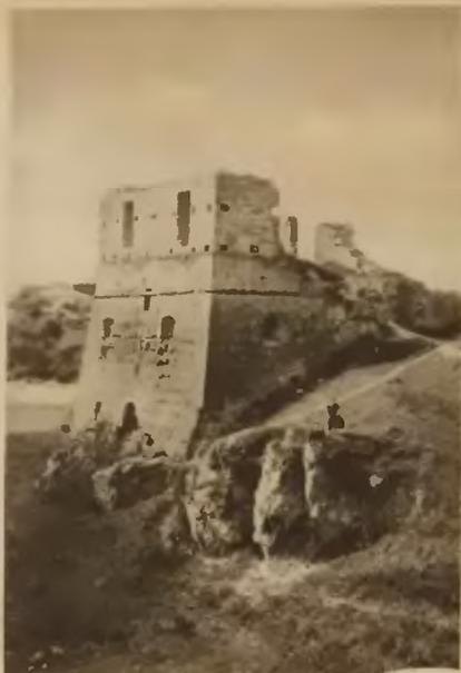
60. Toki . Ruiny zamku.

na górze za wsią, wznoszą się ruiny zamku ks. Wiśniowieckich. Mury zamku miały postać trójkąta z trzema basztami po rogach, posiadającymi strzelnice. Zachowała się jeszcze baszta pięcioboczna, pozatem pozostała tylko część ściany wschodniej i południowej. Zwiedzający ze względu na strefę pograniczną winni się uprzednio zaostrzyć w Starostwie w Zbarażu w specjalne przepustki.