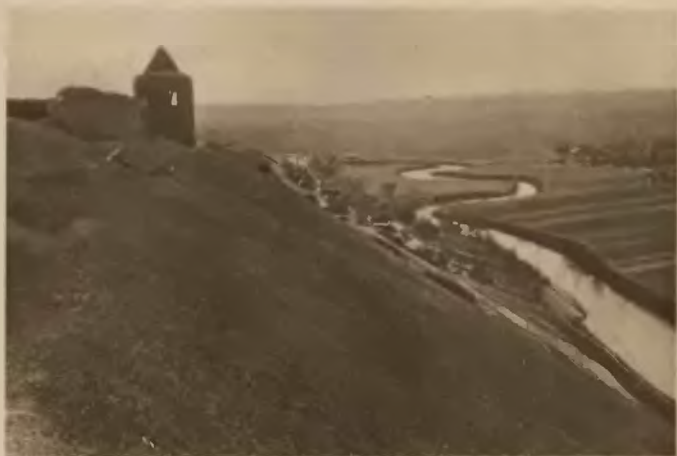
44. Trembowla . Jar Seretu pod monasterem.