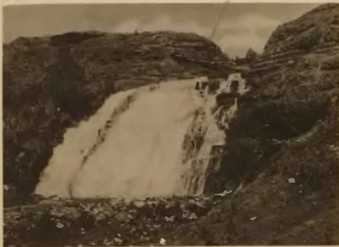
51. Czerwonogród. Wodospad Dżurynu.

Na krawędzi kotliny kościół z 1716 r. U wyjścia z kotliny Czerwonogrodu największy na Podolu wodospad rzeki Dżurynu, na 16 m. wysoki. Jarem tej rzeki,