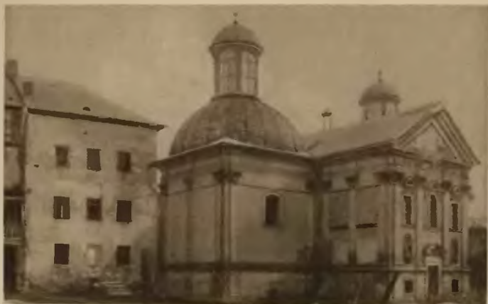
8. Brzeżany . Kaplica zamkowa i brama.