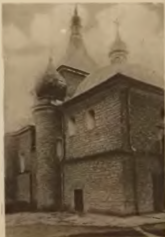
Fot. Laub 38. Tarnopol. Cerkiew parafjalna.

Cerkiew parafjalna przy ul. Ruskiej, zbudowana została z kamienia łamanego prawdopodobnie z początkiem XVII wieku, chociaż fundamenta i część murów zdawałyby się wskazywać, że stała na tym miejscu budowla znacznie wcześniejsza, może z XV w. Jest ona rzadkim w Polsce typem starej cerkwi wzorowanej na architekturze wschodniej.