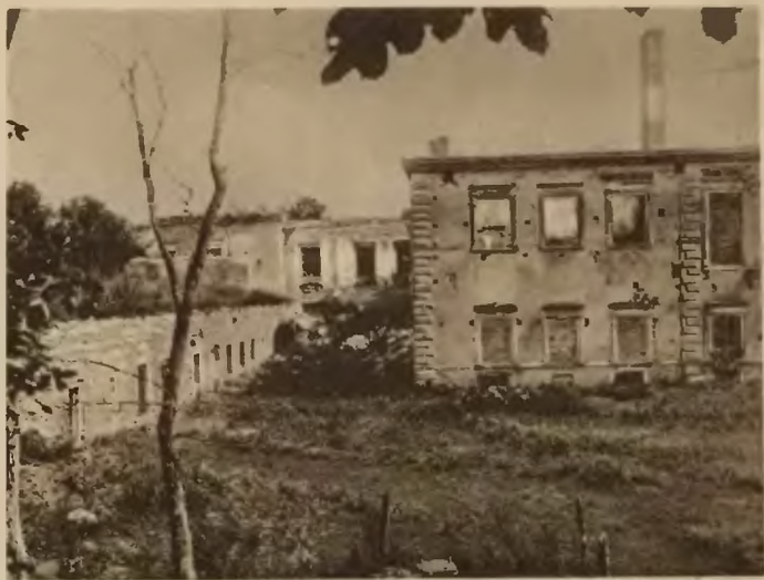
55. Zbaraż. Ruiny zamku.