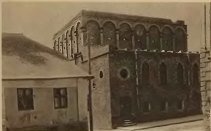
37. Tarnopol. Bożnica.

pochodzenia jest bożnica przy ul. Perła, wybudowana w 1813 r. z kamienia, posiada bogatą bibliotekę zaopatrzoną w dzieła hebrajskie.