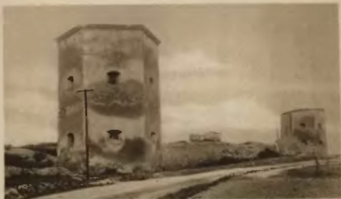
5. Krzywce. Ruiny zamku.

w kształcie trójkąta i umocniony basztami. W środku obwarowań, z których jeszcze zachowały się znaczne resztki, znajdują się ruiny późniejszego piętrowego budynku, a mianowicie pałacu zbudowanego przez Tarłów w XVII w. i spalonego w XVIII w. Nad drzwiami ruin piękne ornamenta kamienne t. j. ciosowe obramienia okien i drzwi. Ponadto zasługuje na uwagę rzymsko-katolicki