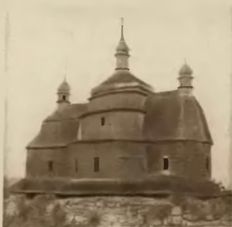
20. Włynanka . Cerkiew

kumenty oraz obrazy rodziny Golskich i Sadowskich znajdują się w Bibliotece konwentu OO. Dominikanów. Zasługuje również na uwagę stary dworek jako za-