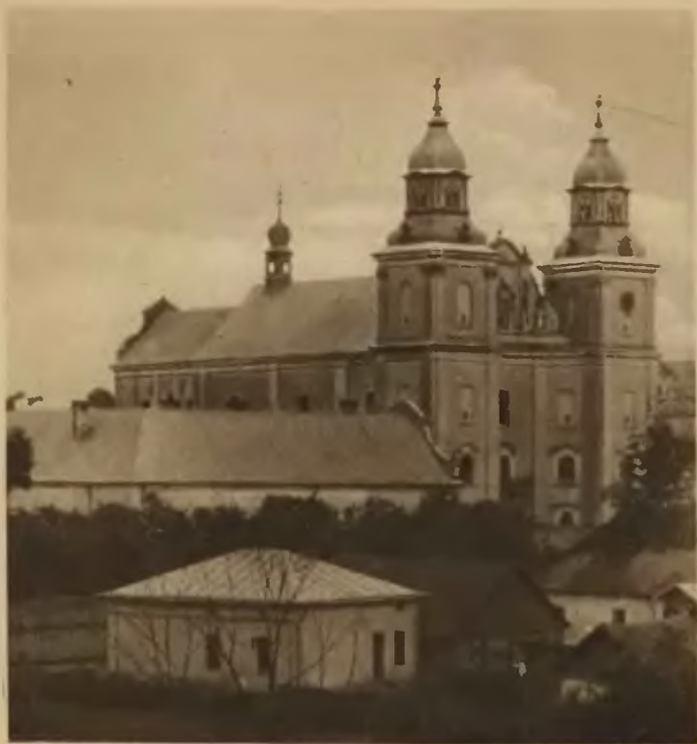
56. Zbaraż. Kościół OO. Bernardynów.

bastjonu prowadziły chodniki sklepione do pałacu. W bastjonach tych były prawdopodobnie i więzienia.