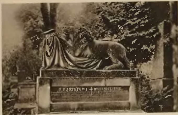
27. Łopatyn. Pomnik gen. Dwernickiego.

skrzydła pałacu mieszkał za czasów hr. Adama Zamojskiego bohater z pod Stoczka Jenerał Józef Dwernicki i tu zakończył dnia 23 lipca 1856 r. swe życie. Zwołoki jego spoczywają na miejscowym cmentarzu. Rodacy i towarzysze broni wzniesli mu wspinały pomnik w postaci kamiennego sarkofagu, na sarkofagu, ozdobionym rzeźbami, widnieje w otoczeniu sztandarów lew jako symbol odwagi i siły. Pomnik jest ogrodzony, sztachety imitują lance kawaleryjskie, a słupy lufy armatnie. Na tymże cmentarzu pomnik w kształcie obeliska nad mogiłą, kryjącą szczątki 60 żołnierzy polskich w okrutny sposób porąbanych przez bolszewików w czasie walk w roku 1920. Między Łopatynem a Podmonasterkiem ogromne wały ziemne z czasów wojen kozacko-polskich, ciągnące się niemal aż po Beresteczko.