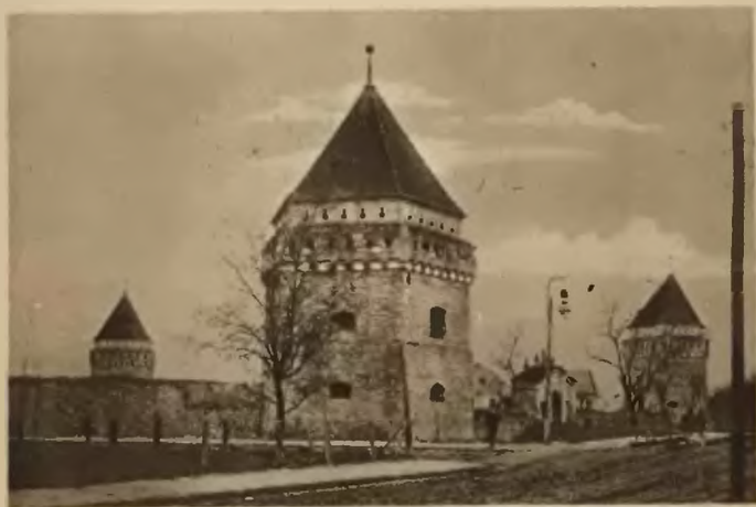
28. Skałat. Baszty zamku.

Powiat skałacki godny jest zwiedzenia głównie dla wycieczek w Miodobory. Punktami wyjścia są Skałat, Grzymałów.