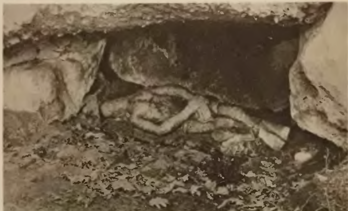
32. Kręciłów. »Boży Grób« w pustelni.

łożenia, jakoteż z powodu znajdującej się tam w »Puszczu« pustelni, w której przebywali przez wiele lat asceci, wiodący świątobliwy żywot. Charakterystyczne są znajdujące się w tej pustelni figury świętych jak np. »Boży grób«.