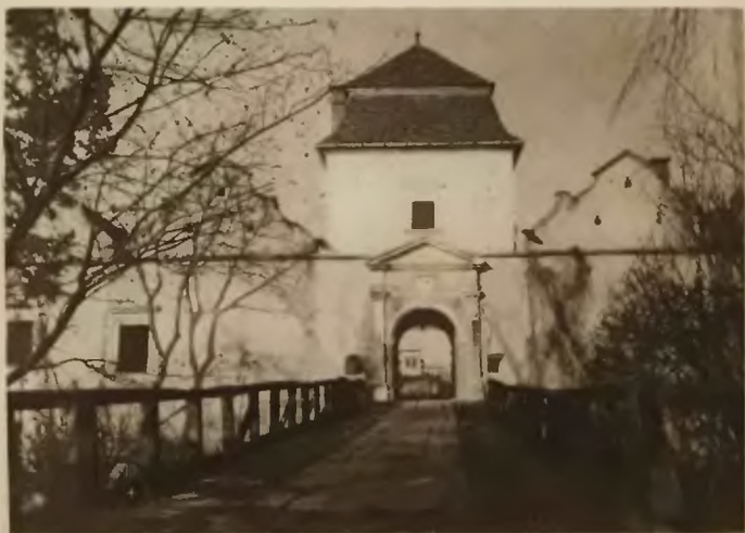
25. Świrz. Brama wjazdowa do zamku.

Na szczególną uwagę zasługuje front z bramą wjazdową w środku i dwiema basztami po rogach. Brama, do której można dostać się po drewnianym moście nad fosą zamkową, znajduje się w czworobocznej piętrowej wieży, jest zaopatrzona w piękne obramienia, strzelnice, a nad bramą herby dawnych właścicieli. Drzwi i okna w zamku a szczególnie w basztach narożnych, są orna-