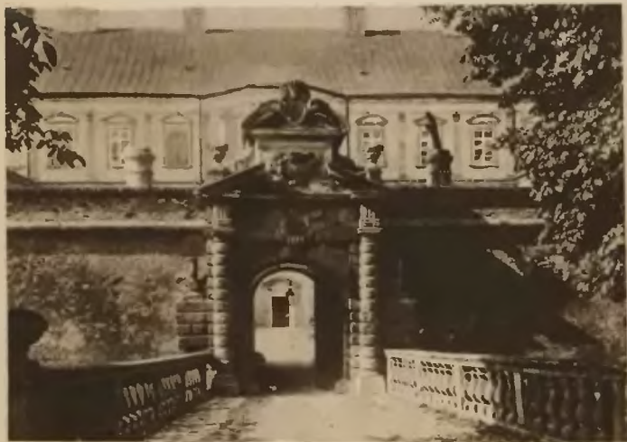
62. Podhorce. Brama zamkowa.

Zamek zawiera kilkadziesiąt sal i komnat, z których szczególnie na I piętrze położone, nadzwyczaj bogato były ozdobione. Tam też znajduje się piękna kaplica zamkowa. Sale miały ściany kryte adamaszkiem, od którego barwy nosiły nazwy, jak: sala karmazynowa, złota, zielona, żółta i t. p. Ozdobione były nadzwyczaj bogato obrazami, nieraz ogromnej wartości artystycznej, nadto zaopatrzone w wszelaki sprzęt, jak: krzesła, sofy, sekretarzyki, szpinety, i t. p. cacka meblarskie, istne