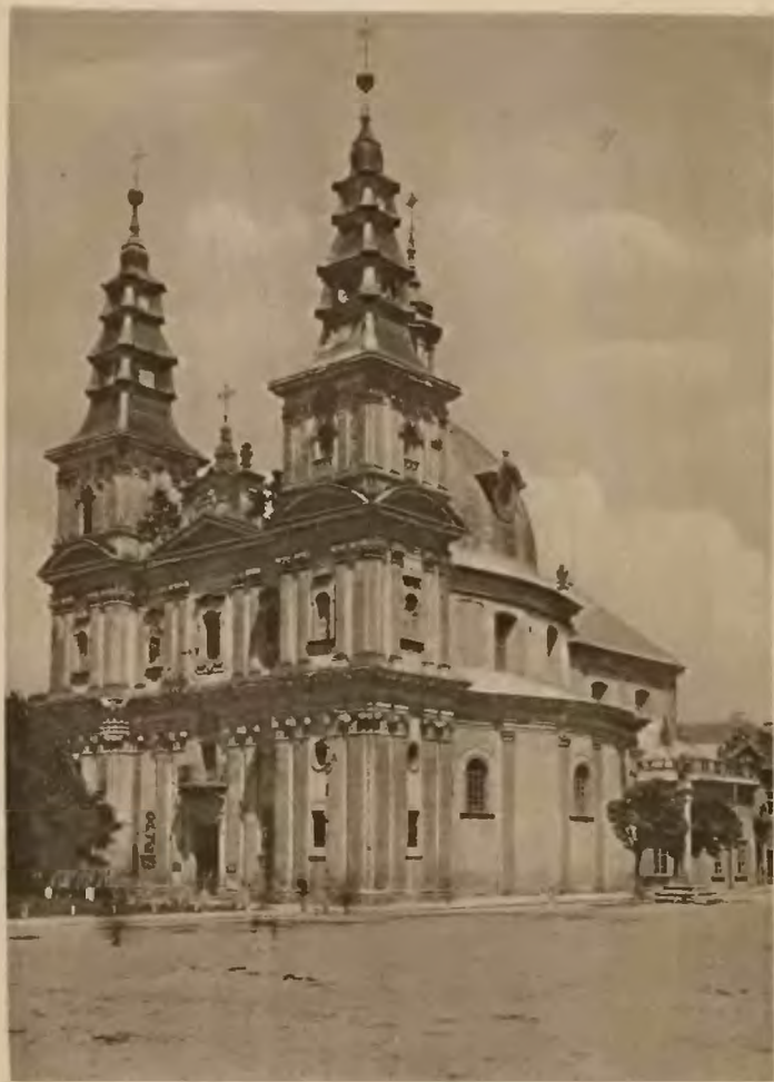
35 Tarnopol. Kościół OO. Dominikanów