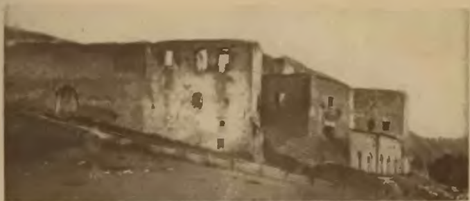
18. Wygnanka. Ruiny zamku.