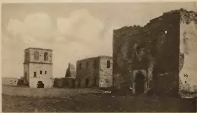
45. Podgórzany . Ruiny monasteru Bazylianów.

w Europie północno-wschodniej jedyną, pod względem swego stylu budowlą monumentalną kościoła starochrześcijańskiego.