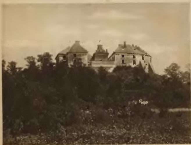
66. Olesko. Zamek.

W Olesku słynny zamek, należący do najważniejszych zabytków kraju. W r. 1629 urodził się tu król Jan Sobieski. Na obecny wygląd zamku składały się wieki. Podstawę zamku stanowi fortalicja litewska z XIV wieku przerobiona w XVI wieku na siedzibę magnacką. Zamek,