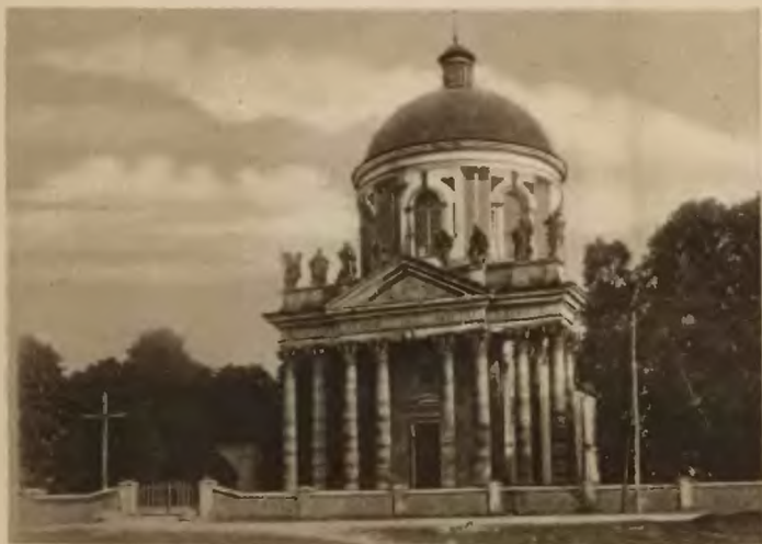
64. Podhorce. Kościół.

Na ścianach mnóstwo malowideł i portretów. Nie one jednak były treścią sali, lecz wspaniały zbiór zbroji i broni, podobno naj- bogatszy w Europie; zawierał w sobie 37 pełnych husarskich ryn- sztunków. Następnie sala karmazynowa, o posadzce marmurowej, ścianach adamaszkiem wybitych i bogatym suficie z malowidłami mitologicznymi, z którego zwisały ozdobne pająki weneckie. Na ścianach wisiały obrazy Tycjana, Caraoccia, Rubensa, Rembrandta, a meble w stylu Ludwika XIV przesłane z Francji królowej Ma- rysieńce. Obok pokój chiński, dalej sala złota, bogata w malowidła i sztukaterje, marmurowe portale i kominki. Dalsza sala zwiercia- dłowa lśniła od weneckich luster, sufit malowany obrazami o treści biblijnej, na ścianach obrazy Guida Reniego, Tintoretta i Veronesa.