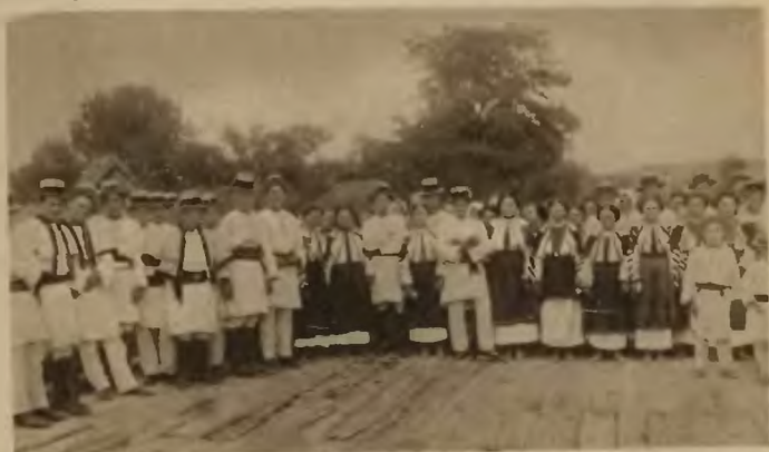
z. Złote Bilcze . Typy ludowe.

czowa, leży Bilcze Złote , wielka wieś w jarze Seretu z pałacem Sapiehów wśród ogromnego parku. — Mieszkańcy wsi zachowali nadzwyczaj malownicze i piękne stroje ludowe. Na północ od wsi znajduje się jaskinia Werteba , labirynt podziemnych i niezbyt wysokich chodników. Wykopaliska z jaskini świadczą o licznej jej zaludnieniu jeszcze w epoce neolitycznej. Są to jedne z najbardziej znanych źródeł polichromowej ceramiki przedhistorycznej. W jaskini znaleziono wiele naczyń, wyro-