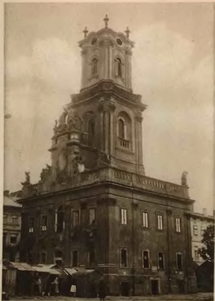
14. Buczacz. Ratusz.