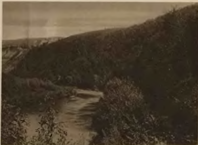
48. Holihrady. Jar Seretu.

Ulubionym celem spacerów jest w pobliżu Zaleszczyk położona wieś Dobrowlany . Znajdująca się tam cerkiewka miała być, według podania, przez powódź przyniesiona z Buczacza. W czasie wojny krymskiej (1854) Zaleszczyki ufortyfikowano, z czasów tych napotkać można w okolicy szance. Od miasta na wschód prowadzi gościniec państwowy po przez uroczy i zalesiony jar Obiżowej (4 klm.) do Nowosiółki Kostiukowej. (22 klm.). Gościniec ten wznosząc się ku wyżynie serpentynami po Kasperowce, obfituje w piękne widoki. W tem miejscu przecina go Seret, który między Holihradami a Lesiecznikami tworzy jeden z najpiękniejszych jarów Podola . Spotyka się tu wciąż grupy fantastycznych skał, spr-