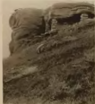
4. Monastyrzek . Świątynia pogańska.

Jar Seretu między Bilczem Złotem a Monastyrkim, pełen pięknych widoków przypomina wyglądem okolice górskie.