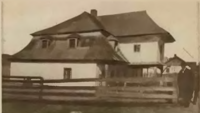
19. Włynanka . Stary dworek.