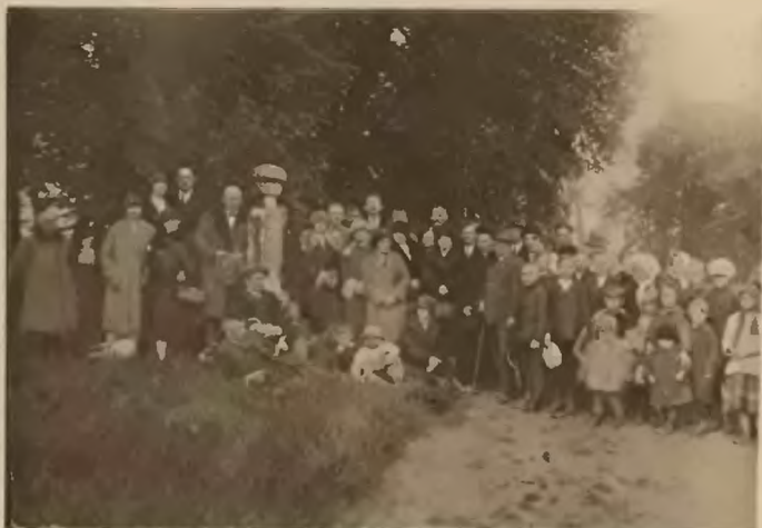
42. Płotycz . Nagrobek turecki.

Ulubionemi miejscami wycieczkowemi, licznie w niedziele odwiedzanemi są lasy w Gajach i Petrykowie. Z tego ostatniego, położonego wysoko nad brzegiem Seretu, roztacza się piękny widok na miasto. Dalszą pieszą wycieczkę woźna odbyć w kierunku południowym wzdłuż Seretu do wsi Ostrów—Berezowica, 8 klm. od Tarnopola. W Ostrowie piękny pałac i park hr. Baworowskich.