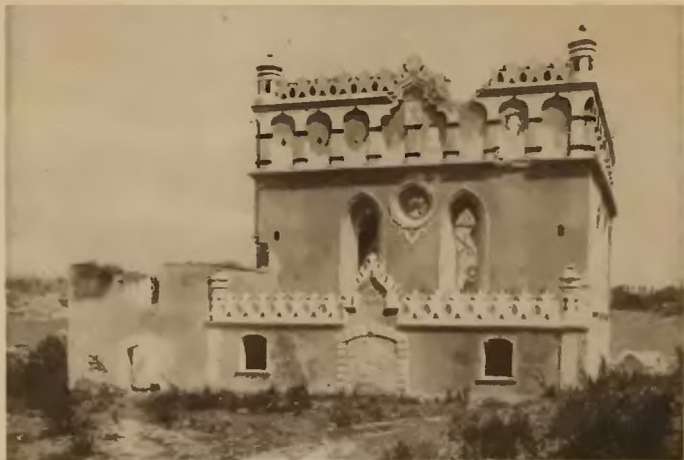
22. Husiatyn . Bożnica stylowa.