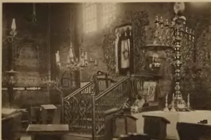
21. Kamionka. Wnętrze bożnicy.

lecki. Związek harcerski, Oddział Wojewódzkiego Towarzystwa Turystyczno-Krajoznawczego.