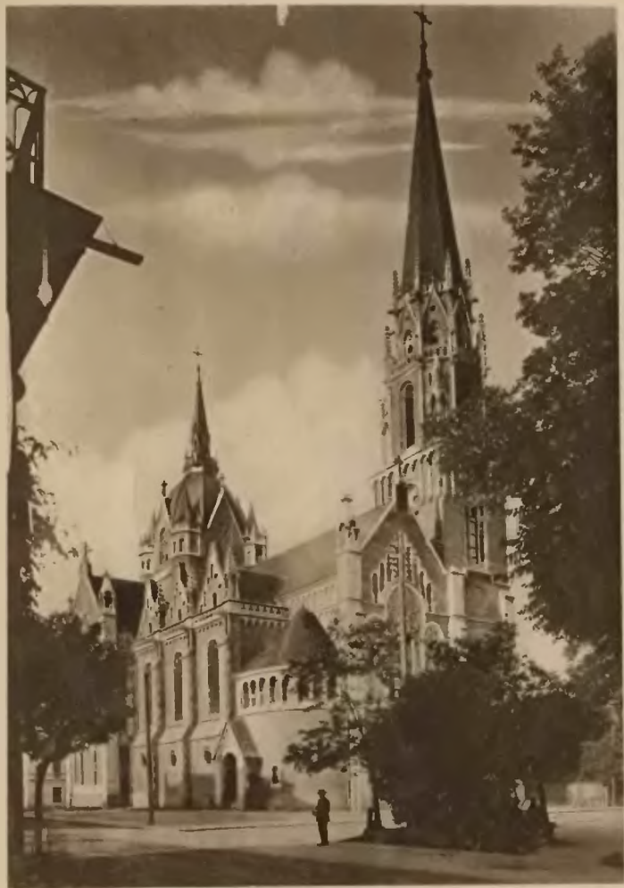
39. Zarnopol. Kościół parafjalny.