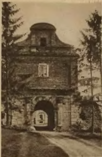
54. Zbaraż. Brama wjazdowa do zamku.

skiemu. W całości zachował się zamek aż do wieku XIX. Od połowy wieku XIX zaczyna się jego upadek. Ostatecznie zniszczony został przez kwaterujące wojska rosyjskie w czasie wojny europejskiej.