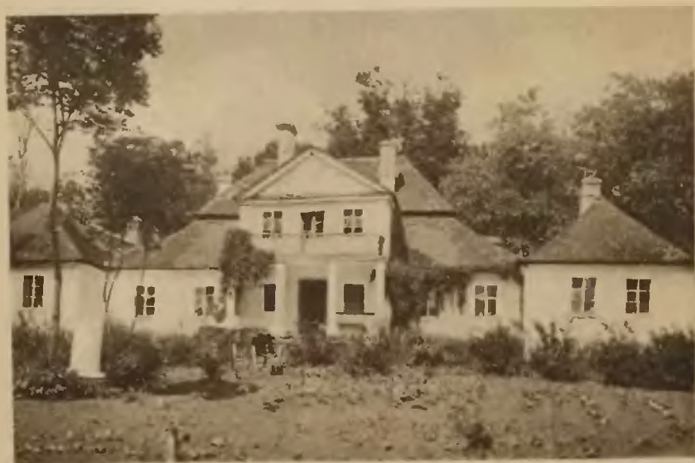
59. Zarubince . Stary dworek.

W Załużu obok Zbaraża cerkiew obronna »Spasa« na sąsiednim wzgórzu koło starego zamku zbaraskiego, zwana powszechnie »Monastyrek« od klasztoru OO. Bazyljanów, który tu niegdyś istniał. Cerkiew ta zbudowana została w r. 1600 przez starostę zbaraskiego Nowickiego, za czasów wojewody braclawskiego, Janusza ks. Zbaraskiego. Świadczy o tem wmurowana tablica z napisem w języku ruskim. Zbudowana z kamienia z wieżą, zaopatrzoną w strzelnice, o beczkowych sklepieniach, posiada niektóre ozdoby architektoniczne w stylu renesansowym, zwłaszcza sklepienia, okna i obramowany kamieniem i gzymsem wchód do wieży.