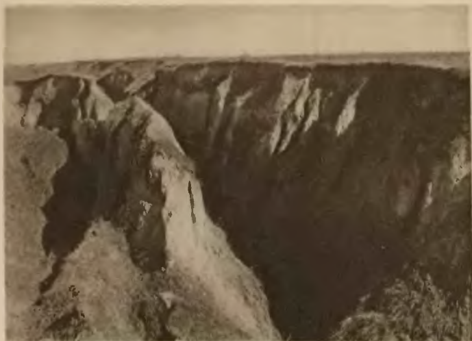
33. Kaľaharówka . Utwory loessowe.

Weiglera. Restauracje: na dworcu kolejowym, J. Teibera, S. Seidena, F. Vogelbauma. Urzędy państwowe: Sąd powiatowy, Urząd celny, Urząd pocztowo-telegr. Organizacje sportowe i społeczne: »Strzelec«, »Sokół«, T. S. L.