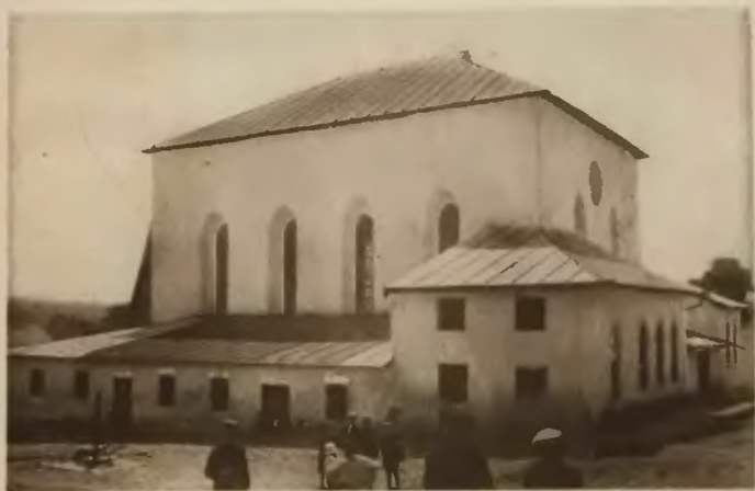
24. Podhajce. Bożnica.