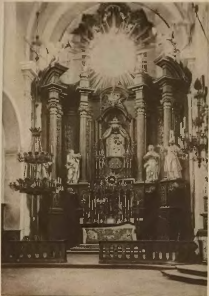
15. Buczacz Wielki ołtarz w kościele farnym. Fot. Niemand