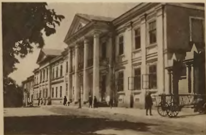
40. Tarnopol. Stylowy budynek.

Poza miastem na wzgórzu cmentarz katolicki, kryje szczątki ofiar wojny światowej, oraz zawiera wiele pięknych pod względem architektonicznym nagrobków. Ponadto w mieście znajduje się szereg charakterystycznych budowli z czasów rosyjskich o kilku wysokich kolumnach na froncie, na których opiera się wiązanie dachowe. Należy tu wymieniona już t. zw. »Pułkownikówka«, budynek Sądu Okręgowego i Starostwa przy ul. Mickiewicza i szereg domów w rynku i na przedmieściach.