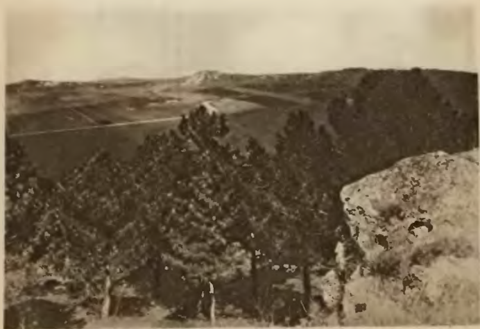
29. Miodobory. Widok z Ostrej Skaly.

Jest to najpiękniejsza część Podola i nosi słusznie