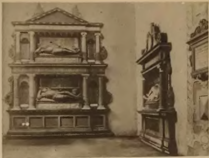
10. Brzeżany. Grobowce Sieniawskich.

wysuniętymi bastyonami po rogach i z trójkątnem umocnieniem przodowem od strony miasta. Gdy ustała burza wojenna, w zamku brzeżańskim odbywały się liczne zjazdy i uroczystości. Gościli tutaj w r. 1648 król August II, w r. 1702 mieszkał tutaj gościnnie podejmowany ks. Franciszek Rakoczy wojew. siedmiogr. i słynny wódz powstańców węgierskich — a w r. 1707 zajechał nawet car wszechrosji Piotr Wielki.