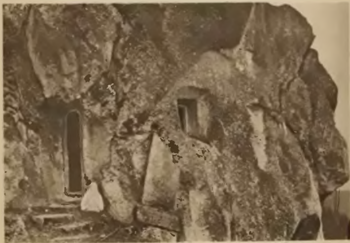
31. Kręciłów. Pustelnia w »Puszczy«.

Jar Kręciłowski, wyżłobiony przez Zbrucz w Mioborach zaczyna się od Satanowa, miasteczka położonego na stronie rosyjskiej po Trybuchowce, długości około 20 km. Najpiękniejsze punkty: Słobódka Satanowska z klasztorem OO. Kapucynów na górze, później