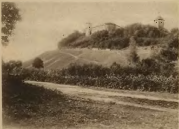
1. Wysuczka. Zamek.

niu z dawnym zamkiem przerobionym na pałac (obecnie własność Czarkowskich-Golejewskich). — Mury zamku tworzyły niegdyś czworobok z basztami po rogach i bramą wjazdową. — Zamek pochodzi prawdopodobnie z XVII w. był dawniej obronny. Zachowały się dwie sześcioboczne baszty, z których jedna posiada jeszcze resztki ozdobnych obramowań okien i drzwi.