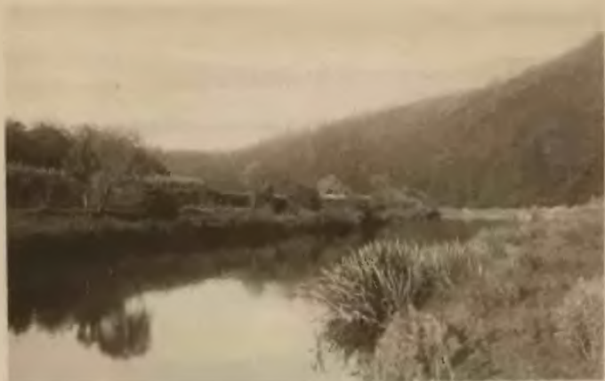
3. Złote Bilcze . Jar Seretu.