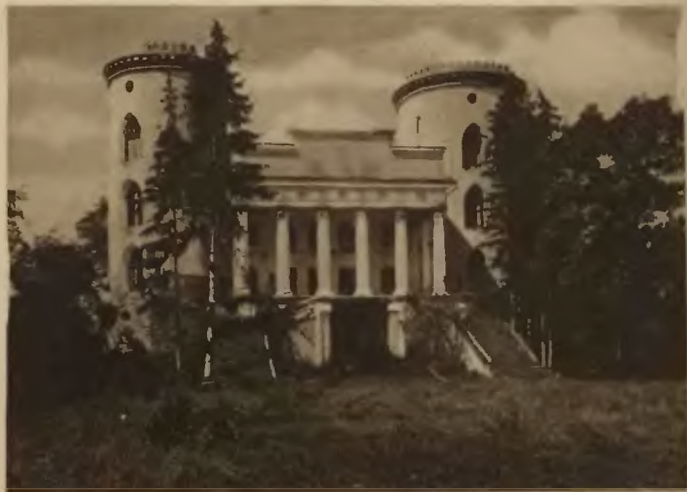
50 Czerwonogród. Pałac.

W odległości 3 klm. od Zaleszczyk piękny las nad Dniestrem w Dźwiniaczu-Żeżawie — z widokiem na Horodnicę (Pokucie) dalej na północny-zachód (27 1 / 2 klm.) Czerwonogród , 10 klm. od stacji kolejowej Worwolińce. Zjazd z tej strony serpentyną, gdyż uroczy ten zakątek położony jest w głębokiej kotlinie rzeki Dżurynu. Czerwonogród — to jedna z najstarszych osad na Podolu. Na wzgórzu murowany zamek obronny zbudowany