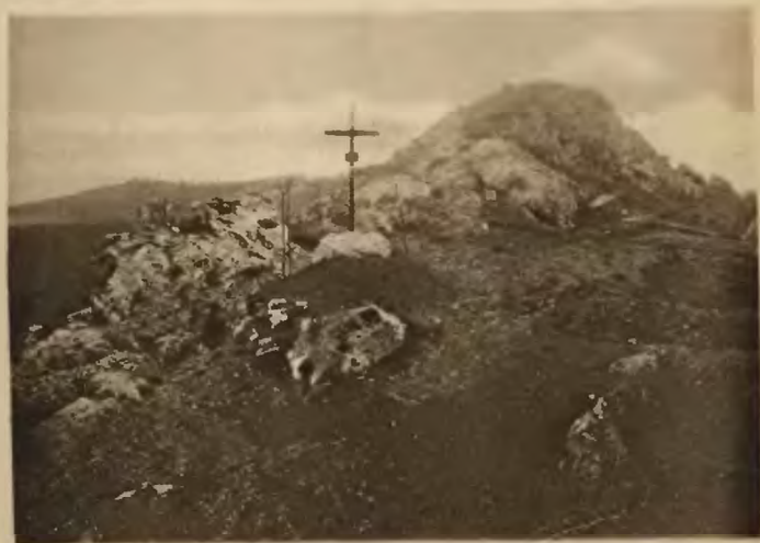
30. Miodobory. Grzbiet skalny.

Najpiękniejsze skały Miodoborów: »Kłodnickie skały« przy Białej Karczmie, na gościńcu z Podwołoczysk do