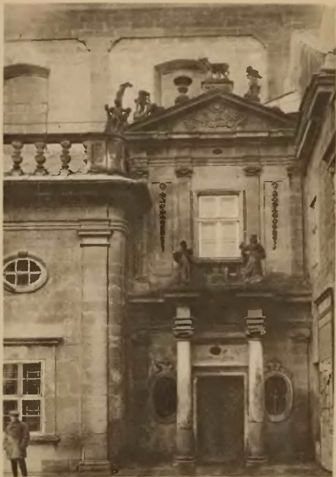
36. Tarnopol. Fasada klasztoru OO. Dominikanów.