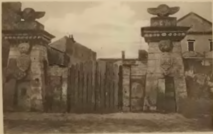
34. Tarnopol. Brama zamkowa.

Zamek położony jest od strony zachodniej na wzniesieniu opadającym stromo ku stawiskowi, w dolnej jego części, zapewne najstarszej, mieściły się dwie kondygnacje kazamat, od podwórza jest wysoki na dwa piętra. Od miasta oddzielony był głębokim, suchym rowem i podmurowanym wałem. Na narożnikach wznosiły się murowane baszty, zaopatrzone w strzelnice. Do zamku można było dostać się przez zwodzony most i murowaną piętrową bramę. Zamek kilkakrotnie był pustoszony, w r. 1675 wojska Ibrahima paszy, mszcząc swe niepowodzenia pod Trembowłą, obrócili go w gruzy. Zamek do pierwotnego wyglądu doprowadzili Sobiescy. Z początkiem XIX w. Franciszek Korytowski przekształcił go na pałac i obok niego od strony południowej wybudował ogromny gmach, zwany »nowym zamkiem«, również zniósł obwarowania, otaczając zamek zwykłym murem. W miejsce dawnej bramy wznosił dwa, do dzisiejszego dnia zachowane