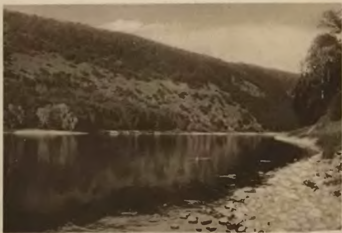
52. Uściczko. Jar Dniestru.

Okolica, ze względu na piękność krajobrazu o charakterze górskim zwana jest »Szwajcarią Naddniestrzańską«. Pod Beremianami przechodzi Dniestr w granice powiatu zaleszczyckiego, przepływa obok miasteczka