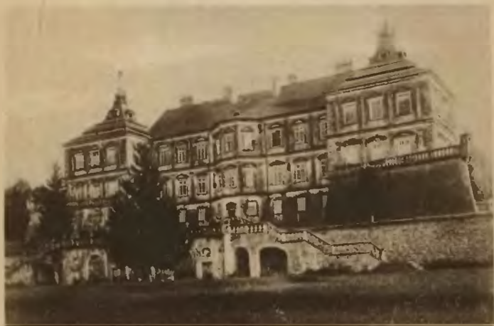
61. Podhorce. Zamek.

27 klm. na północ od Złoczowa gościńcem przez Sassów wieś Podhorce . Do Podhorzec można się również dostać ze stacji kolejowej Ożydów na linii Lwów—Krasne—Brody, skąd przez Olesko 14 klm. gościńcem.