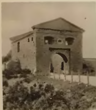
6. Okopy św. Trójcy . Brama warowni

Dźwinogród , (około 12 kłm na zachód od Okopów Św. Trójcy), był niegdyś potężnym grodem ruskim, zamkiem książąt Ostrogskich, który przetrwał do XVI wieku, potem zaś rozpadł się w ruinę. Z początkiem XVIII