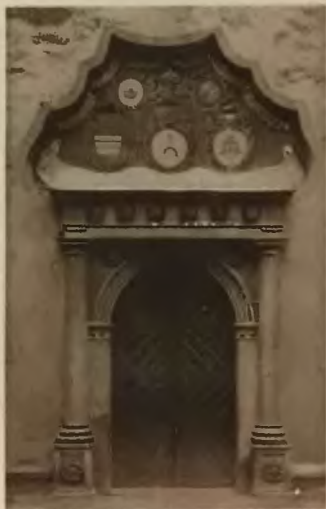
11. Brzeżany. Portal kościoła parafialnego.

Na wzgórzu przy ulicy Rajskiej rz. kat. kościół parafialny zbudowany z końcem XV w. z kamienia ciosowego, w stylu gotyckim o szerokich łukach. Wewnątrz z portrety Sieniawskich, pię-