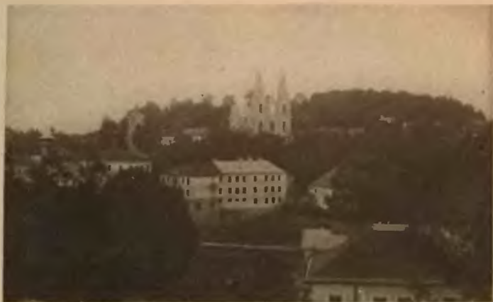
16. Buczacz. Cerkiew Bazyljanów.