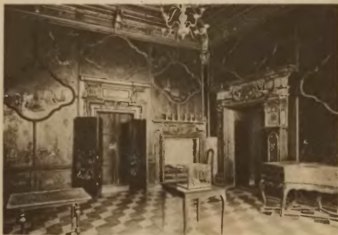
63. Podhorce. Sala chińska w zamku (przed wojną).

Parter przeznaczony był na prywatne mieszkanie właścicieli, ozdobione cennymi pamiątkami. Pierwsze piętro, do którego wiesz