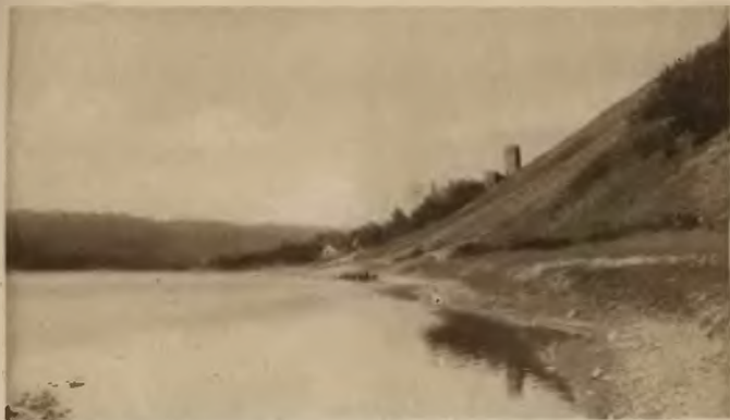
17. Buczacz . Jar Dniestru z ruinami zamku w Rakowcu.