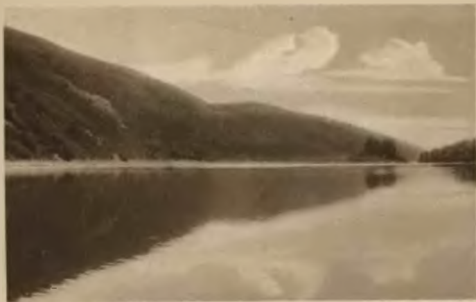
53. Uściczko. Jar Dniestru.