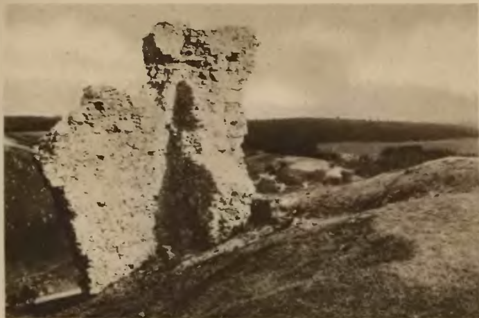
58. Stary Zbaraż. Resztki murów zamkowych.