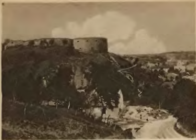
43. Trembowla . Ruiny zamku.