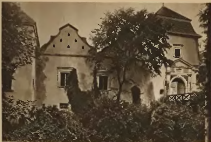
z6. Świrz. Zamek.