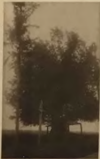
13. Buczacz. Pamiątkowa lipa.

W samym środku miasta w rynku ratusz , zbudowany z końcem wieku XVIII w stylu rokokowym, przedstawiający wysoką wartość architektoniczną, jest to czworoboczna, terasowata budowla z zaokrąglonemi narożnikami. Na każdym czworoboku ku górze znajdowały się figury przedstawiające 12 prac Herkulesa, z których tylko 4 na I. piętrze ocalały — górne zaś zostały zniszczone w czasie