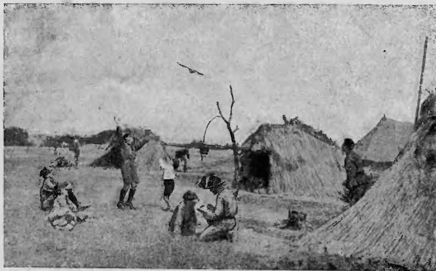
Wśród szeregu namiotów na Słękierkach pod Warszawą, w czasie tegorocznego I-go Zlotu Narodowego Harcerstwa, zwróciła na siebie szczególną uwagę drużyna z Ursynowa, „przyjaciółka zwierząt” z oswojoną wroną.