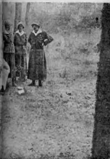
chowaniem dzielnej Polki, umie- sobie w pokonywaniu i ujarz- wrody.