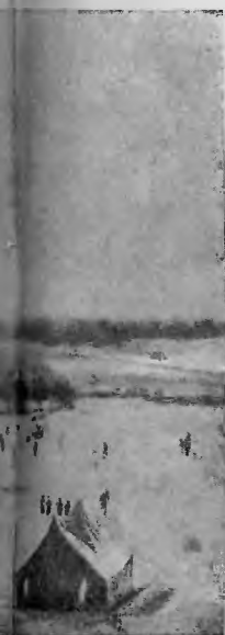
aby młodzież miała dużo miejsca, po- wietrza świe- żego i ożyw- czej wody.