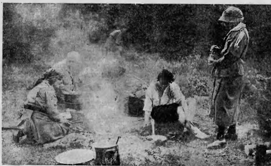
Codziennie gromadka harcerek „kuchmistrzyń” przyrządzała strawę dla całej drużyny. Przy kotłach, wśród trzaskającego ognia wesoło płynęły im godziny przy pracy.