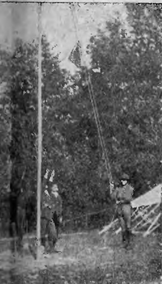
każdy dzień rozpoczyna obóz na wysokim maszcie wznosi a drużyna pozdrawia.