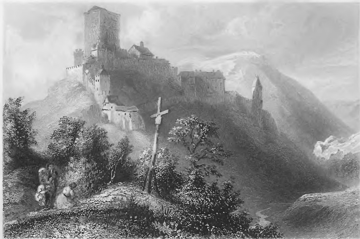
L. Richter del.