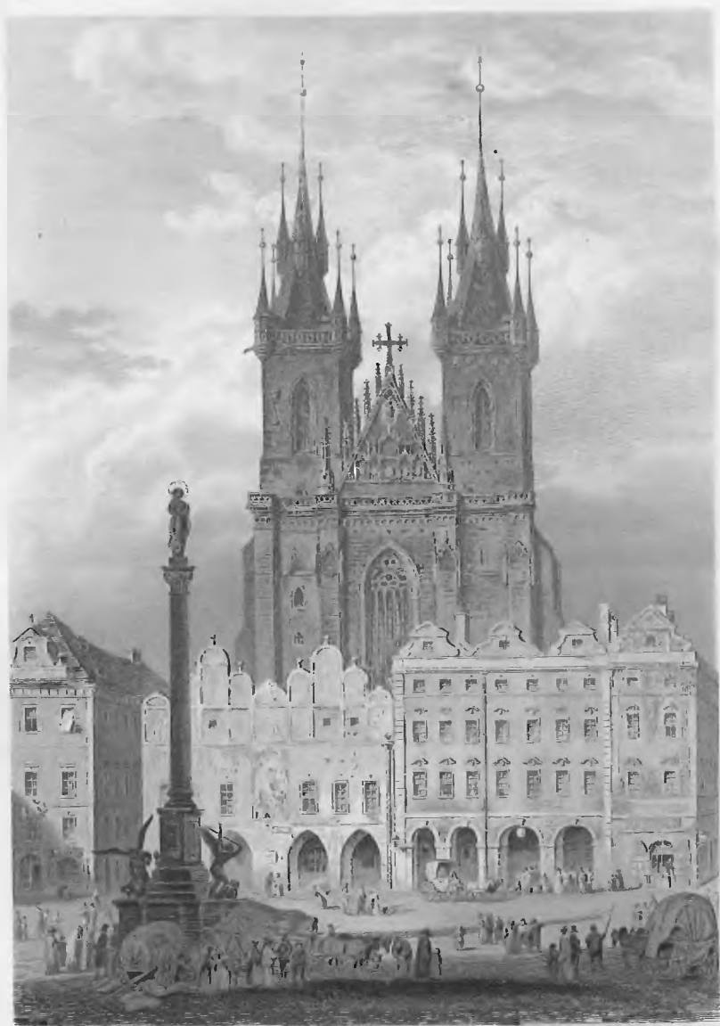
ST. VITUS CATHEDRAL IN PRAGUE.