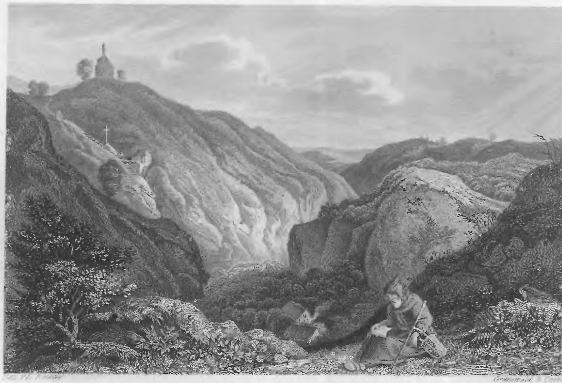
ST. PROCOPIUS BEL PRAG.