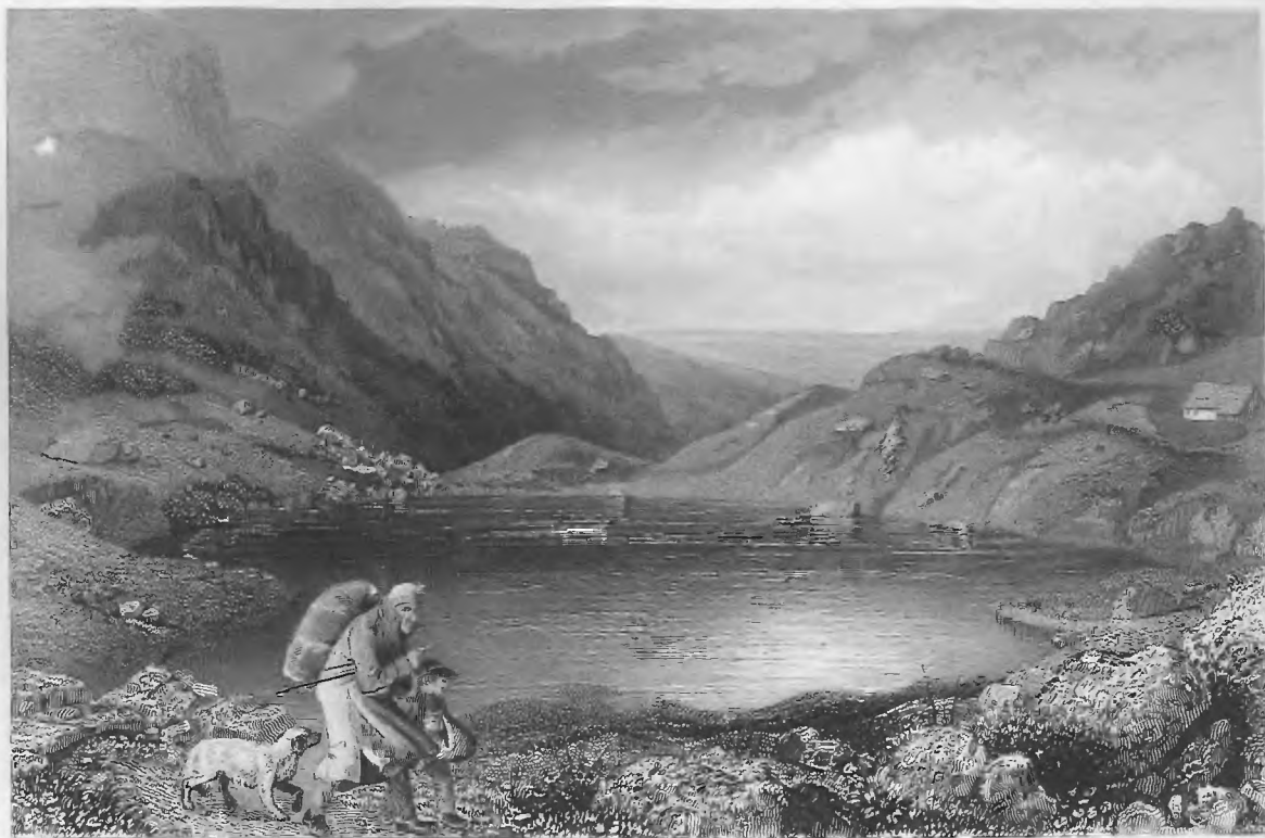
L. Richter del.