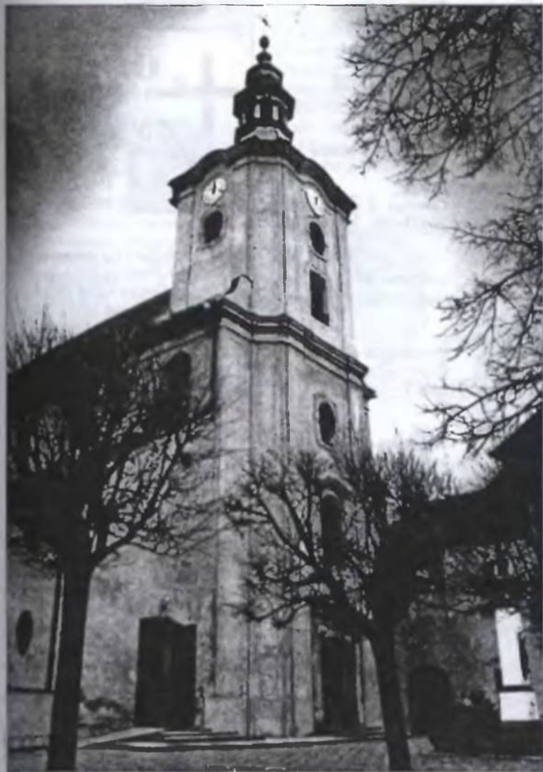
Kościół w Jemielnicy w jesiennej scenarii.

LISTOPAD 1998 • ROK I • MIESIĘCZNIK • ISSN 1505-5140 • CENA 1 ZŁ