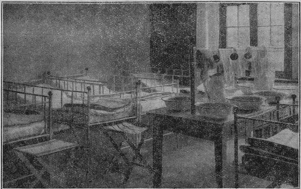
Kinderheilherberge Bethesda — Schlaf- und Waschraum

Verantwortlich für den Gesamteinhalt Walter Block Pszczyna. Druck und Verlag: „Anzeiger für den Kreis Pless, Sp. z ogr. odp.“, Pszczyna, ul. Piastowska 1