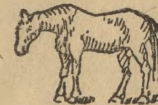
Niemcom pozostaje 150 ogierów zimnokrwistych. Es verbleiben Deutschland 150 kaltblütige Hängste.