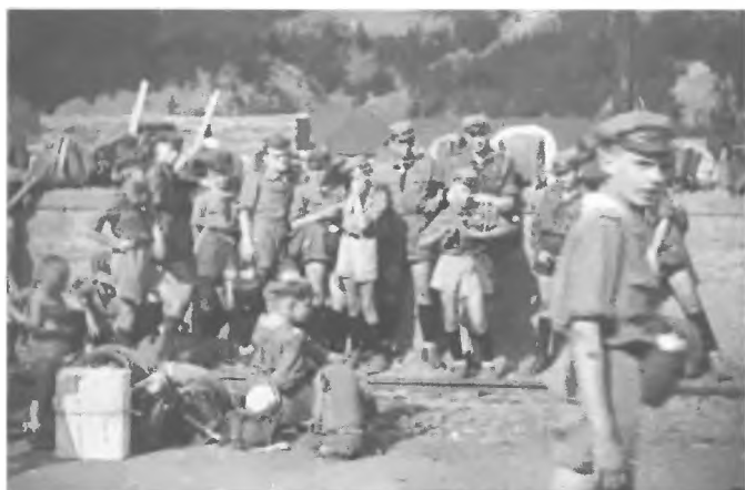
105 ZDH - 1 maj 1957 prowadzi dh Górnicki Mirosław