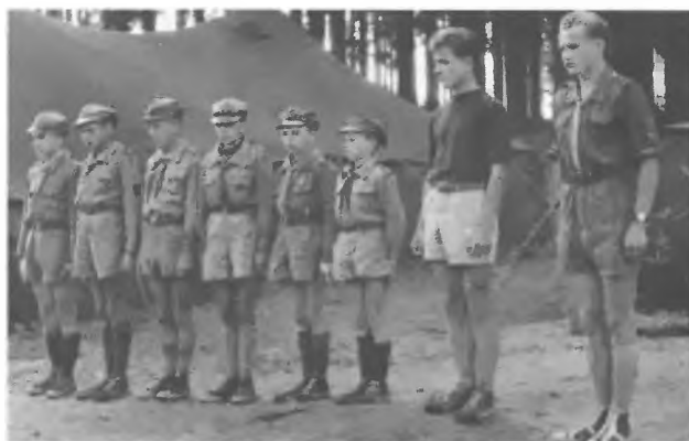
Zastęp „Żubrów” Piekło 1958 r.