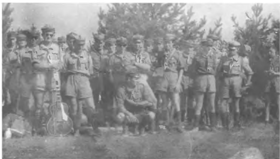
Grunwald (1960 r.)