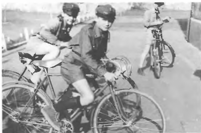
105 ZDH - Rajd Rowerowy (1957 r.)