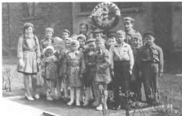
Szóstka „Marynarzy”, szóstka „Kwiatuszków” - powrót z festiwalu piosenki zuchowej w Będzinie (1962 r.)