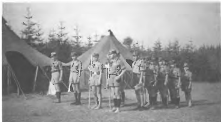
105 ZDH - Obóz harcerski (1958 r.)