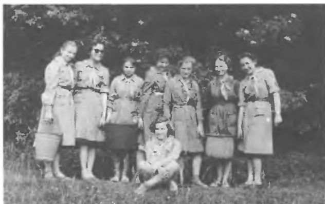
2 ŻDH powrót z biwaku