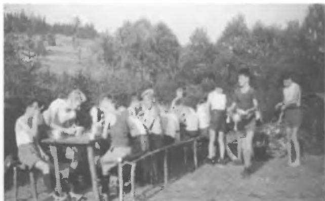
105 ZDH - Obozowy obiad (1958 r.)