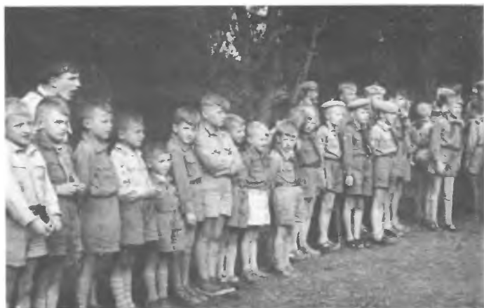
Istebna - kolonie 1961 r.