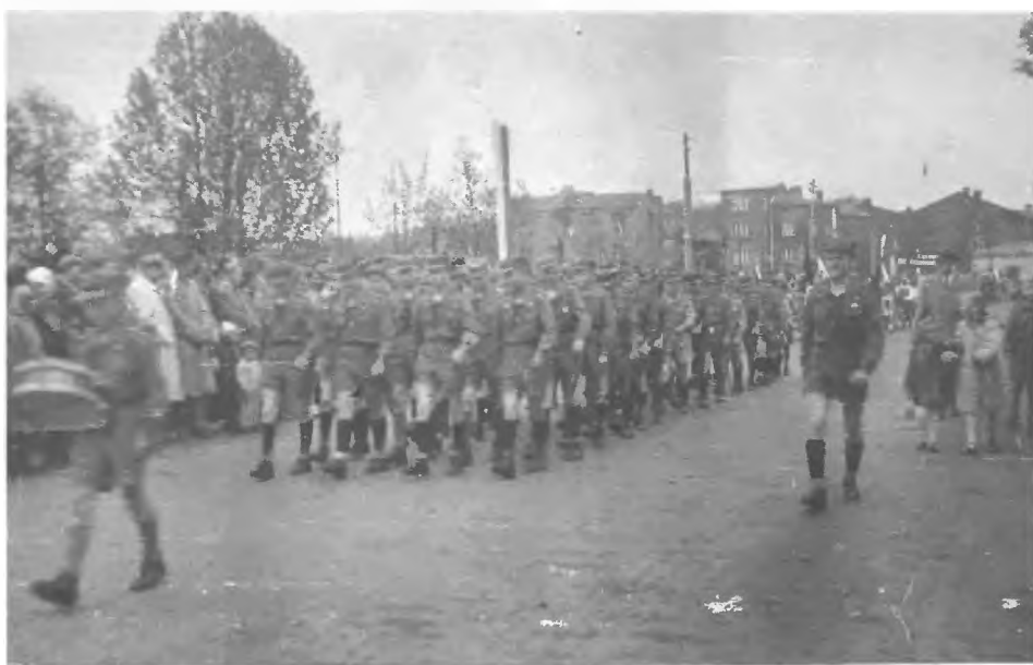
105 ZDH - Drużyna przed defiladą 1 maj 1957 prowadzi Peteja Marian