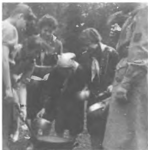
2 ŻDH im E. Plater - obiad na biwaku