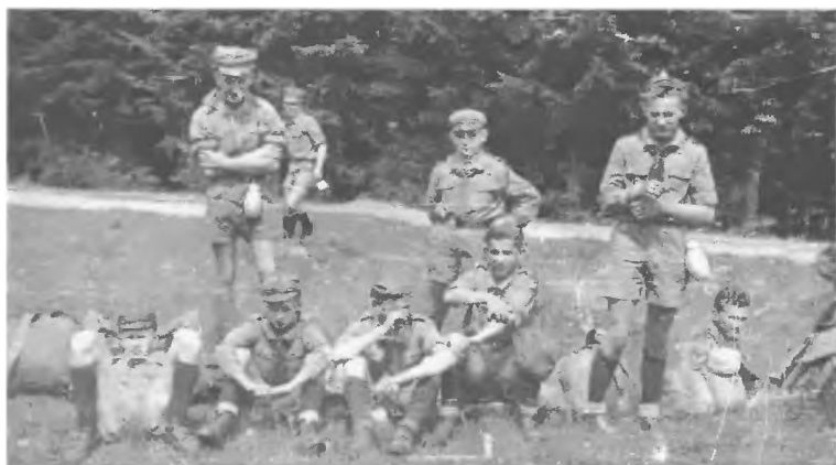
105 ZDH - Powrót z obozu (1958 r.)