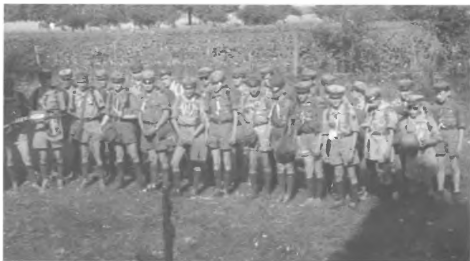
Grunwald (1960 r.)