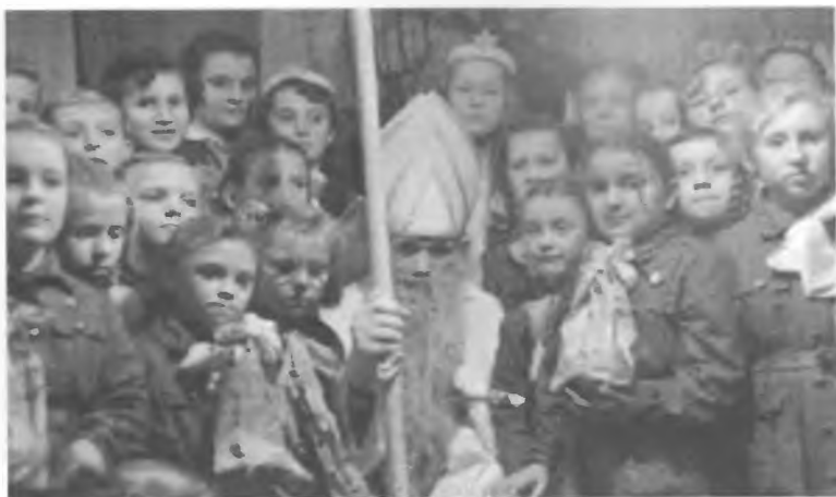
Zabawa choinkowa (1962 r.)