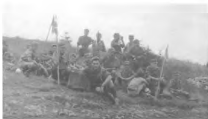
105 ZDH i 80 ZDH - wycieczka w góry (1958 r.)