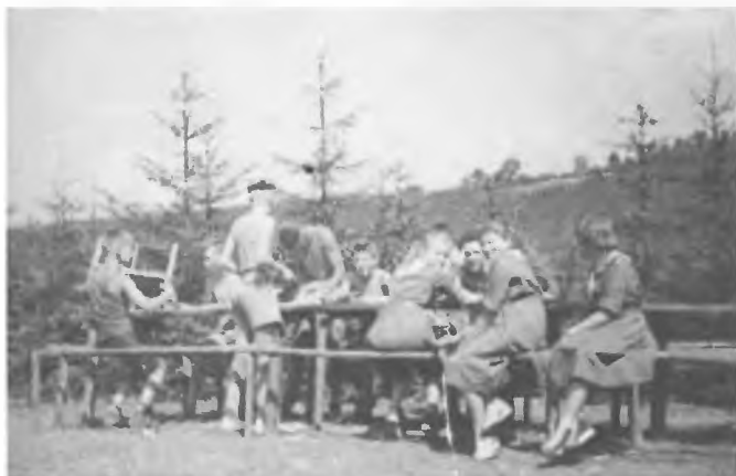
105 ZDH oraz druchny z 2 ŻDH w odwiedzinach