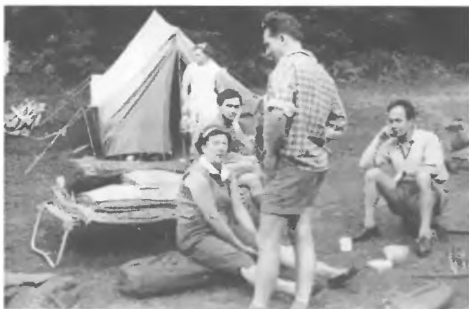
Rzyki 1962 - kadra obozu