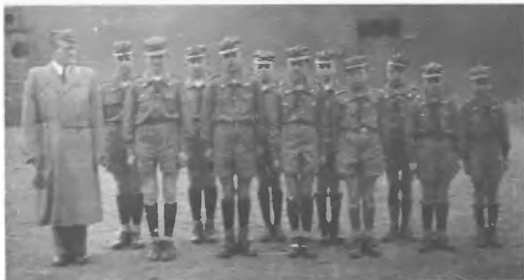
105 ZDH - Zastęp „Węży” po powrocie z pochodu (1957 r.)