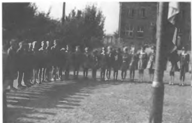
Bukowno - kolonie 1963 r.