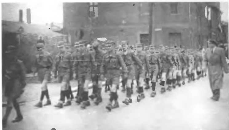
105 ZDH - 1 maj 1957 prowadzi dh Górnicki Mirosław