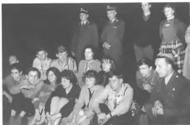
Ognisko Góra św. Anny - spotkanie z byłymi powstańcami śląskimi