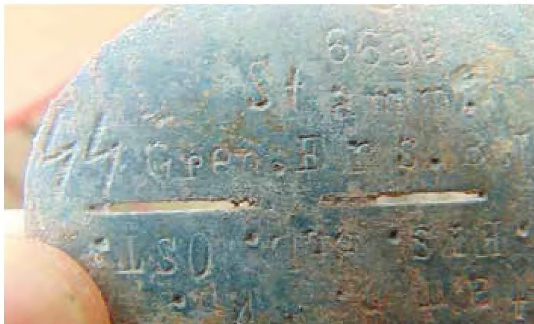
Kompania Kadrowa Zapasowego Batalionu Grenadierów SS „Ost” z Wrocławia. Stanowiła uzupełnienie dla 18 dywizji Waffen SS.

Prawie każda organizacja Trzeciej Rzeszy posiadała nieśmiertelniki.