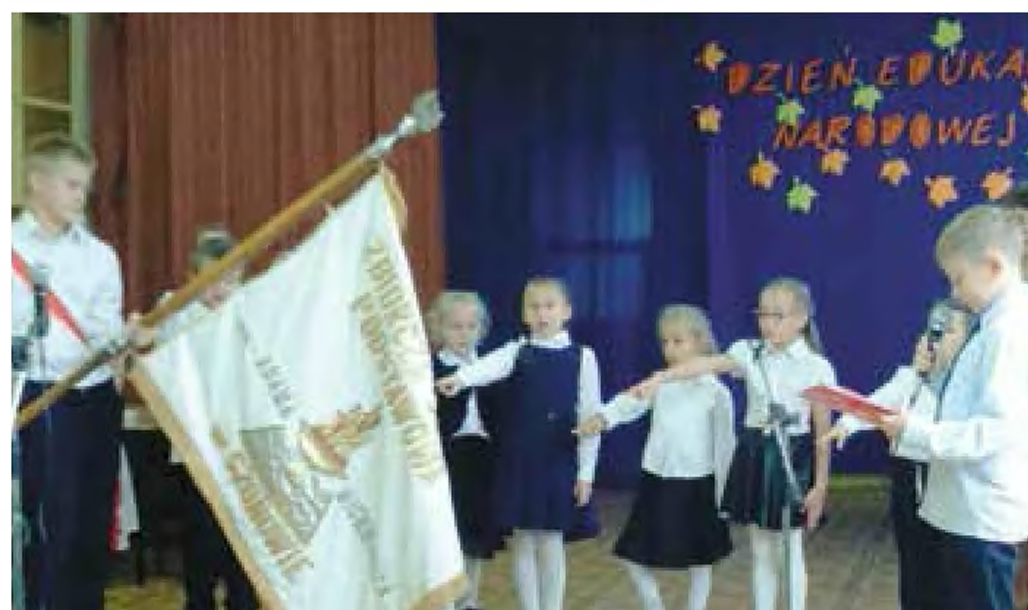
Pasowanie na ucznia w SP Szonów