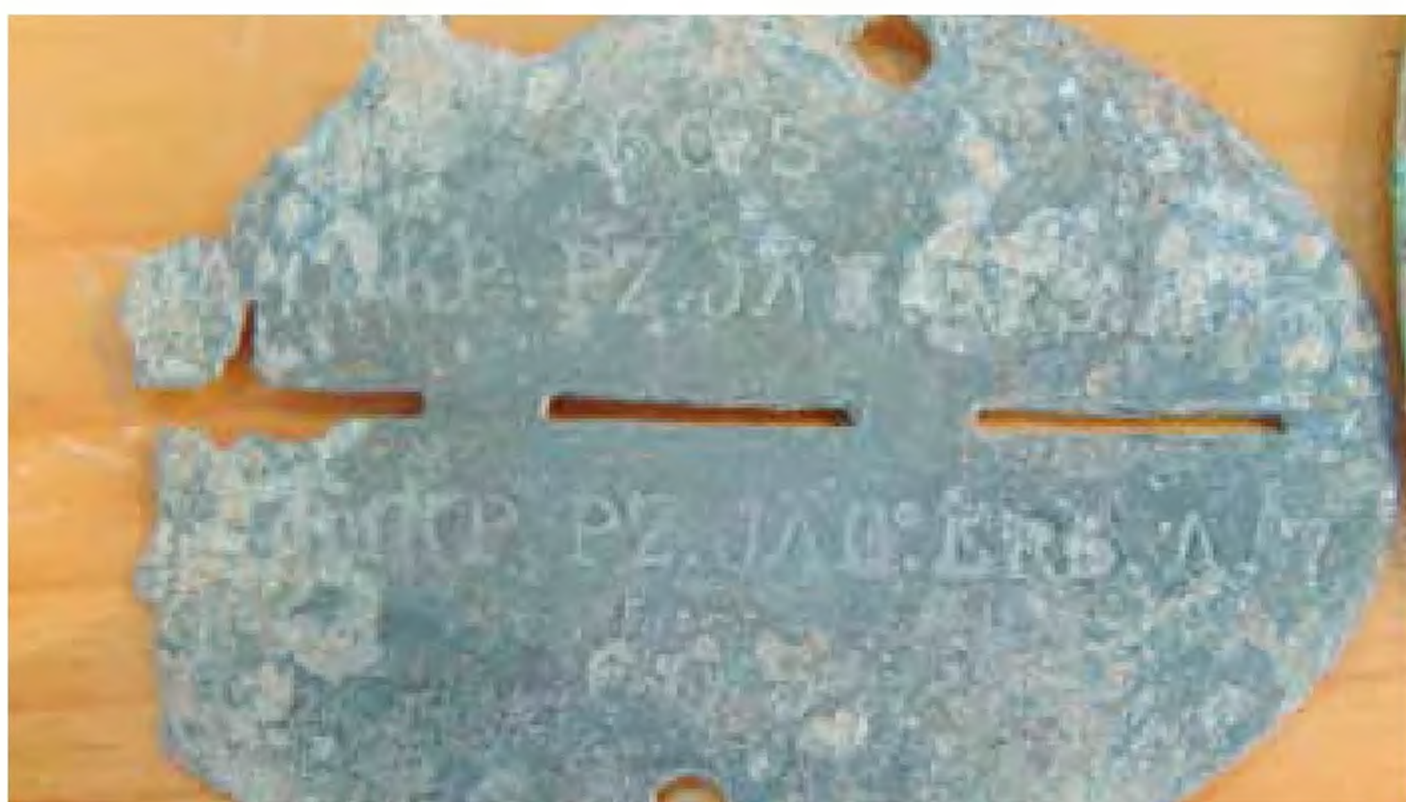
Kompania Kadrowa 7 Zapasowego Oddziału Niszczycieli Czołgów.