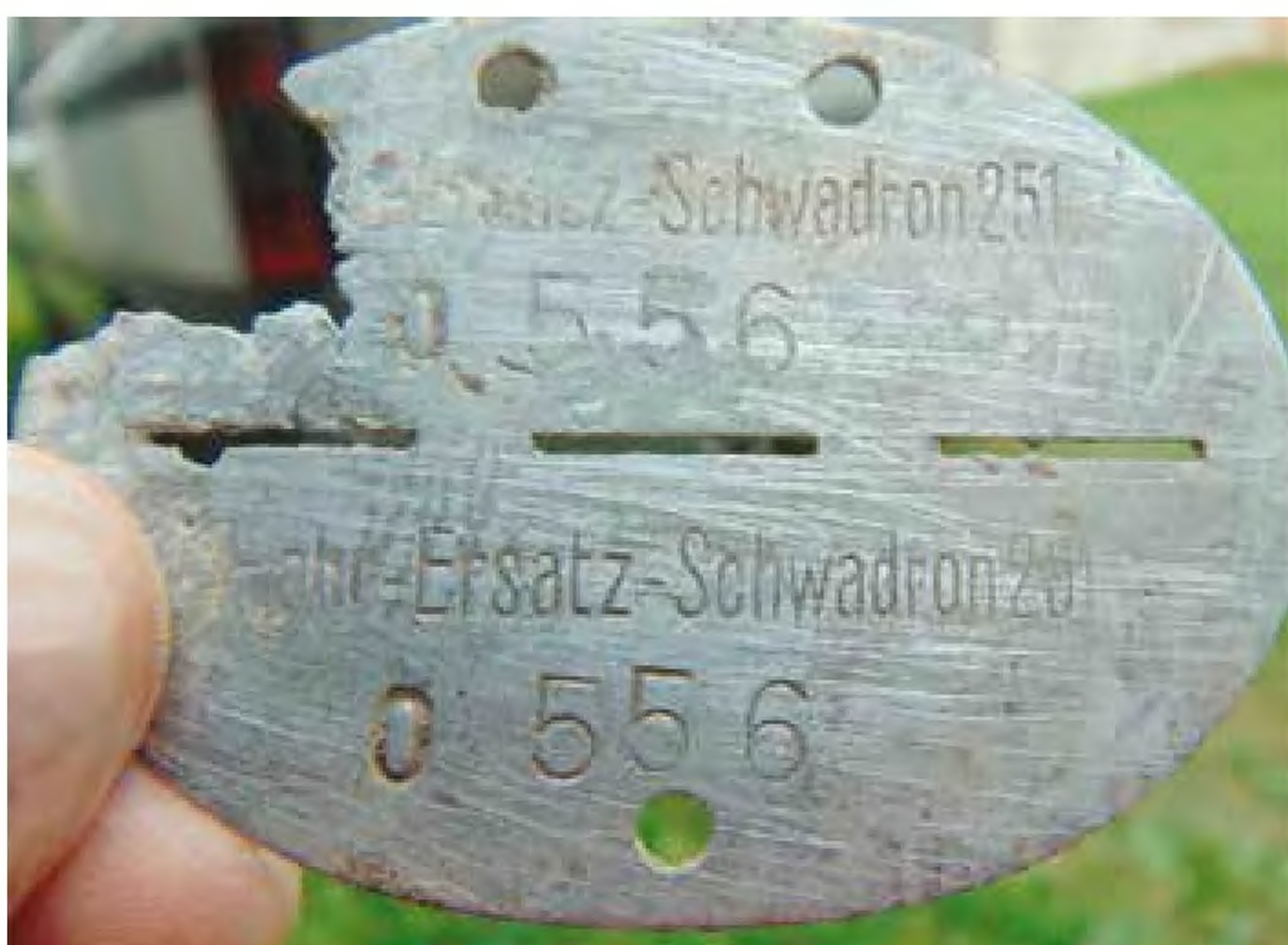
251 Zapasowy Szwadron Kierowców.

Oprócz wojska posiadali je - policjanci, RAD (służba pracy Rzeszy), Czerwony Krzyż, organizacja TODT, transport oraz niektórzy urzędnicy. Żołnierze - jeńcy wojenni przebywający w stalagach i oflagach podczas wojny mieli nieśmiertelniki w kształcie prostokąta. Różnorodność i treść skrótów jednostek umieszczanych na nieśmiertelnikach jest tak ogromna, że nawet specjaliści zajmujący się tą dziedziną nie są w stanie do dziś wyjaśnić pochodzenia niektórych blach. Podczas ekshumacji w okolicach Głogówka w 2015 r. na cmentarzu we Wierzchu znaleziono 18-ście całych metalowych identyfikatorów. Z ciekawszych nieśmiertelników to: [15/ssA.A.u.E.R-jednostka szkolna artylerii SS z okolic Pragi], [FL.H.Kdtr.Plbg.A./Lehr -nieśmiertelnik instruktora Luftwaffe] [San.Ers.Abtlg.12 -sanitariusz]. W Nowym Browńcu 2015 r. znaleziono 6 nieśmiertelników jeden z nich należał do ochotnika ze wschodu [St. Battl.A.R.254-Fr.w]. Podczas ekshumacji w Raclawicach Śląskich znaleziono 5 nieśmiertelników w tym dwa z batalionu karnego oraz jeden z [Jnf.Gesch.Ers.kp.258]- 258 kompanii zapasowej dział piechoty.