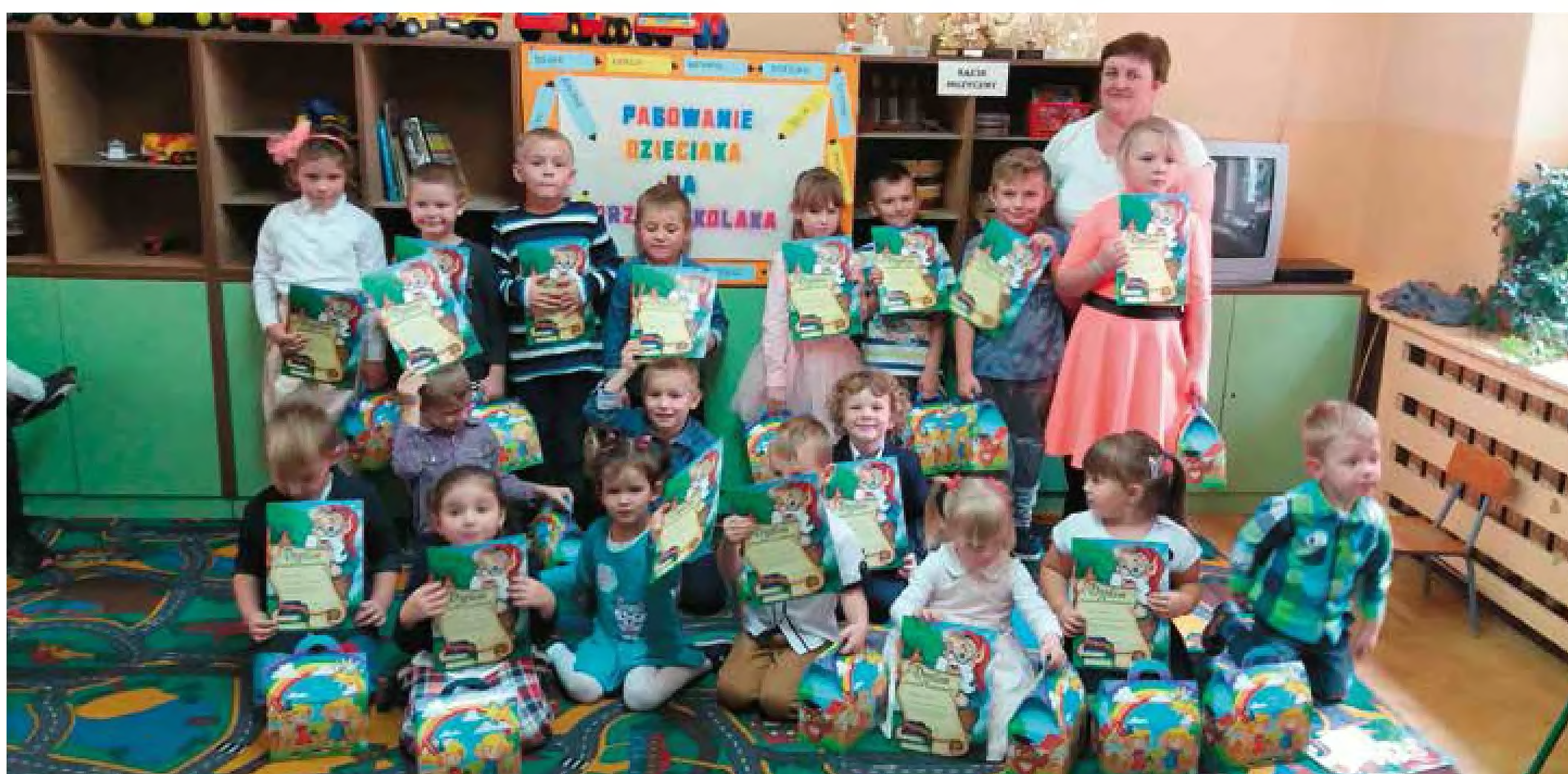
Przedszkolaki z Wróblina