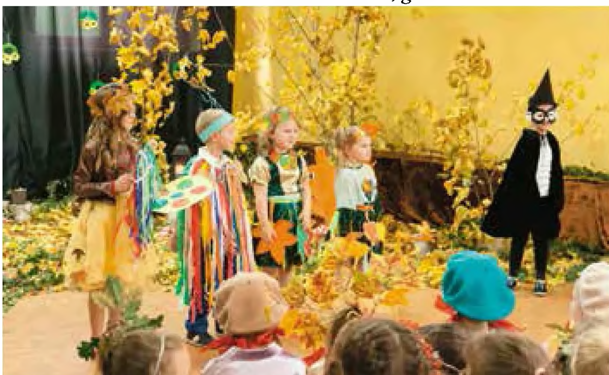
Przedшкоlaki z Biedrzychowiec