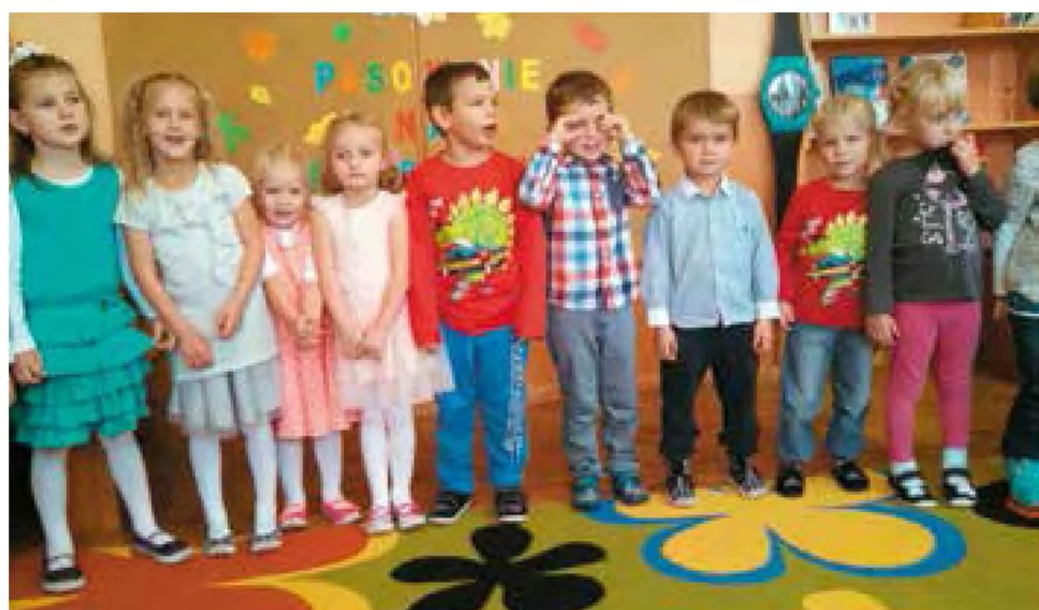
Przedszkolaki z Wierzchu