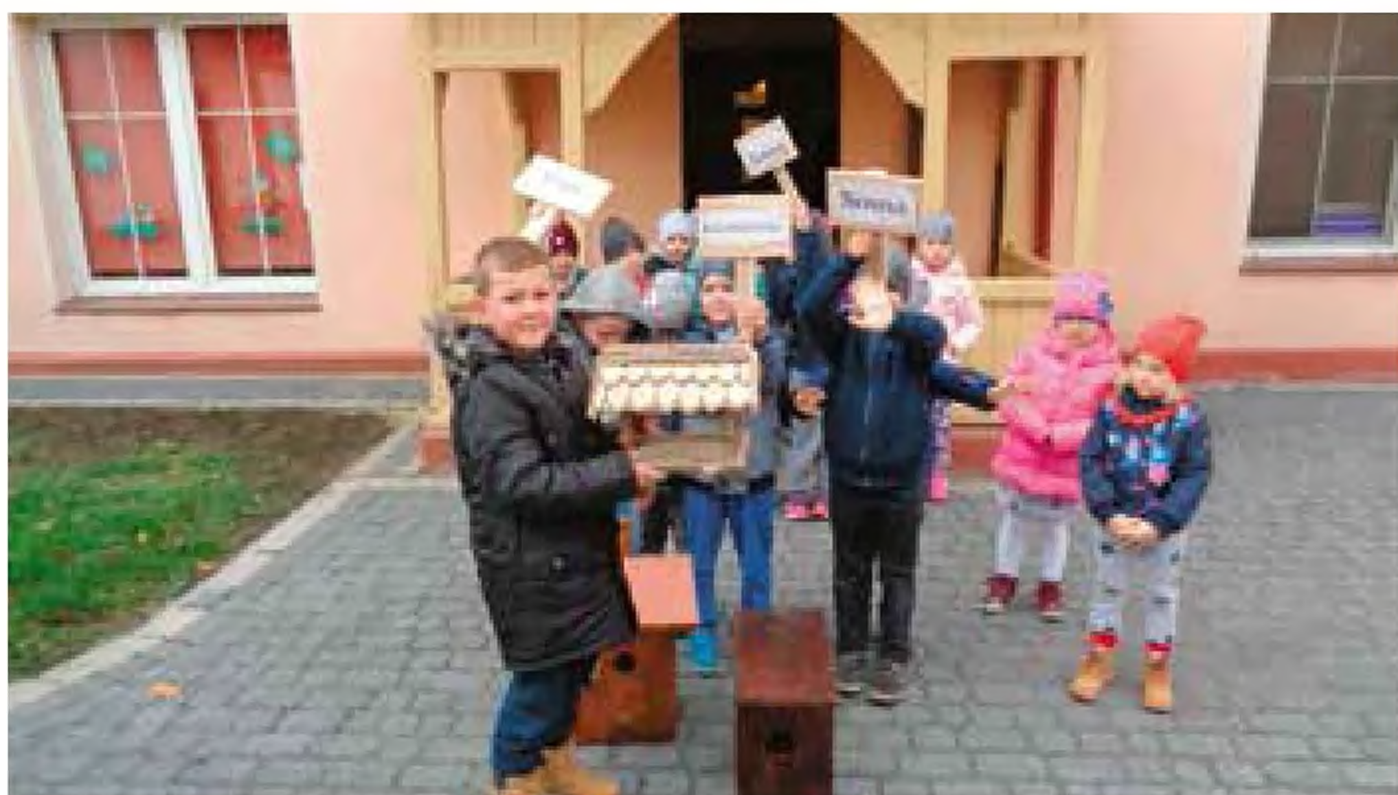
Przedszkolaki z Oraczy