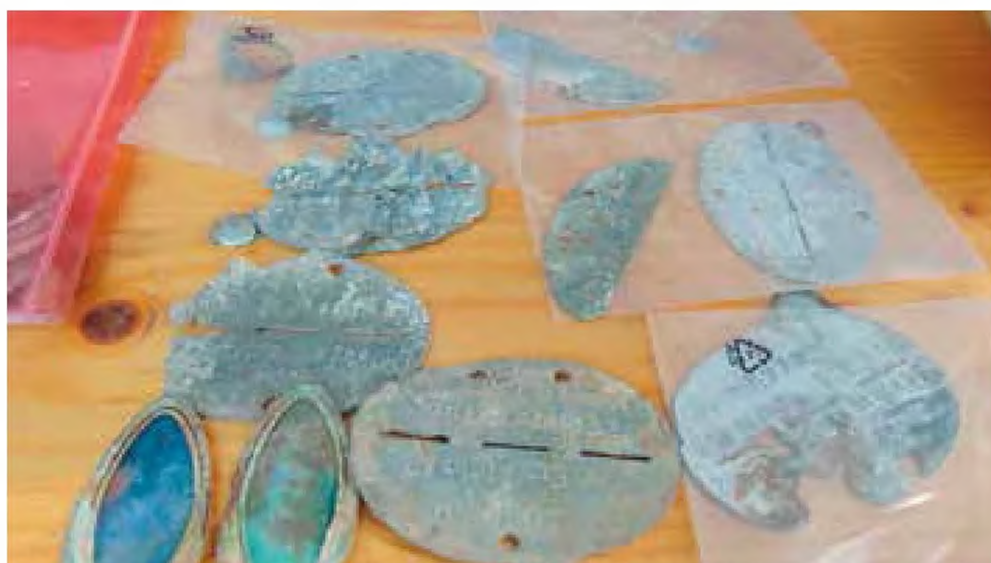
Kompania Kadrowa 102 Zapasowego Batalionu Grenadierów.