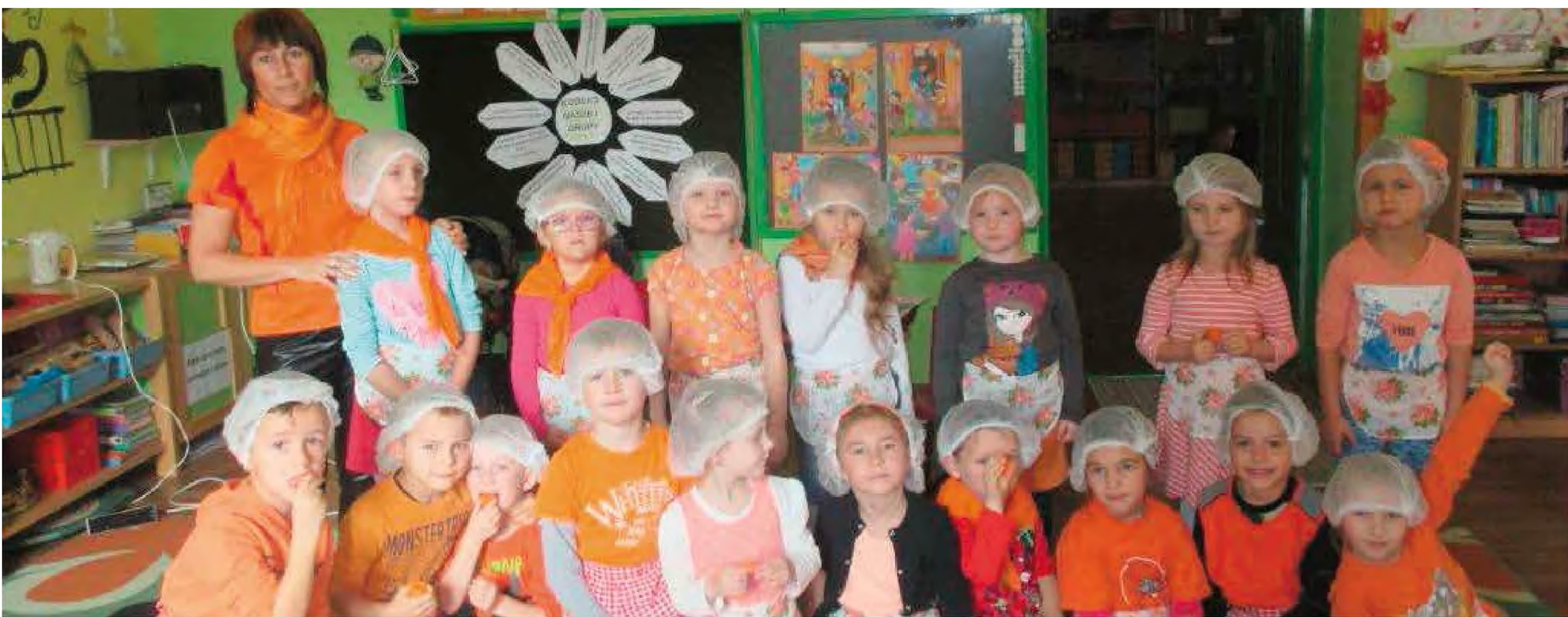
Dzień Pomarańczowy - PP nr 4