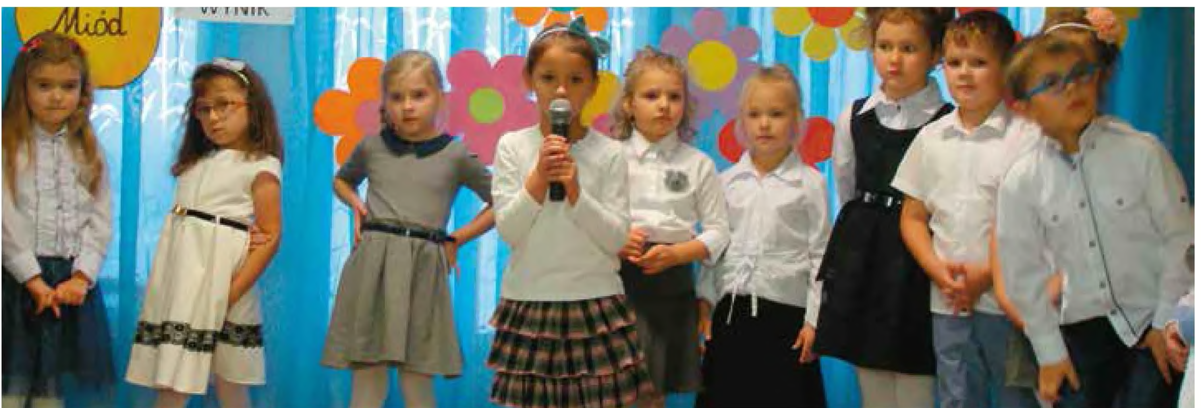
Przedszkolaki z PP nr 3