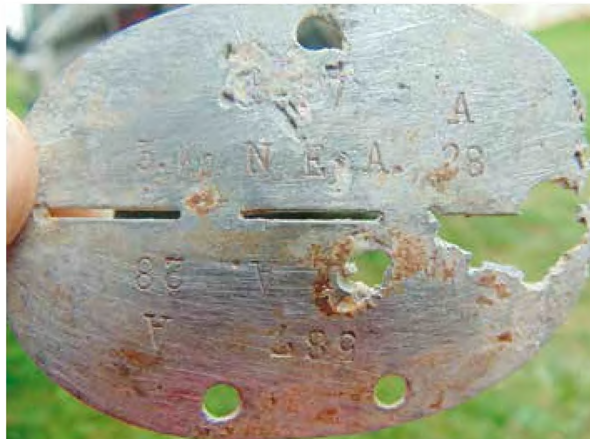
5 kompania 28 Zapasowego Oddziału Łączności.