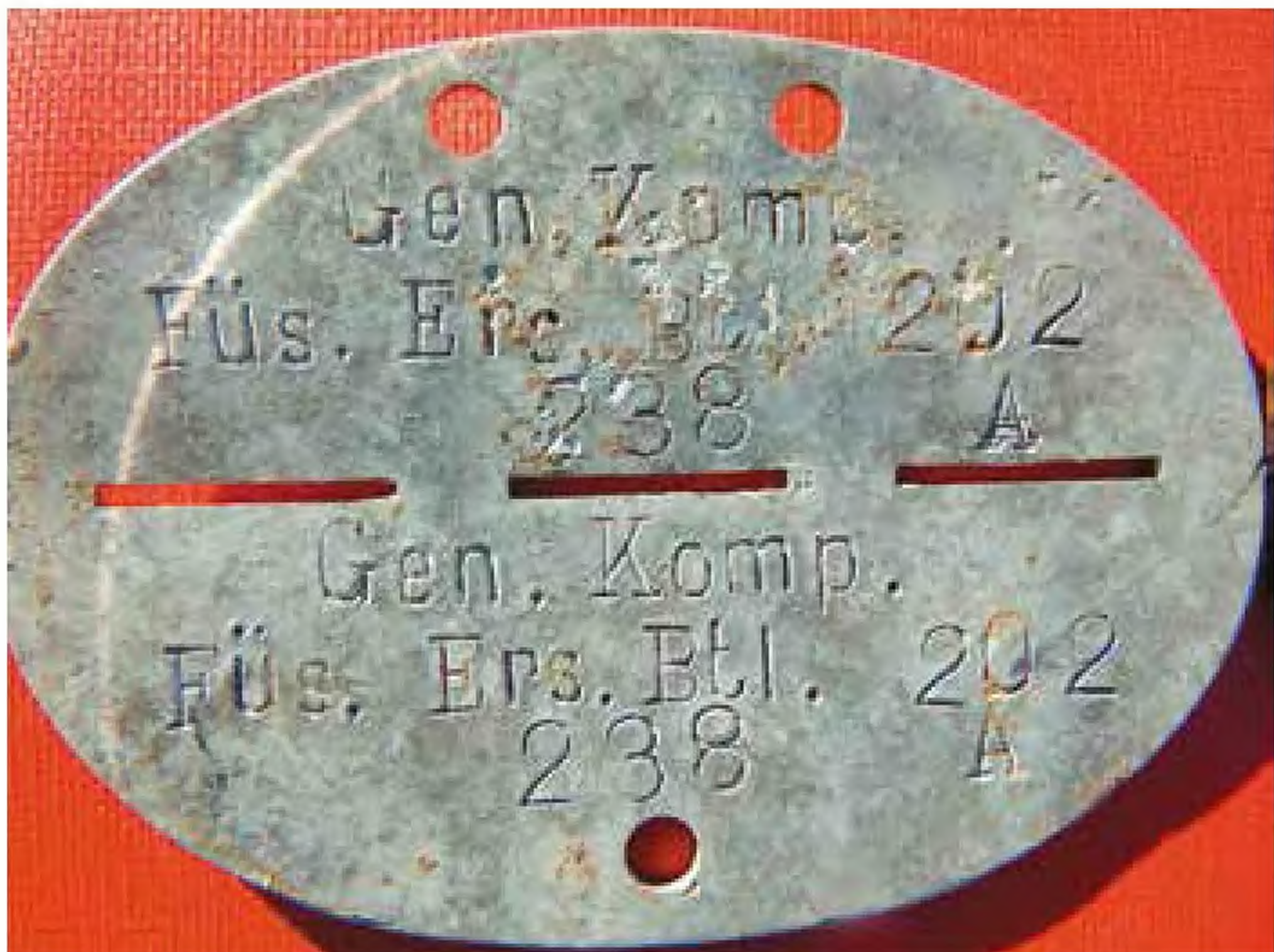
Kompania Ozdrowieńców 202 Zapasowego Batalionu Fizylierów.