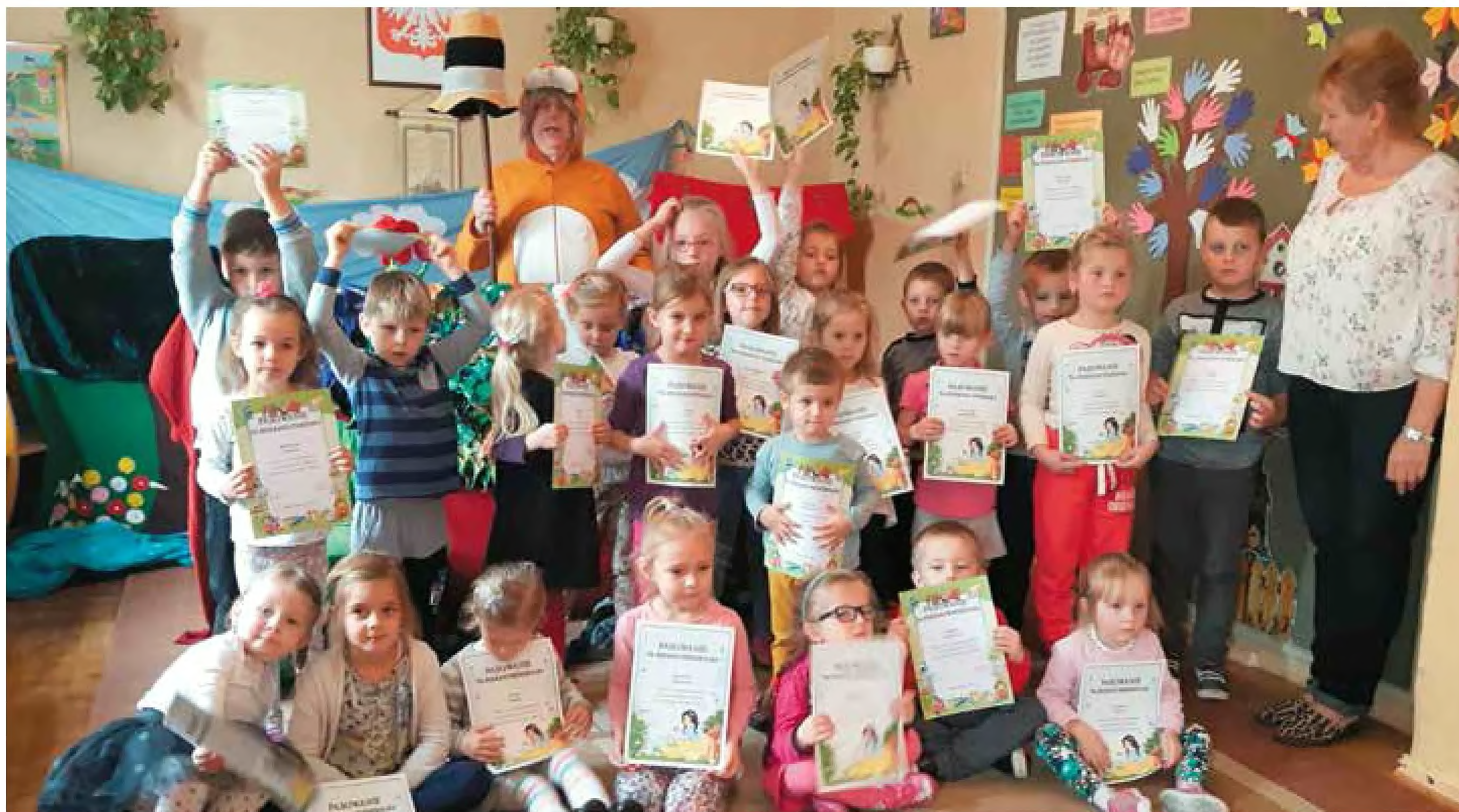
Przedszkolaki z PP w Racławicach Śląskich