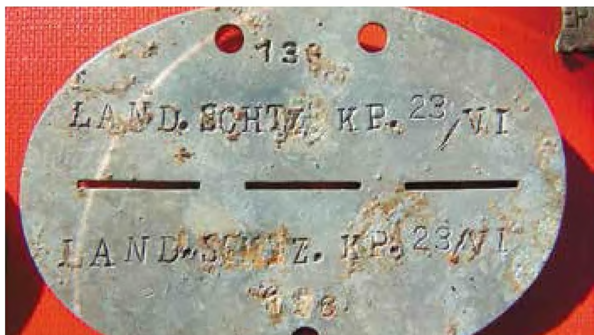
23 kompania strzelców krajowych z VI okregu wojskowego.