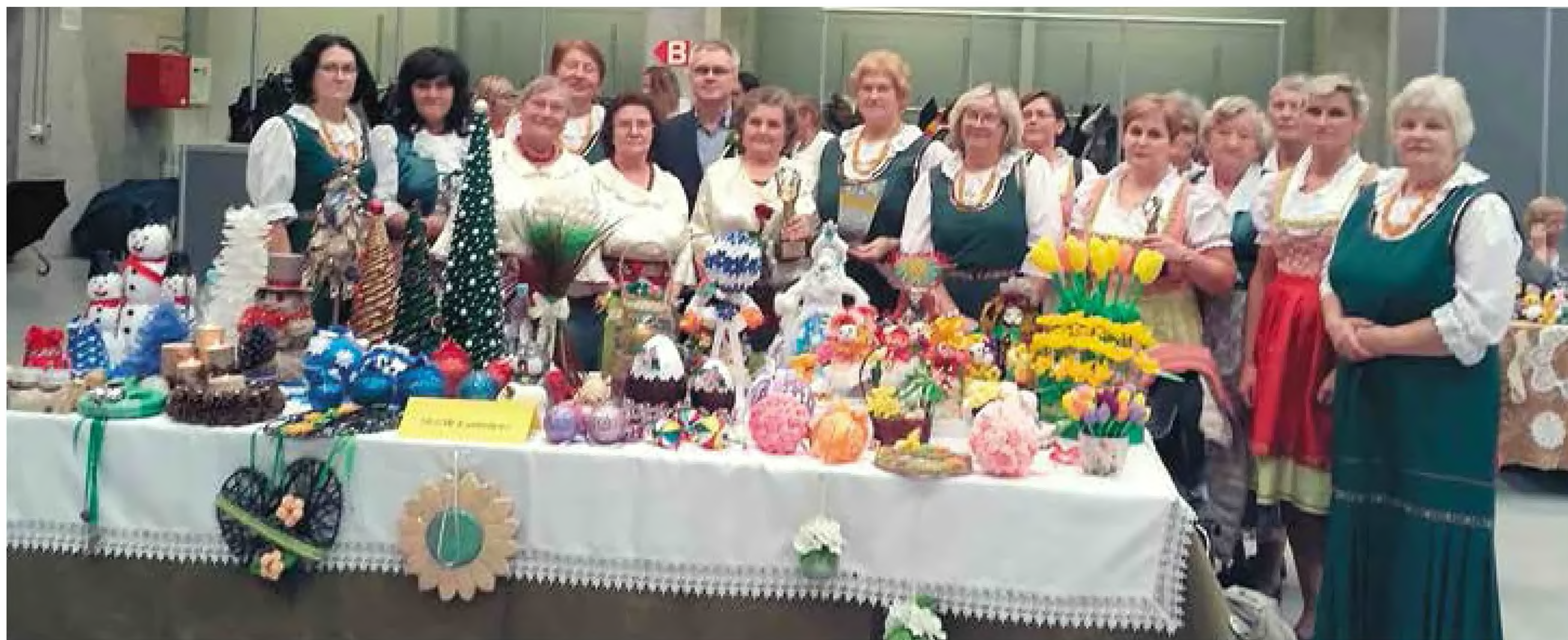
Pamiątkowe zdjęcie podczas obchodów 150-lecia KGW

Od paru lat koło prowadzi działalność gospodarczą, w ramach tej działalności