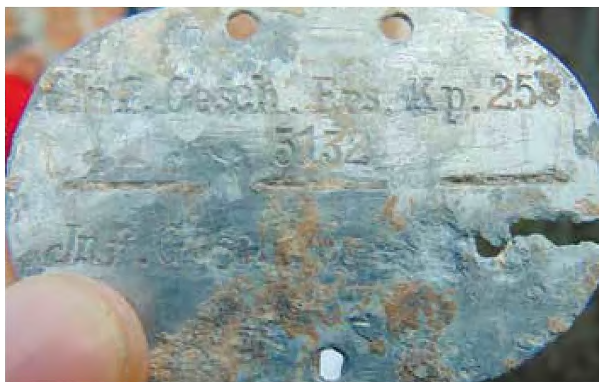
258 Zapasowa Kompania Dział Piechoty.

Jako ciekawostkę mogę podać, że sławetny Dr Mengele pierwsze kroki stawiał właśnie w tej kompanii.