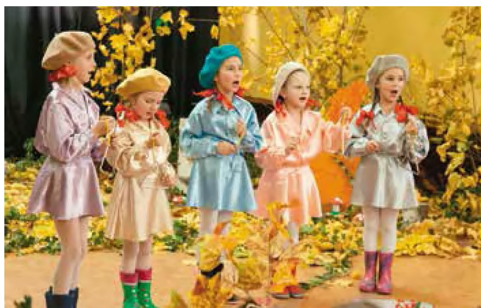
Przedшкоlaki z PP nr 4, gr 2