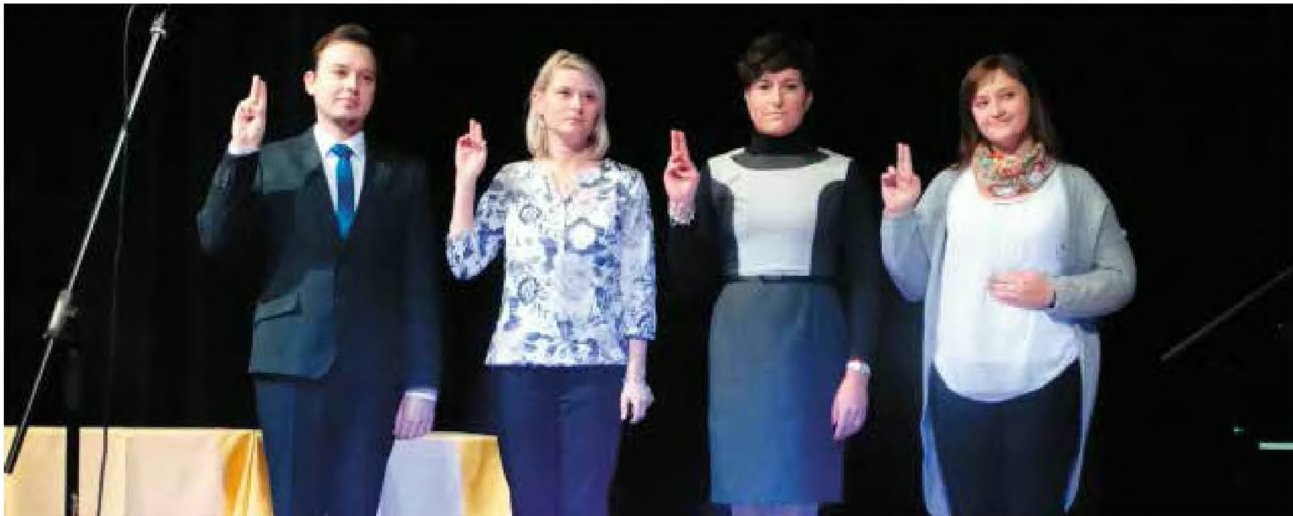
Nowi nauczyciele mianowani - czytaj str. 10