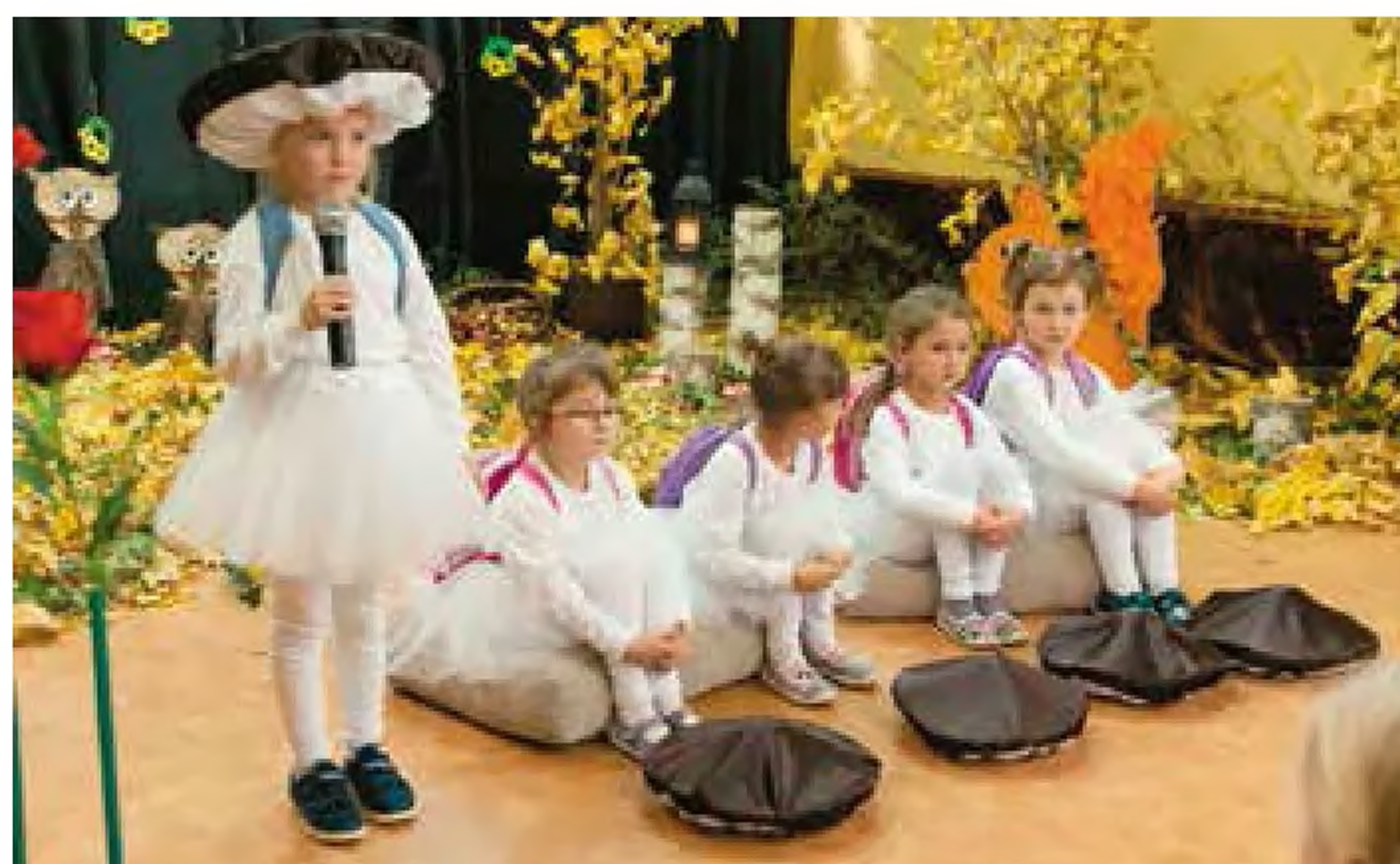
Przedшкоlaki z PP nr 3