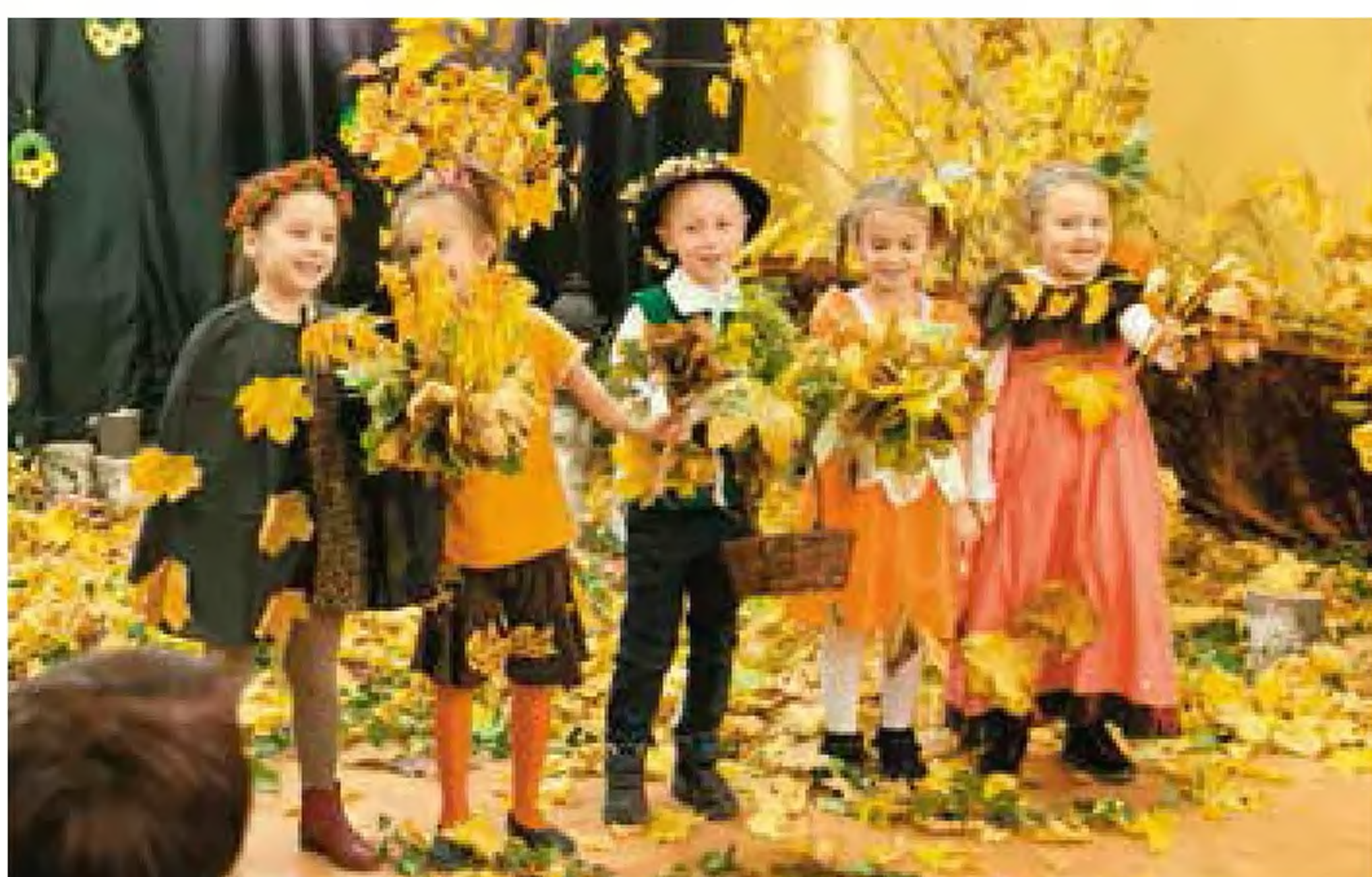
Przedшкоlaki z OP przy SP1