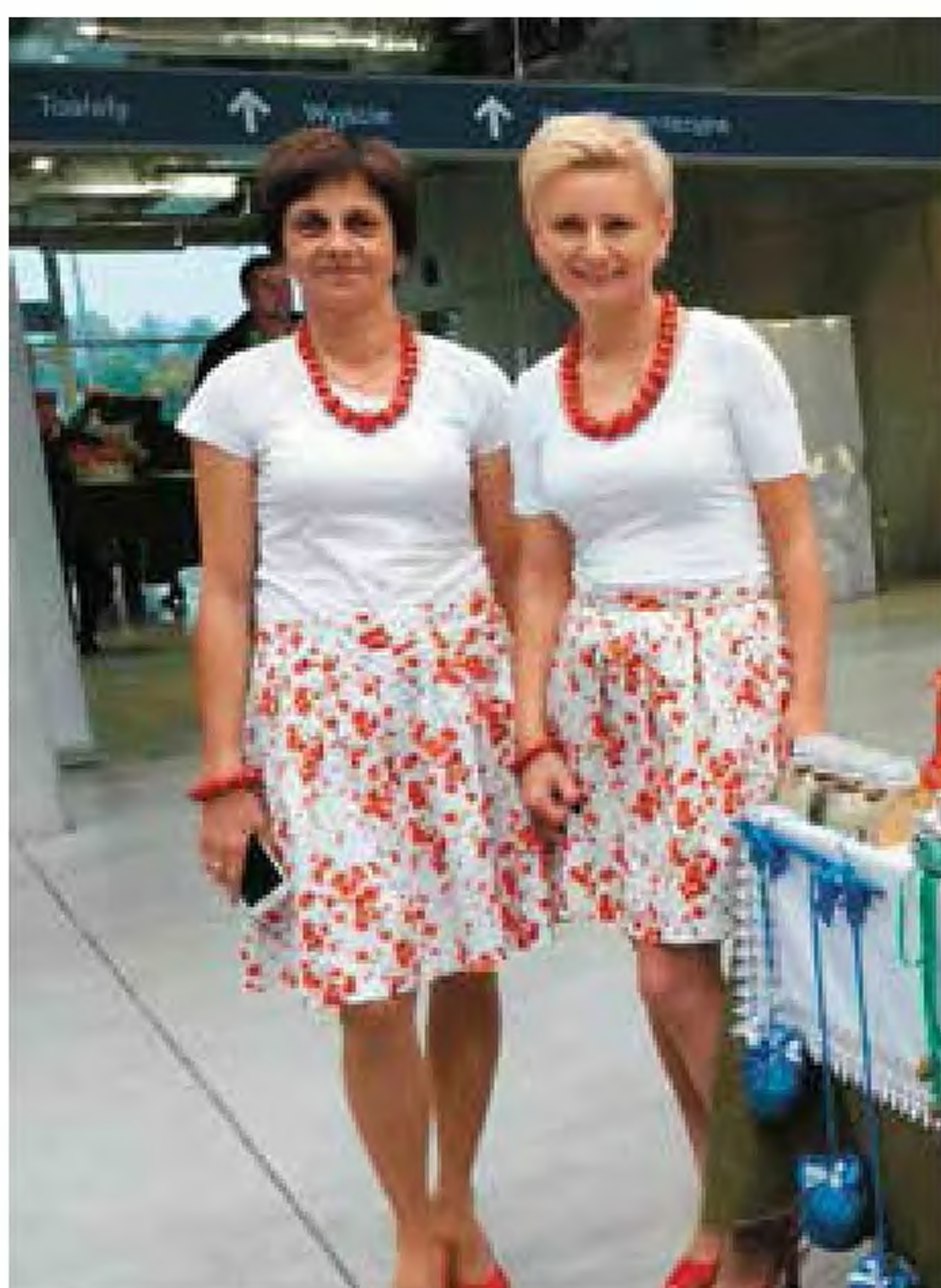
KGW Kazimierz - przedstawicielki