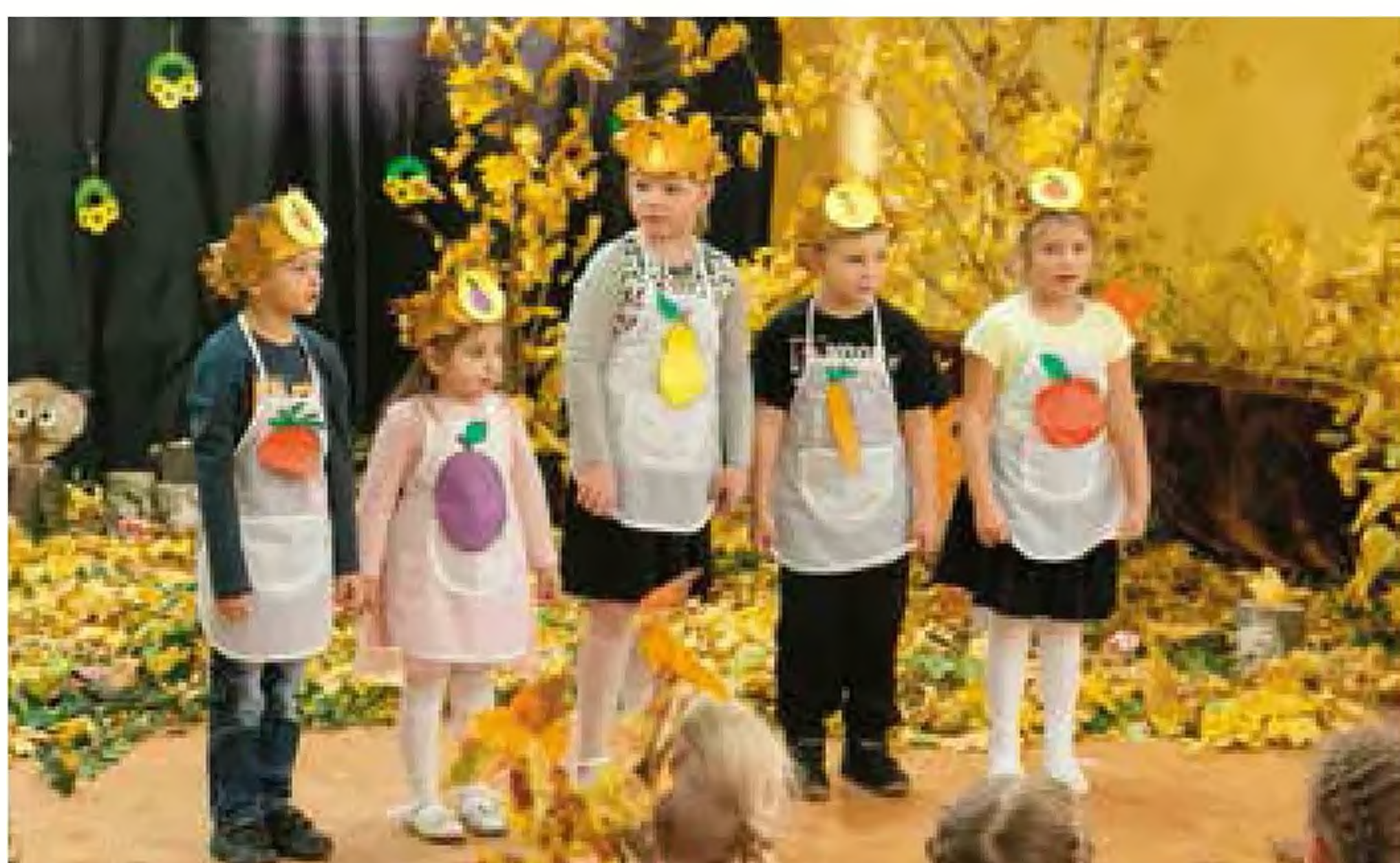
Przedшкоlaki z Wróblina