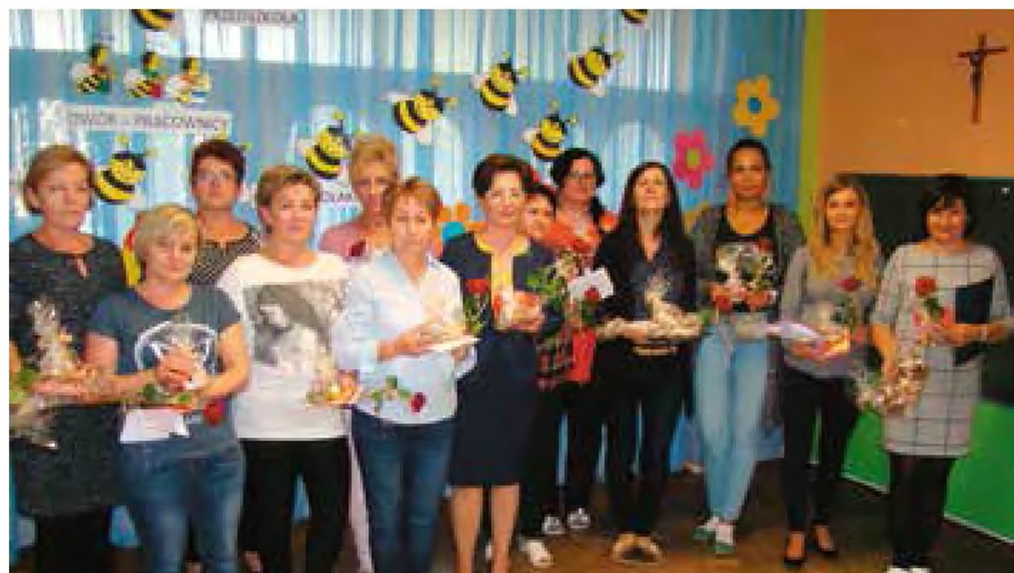
DEN w PP nr 3