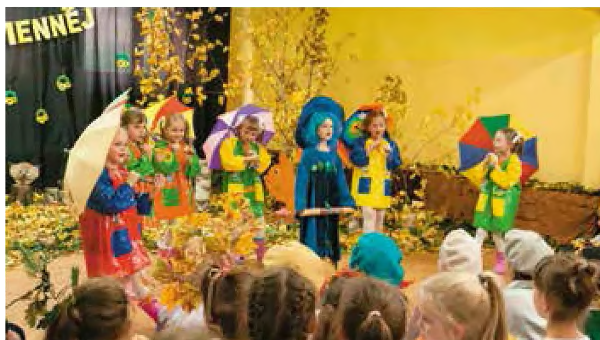
Przedшкоlaki z PP nr 4, gr 1