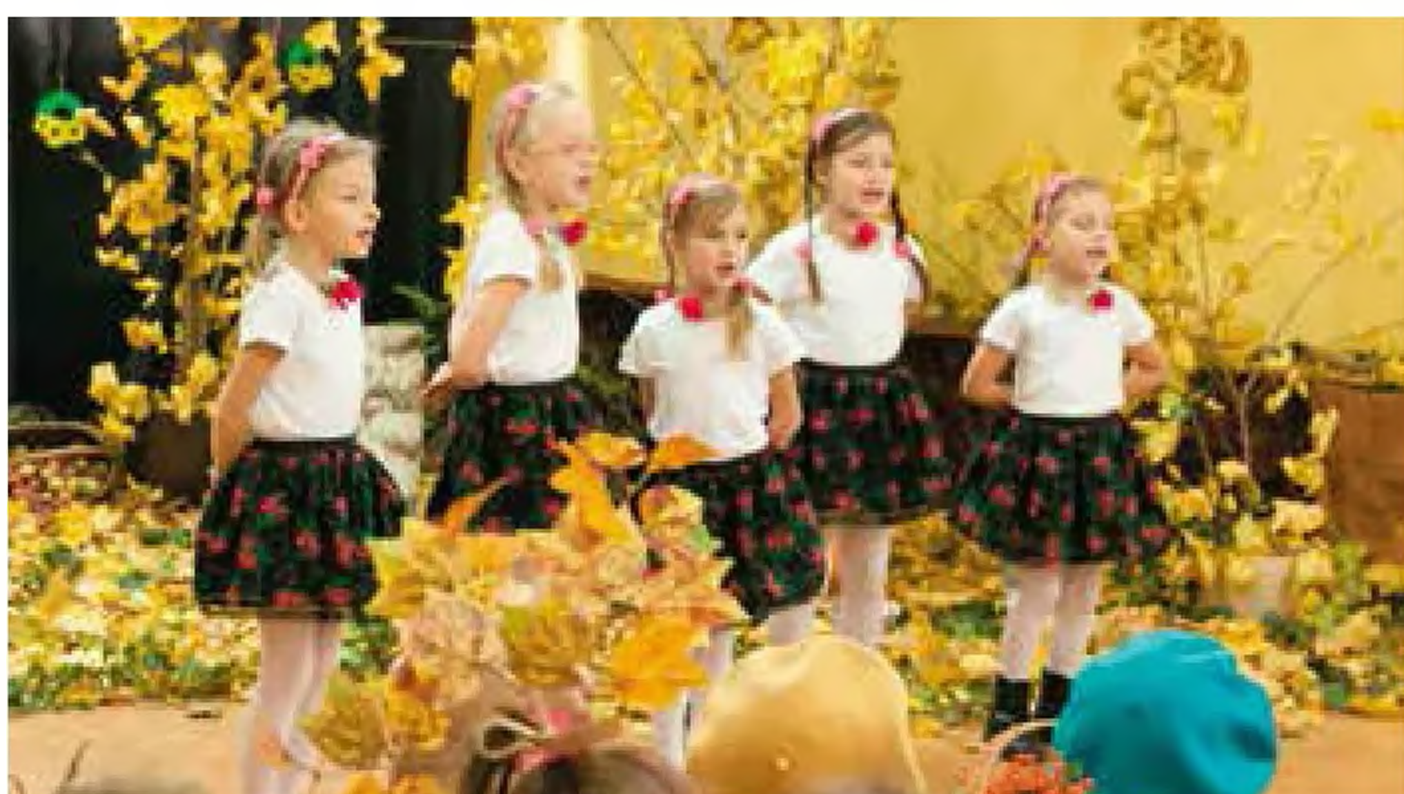
Przedшкоlaki z Racławic Śląskich