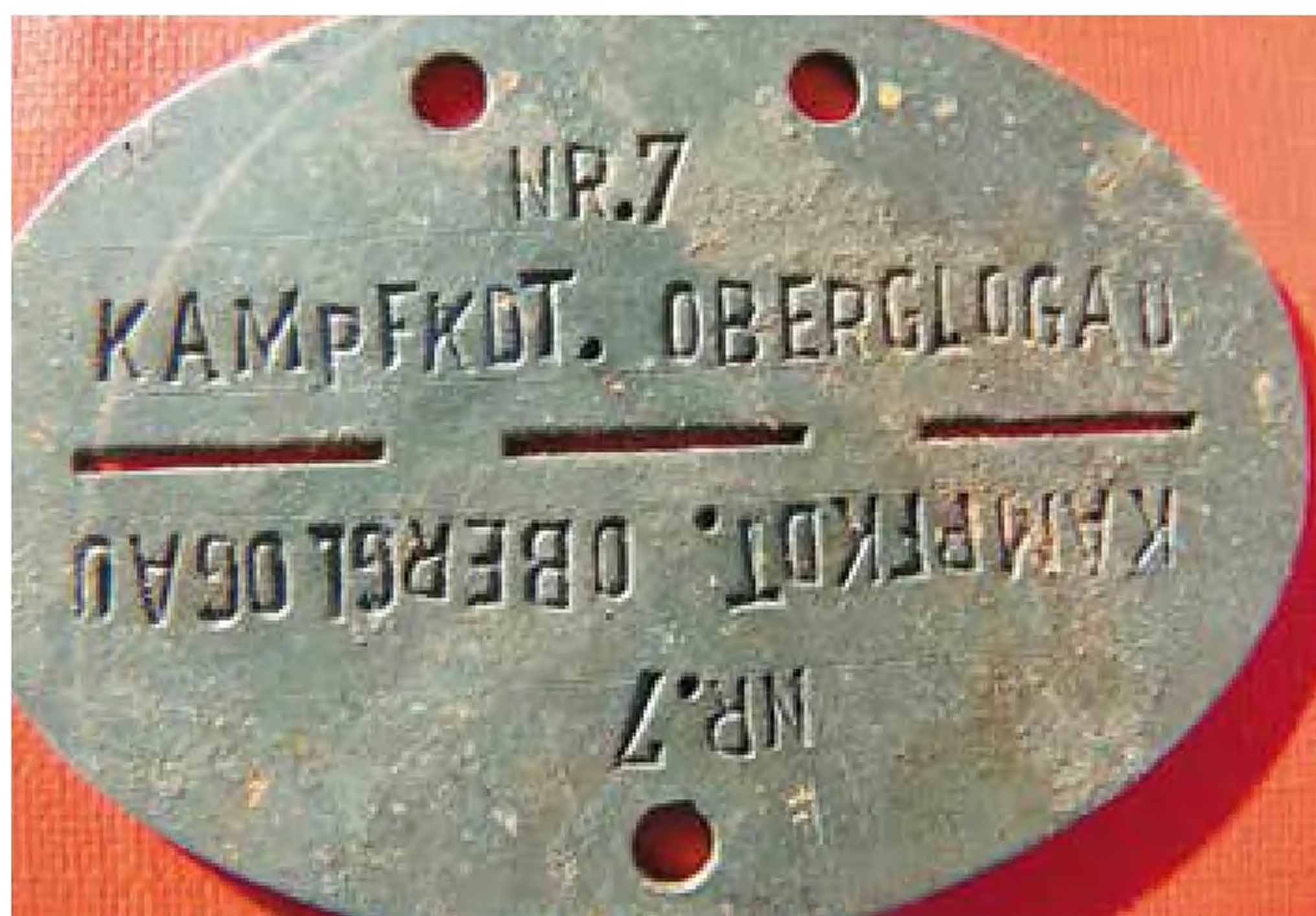
Komendantura Wojenna Oberglogau.

Jako ciekawostkę mogę podać, że sławetny Dr Mengele pierwsze kroki stawiał właśnie w tej kompanii.