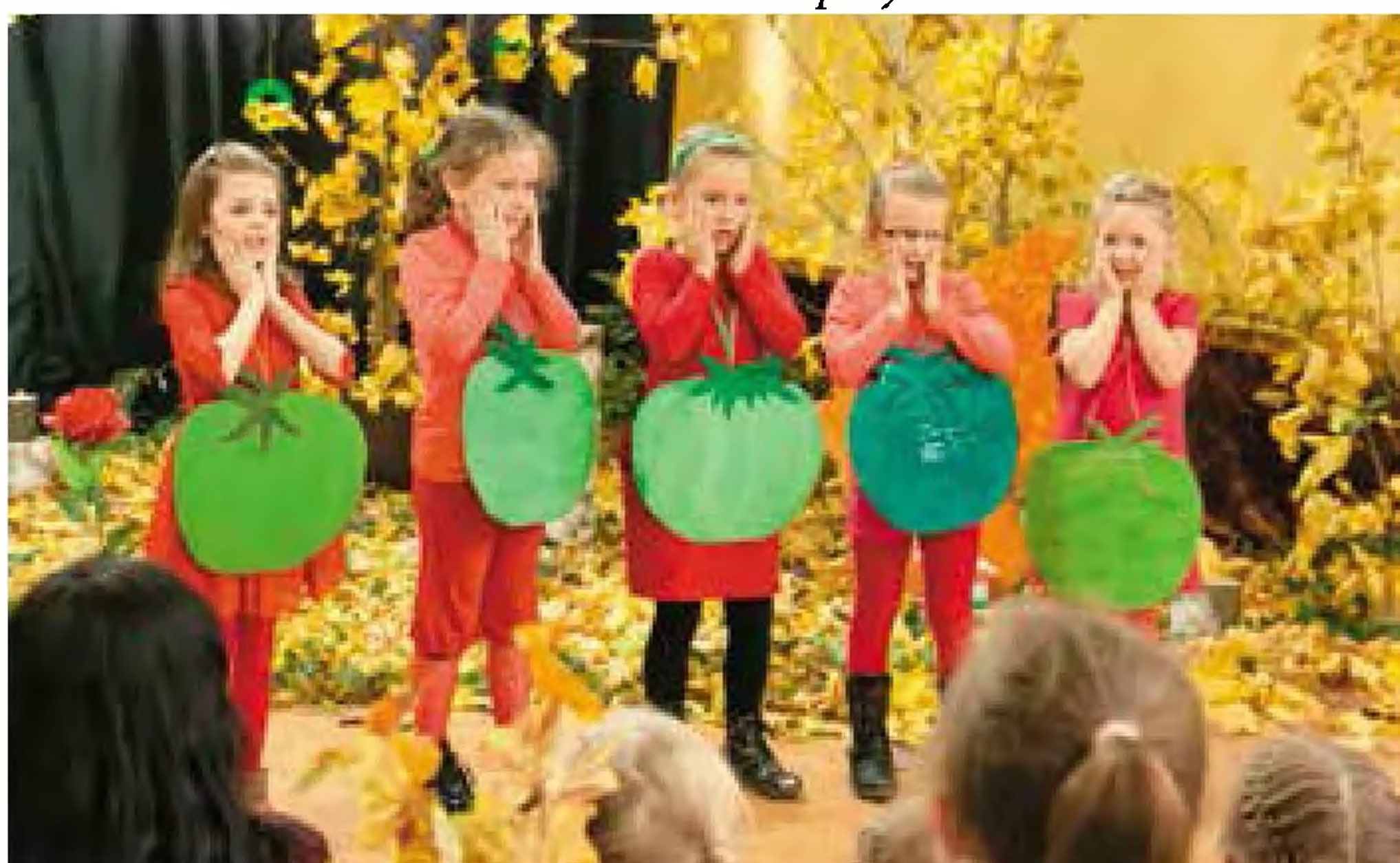
Przedшкоlaki z Kierpnia