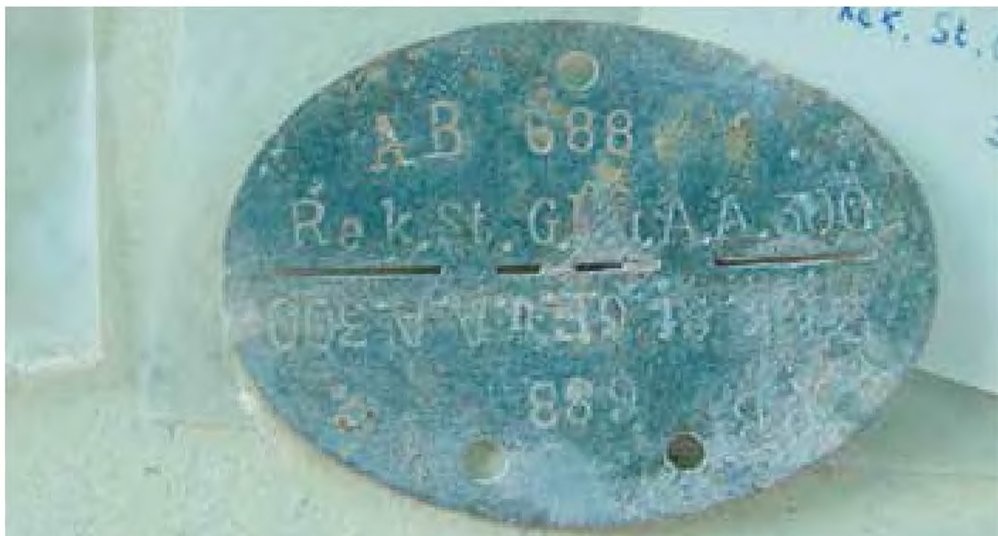
Kompania Rekrutów z 300. Szkolno-Zapasowego Oddziału Dział Szturmowych z Nysy.