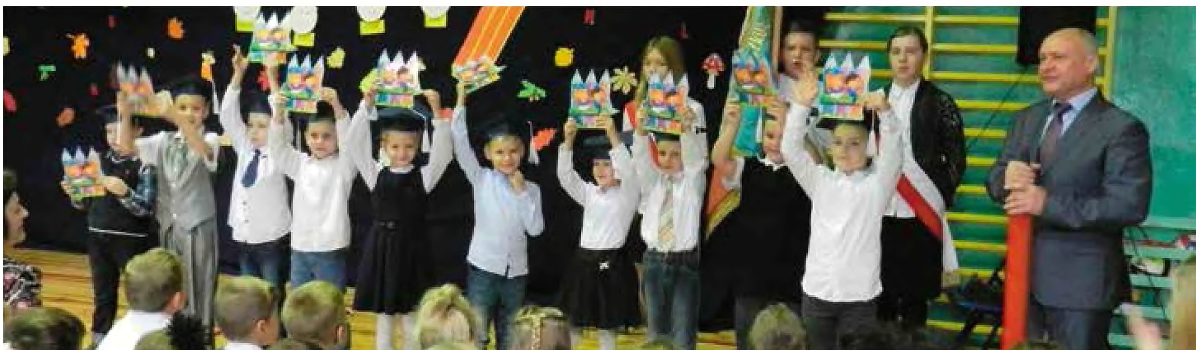
Pasowanie na ucznia - SP nr 2