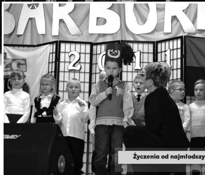
Życzenia od najmłodszych