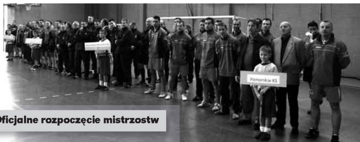
Oficjalne rozpoczęcie mistrzostw

W sobotę 17 grudnia w hali OSiR-u w Niemodlinie i hali Politechniki Opolskiej odbyły się XIX MISTRZOSTWA POLSKI SĘDZIÓW W PIŁCE NOŻNEJ HALOWEJ. Po raz pierwszy Opolszczyzna mogła cieszyć się, że przyznano jej organizację tak ważnej imprezy, która rozgrywana jest już po raz dziewiętnasty. Tym bardziej jest nam miło, że to nasza gmina mogła zapisać się w kartach historii sportu polskiego.