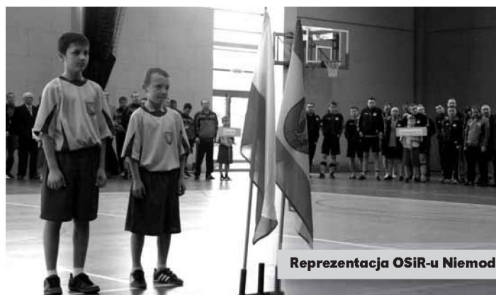
Reprezentacja OSiR-u Niemodlin