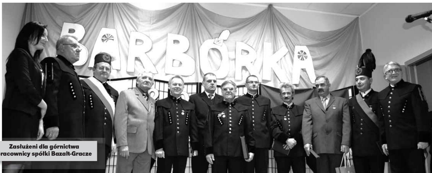
Zasłużeni dla górnictwa pracownicy spółki Bazalt-Gracze