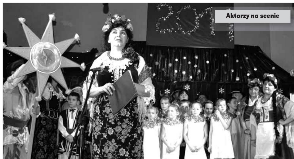
Aktorzy na scenie