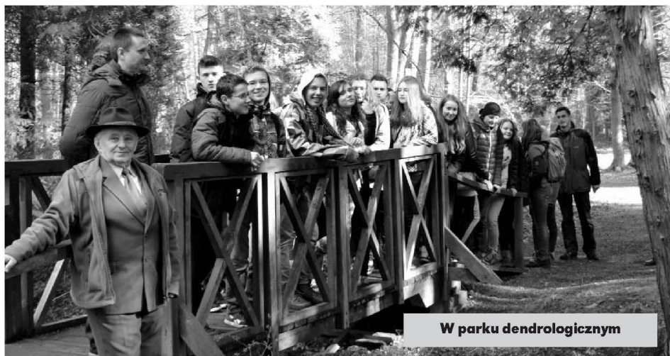
W parku dendrologicznym

– Bardzo miłą niespodzianką było przywitanie w rodzinach. Nie spodziewałem się tak wspianego przyjęcia. Jestem pozytywnie zaskoczona przyjęciem