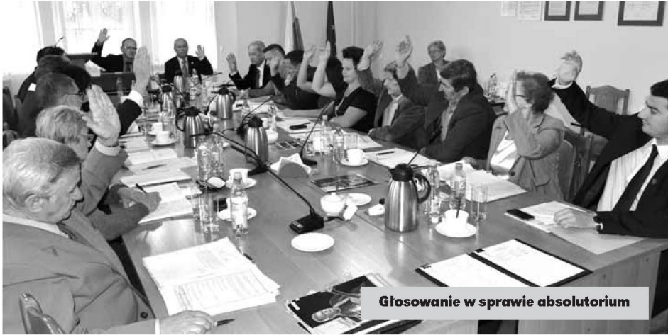
Głosowanie w sprawie absolutorium

29 maja w Niemodlinie odbyła się LIX sesja Rady Miejskiej. Spotkanie to należało do jednego z najważniejszych obrad w całym roku.