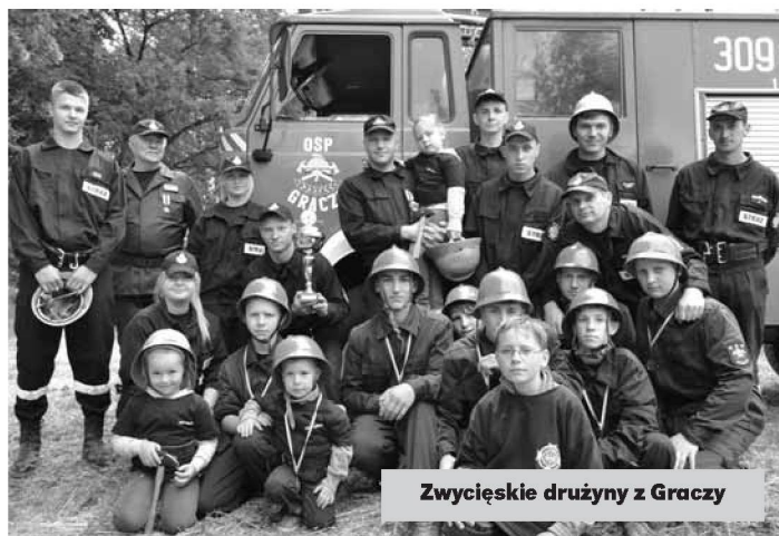
Zwycięskie drużyny z Graczy

– Sądzę, że sprawność, którą dzisiaj zaprezentowaliście, pokazuje naszym obywatelom, że mogą czuć się bezpiecznie. Cieszę się, że wystartowały niemalże wszystkie drużyny. Najbardziej jednak cieszy mnie fakt obecności młodych stra-