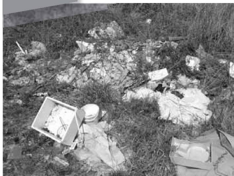
Podrzut śmieci w rejonie wsi Gracze