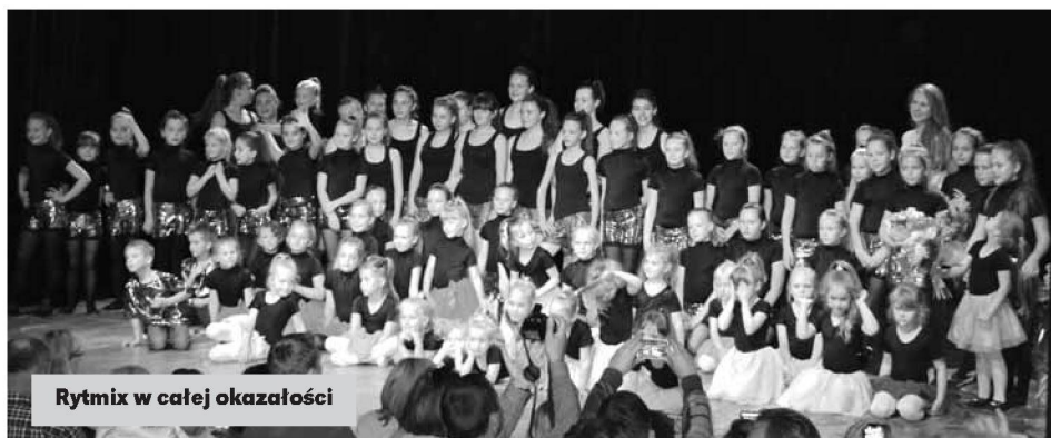
Rytmix w całej okazałości