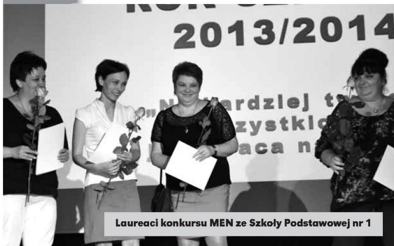
Laureaci konkursu MEN ze Szkoły Podstawowej nr 1