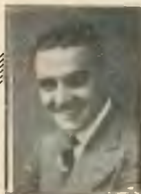
Wacław Ścibor-Rylski, art. dram.