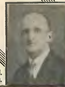
Jasłżeński i M. art. op. i dram.