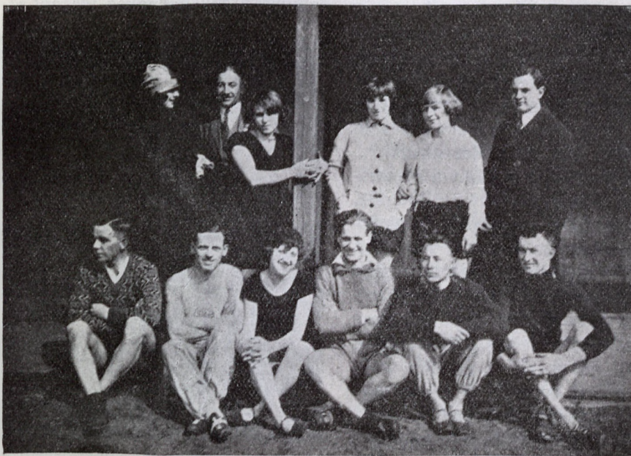
Zawodniczki i zawodnicy. Śl klubu lekko-atletycznego.

Ślizgawka w zimie też nie jest zapomnianą, dowodem czego słu-