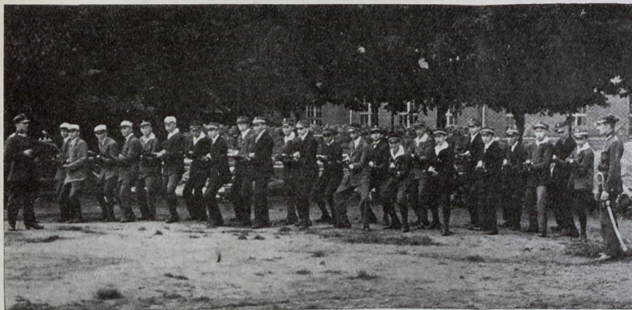
Ćwiczenia p. w. Hufca szkolnego Gimn. Rybnik.