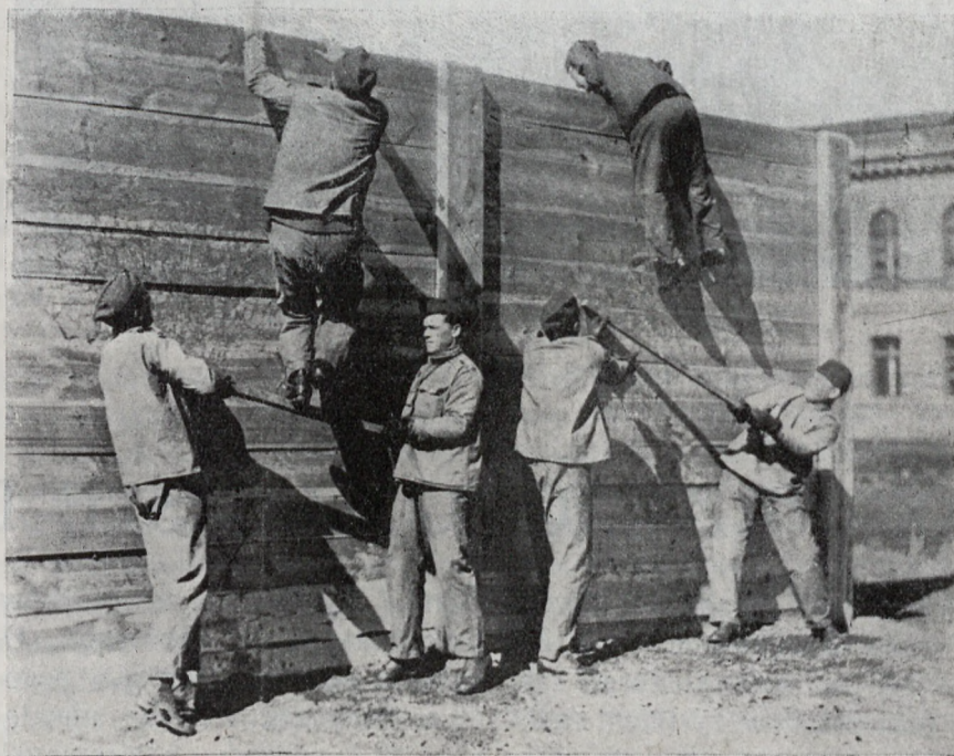
Oddział p. w. na torze przeszkód.

W pierwszym roku szkolenia przerabia się wiadomości, potrzebne do wyszkolenia dobrego strzelca. Przechodzi się w skróceniu to wszystko, co jest przewidziane dla kompanii strzeleckiej. Drugi rok jest szkołą, specjalizującą obsługę karabinów maszynowych, miotaczy bomb oraz innych broni i służb. Najwięcej czasu poświęca się na przygotowanie polityczne (około 25 proc.), dalej na wyszkolenie bojowe i szkołę strzelca.