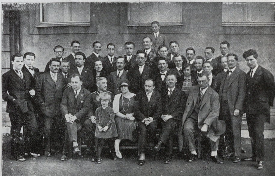
Kurs informacyjny kierowników Drużyn Jordanowskich w Mysłowicach.

Zabawy i gry z młodzieżą szkolną i pozaszkolną w wieku od