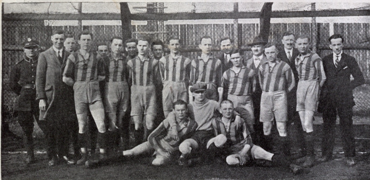
K. S. „Kresy“ zasilona dobrymi graczami K. S. „Przebój“.

miała zwłaszcza po przerwie wielką przewagę. ŁKS. miał swój bardzo słaby. K. S. „Słask“ Siemianowice 3:1 (1:0).