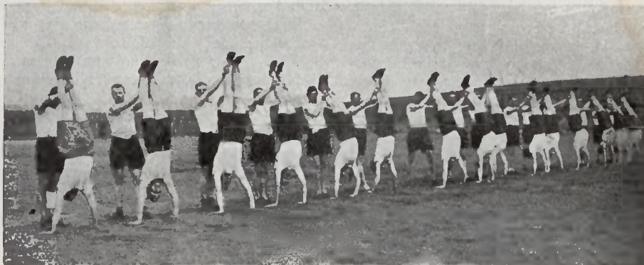
Kurs instruktorski W. F. Katowice 1927 roku.

Włodzimierz, dnia 19 marca 1928 r. K. K.