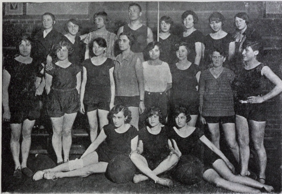
Grupa wybitnych lekko-atletek na ćwiczeniach w Ośrodku W. F. Katowice.

na wsi — po 7 godzin dziennie w ciągu 4—5 tygodni,