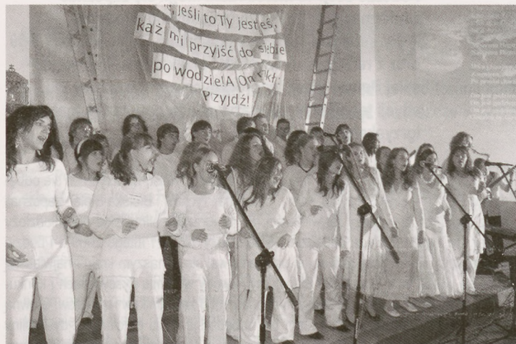
Chór Gospel z bielskiej szkoły muzycznej.