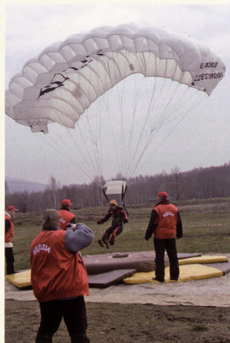
Wylądować trzeba jak najbliżej koła o promieniu 3 centymetrów.