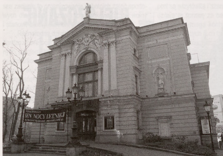
Cały gmach Teatru Polskiego zostanie wyremontowany.