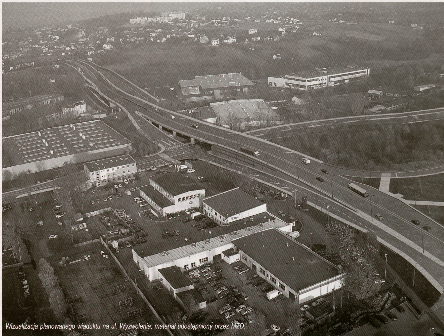
Wizualizacja planowanego wiaduktu na ul. Wyzwolenia