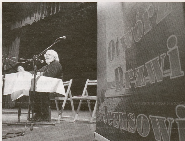
Wykład ks. A. Posackiego w BCK.