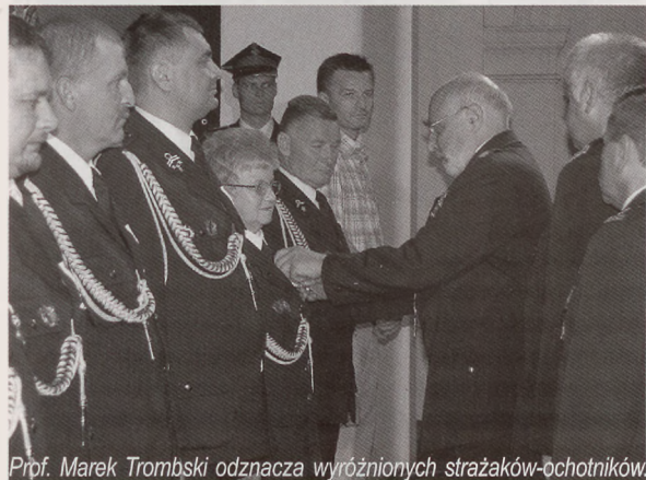
Prof. Marek Trombski odznacza wyróżnionych strażaków-ochotników

W 2006 roku bielscy strażacy uczestniczyli w 1836 zdarzeniach. Gasili 538 pożarów i likwidowali 1216 miejscowych zagrożeń. We wszystkich akcjach brało udział 2749 zastępów oraz 12613 ratowników. Podczas akcji zginęło 9 osób, a 103 osoby doznały obrażeń ciała, 8 strażaków zostało rannych. Strażacy szacują, że w akcjach udało się im uratować mienie za 17.422.000 zł. Dokonali także 116 kontroli stanu ochrony przeciwpożarowej i 100 odbiorów technicznych.