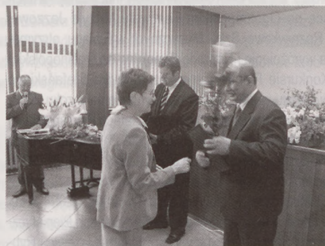
Prezydent J. Krywul wręcza nagrody bibliotekarzom.

kulturalnej, w szczególności upowszechniając czytelnictwo, w roku bieżącym po przepracowaniu 37 lat przechodzi na emeryturę;