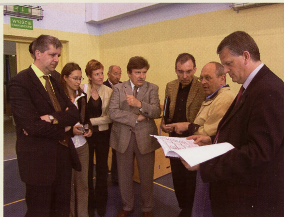
Uczestnicy spotkania w Zespole Szkół Samochodowych.

W ramach przygotowań do festiwalu odbyło się także robocze spotkanie przedstawicieli Europejskiego Komitetu Olimpijskiego, Polskiego Komitetu Olimpijskiego oraz komitetu organizacyjnego festiwalu, reprezentowanego przez jego przewodniczącego oraz burmistrzów i prezydentów miast, w których rozgrywane będą poszczególne konkurencje.