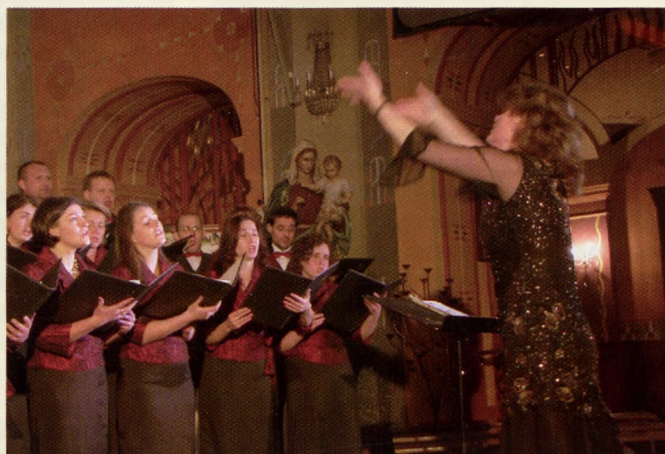
Podczas uroczystości wystąpił Bielski Chór Kameralny.

Wcześniej – 26 i 27 maja – na zielonych terenach Błoni będą trwały imprezy 14. Ogólnopolskich Dni Bezpieczeństwa, Kultury Ruchu i Ratownictwa Drogowego. Na str. 14 – utrudnienia w ruchu na czas imprez. □