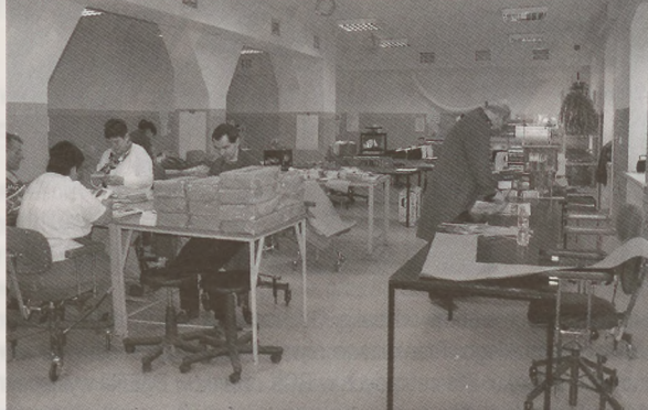
Wnętrze ZAZ Teatru Grodzkiego – Łodołamacza 2007.

13 kwietnia w katowickim hotelu Qubus odbył się finał śląskiego etapu konkursu propagującego zatrudnianie osób niepełnosprawnych Łodołamacze 2007 , w którym bardzo dobrze wypadli reprezentanci naszego miasta.