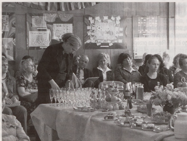
Świąteczne spotkanie bibliotekarzy.