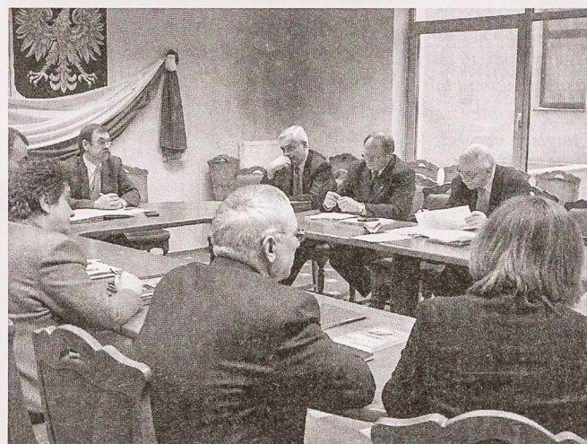
Posiedzenie Komisji Polityki Gospodarczej i Bezrobocia

szej mierze mieszkańców okolicznych miejscowości, niż samego Jastrzębia. – Ilu bezrobotnych jastrzębian ma dzisiaj kwalifi-