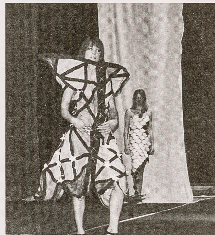
Jedna z prezentowanych kreacji

Na kolejną imprezę uczniowie Zespołu Szkół nr 4 zapraszają już 4 czerwca. Tym razem będzie można zobaczyć stroje wykonane ze wszystkiego prócz tkaniny i papieru oraz kreacje nawiązujące do lat siedemdziesiątych. (KW)