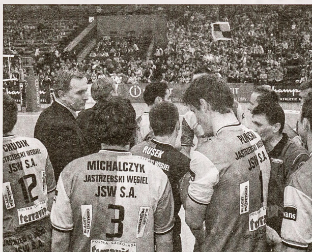
Siatkarze, niestety, wypadli z Ligi Mistrzów