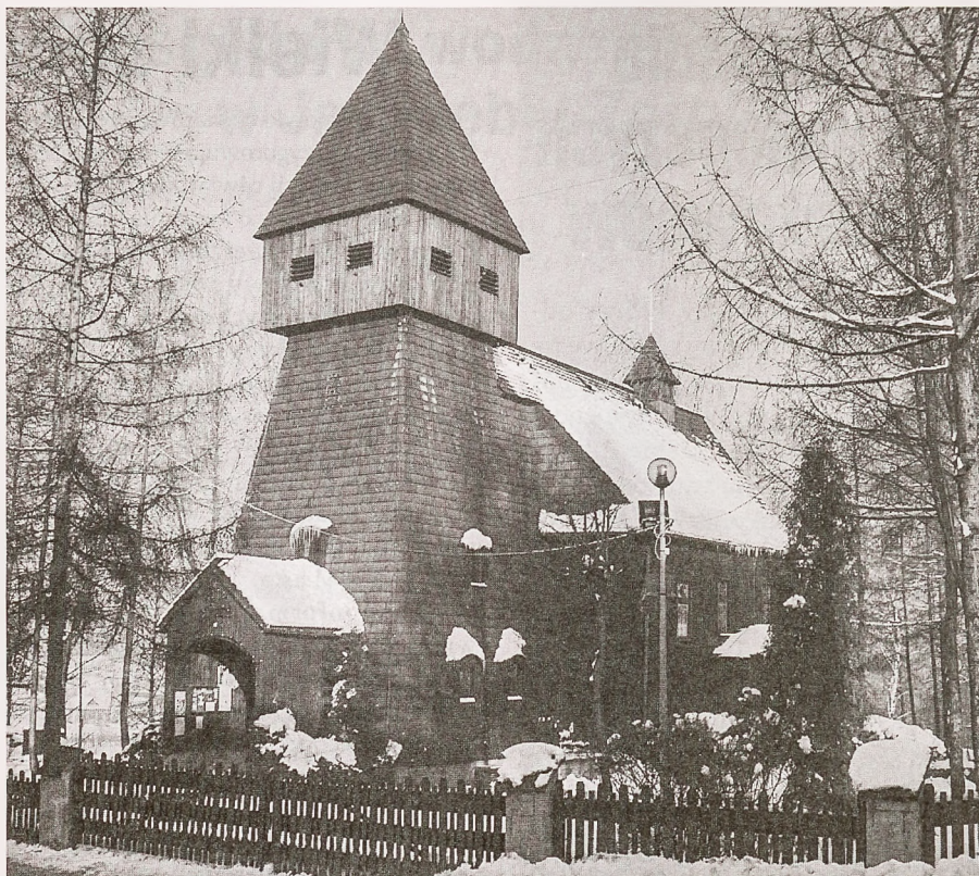
Drewniany kościół został przeniesiony z Jedłownika na Przyjaźń