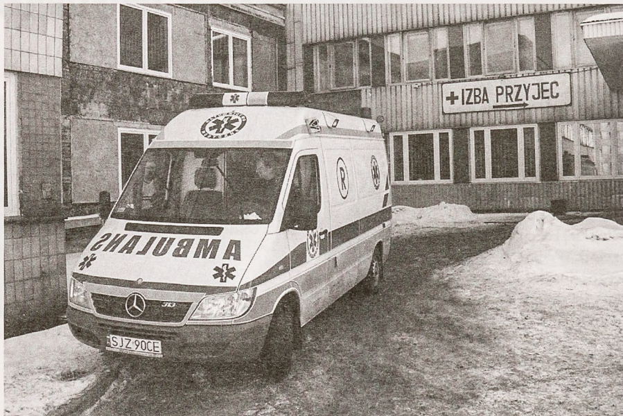
Ratownictwo medyczne dysponuje czterema samochodami

– Co się tyczy nocnej i świątecznej wyjazdowej opieki lekarskiej i pielęgniarskiej, to jest ona udzielana odpowiednio przez lekarza lub pielęgniarkę w domu pacjenta w przypadku jego nagłego zachorowania lub nagłego pogorsze-