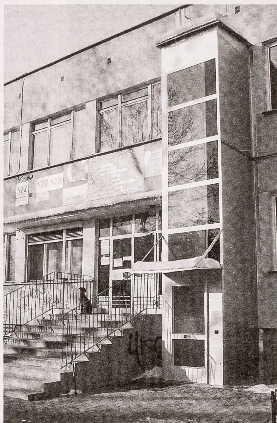
Zewnętrzna winda w przychodni na ul. Harcerskiej

Montaż platform został zaplanowany w „Strategii rozwiązywania problemów społecznych osób niepełnosprawnych w Gminie Jastrzębie Zdrój w latach 2004-2008”, którą Rada Miasta uchwaliła w październiku ubiegłego roku. Obecnie na swoją windę czeka przychodnia przy ul. Wodeckiego. (DC)