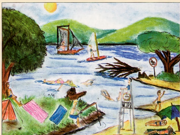
Arkadiusz Szostek – ZS8