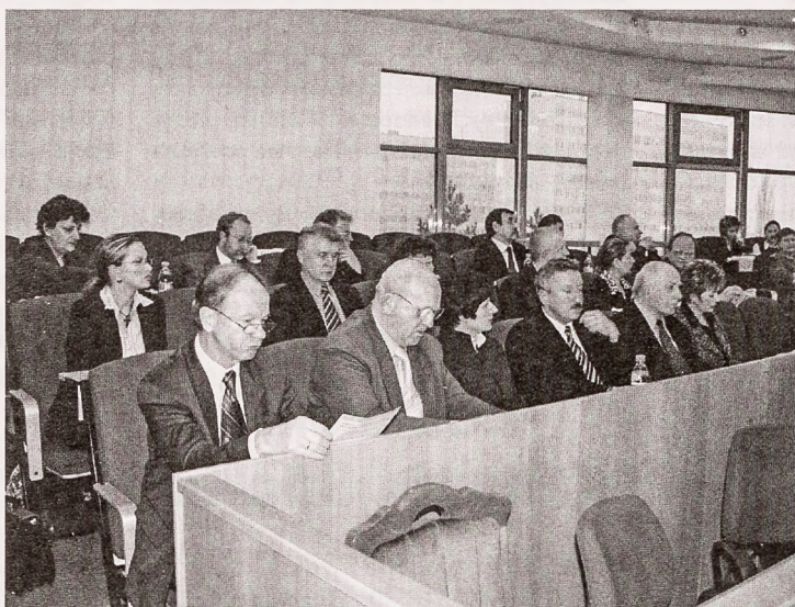
Rada Miasta obradowała 24 lutego