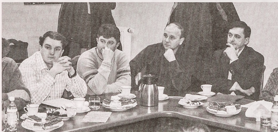
Samorządowcy z Bośni i Hercegowiny odwiedzili Jastrzębie Zdrój