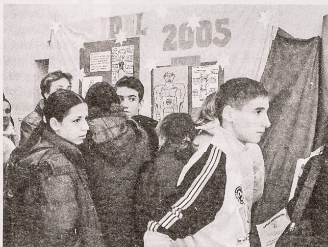
Młodzi redaktorzy z zainteresowaniem oglądali pracę kolegów

Już po raz drugi odbył się Miejski Przegląd Gazetek Szkolnych. Wystartowało w nim kilkanaście zespołów redakcyjnych ze szkół podstawowych, gimnazjalnych i średnich naszego miasta. Prace były bardzo różnorodne pod względem zawartości, formatu, szaty graficznej. Wszystkie były jednak ciekawe i zrobione z zaangażowaniem, a nierzadko również i z dużą dozą poczucia humoru.