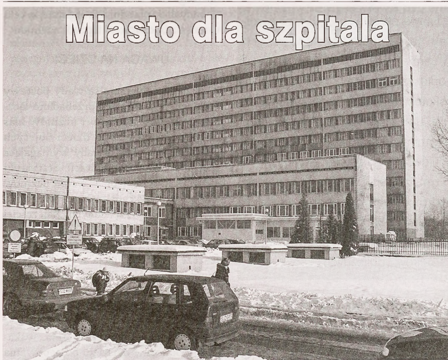
Wojewódzki Szpital Specjalistyczny nr 2

– Od września poczynając, większość działań z zakresu promocji zdrowia będzie skierowana do dzieci i młodzieży. W tym roku młodzież ponownie będzie miała możliwość skorzystania z zajęć edukacyjnych, poświęconych rozwiązaniu najistotniejszych problemów zdrowotnych. Młodzież gimnazjalna będzie miała możliwość sprawdzenia swojej wiedzy z zakresu anatomii człowieka, pierwszej pomocy oraz zdrowego stylu życia w czasie III edycji Miejskiego Turnieju Wiedzy o Zdrowiu. Dodatkowo, w ramach obchodów Światowego Dnia Walki z AIDS, w szkołach podstawowych i gimnazjalnych zostanie ogłoszony konkurs plastyczny, poświęcony tematyce uzależnień. Konkurs plastyczny będzie zakończony wernisażem oraz cyklem wykładów na temat zapobiegania zakażeniom wirusem HIV – mówi Halina Humeniuk , naczelnik Wydziału Zdrowia i Polityki Społecznej.