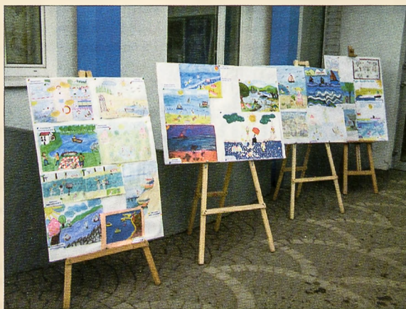
Prace zostały wystawione w hallu Urzędu Miasta