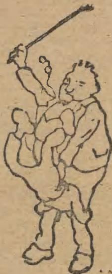
2. Was? Faxen machs-te!