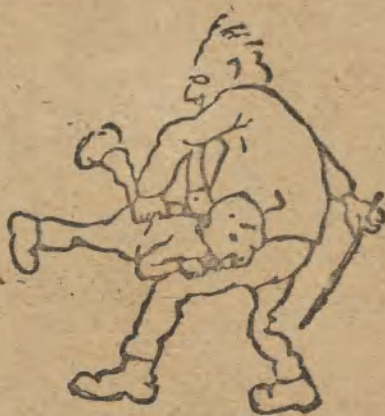
3. Ich werde dir schon bebringen!