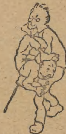
4. Vermuchtes Aas!