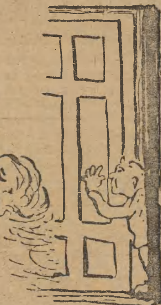
7. Jesus, Maria und Josef! Ein Deiwel!