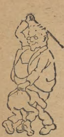
1. D ut ch sprechen, Verfluchter Sozals-Sohn!