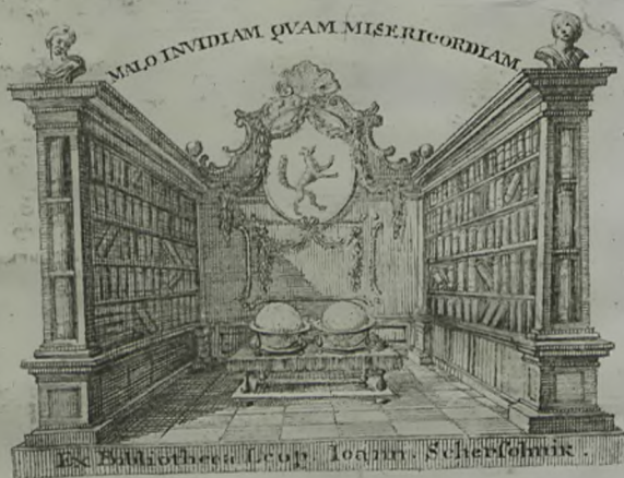
Ex Bibliotheca Leon. Ioann. Scherfomir.