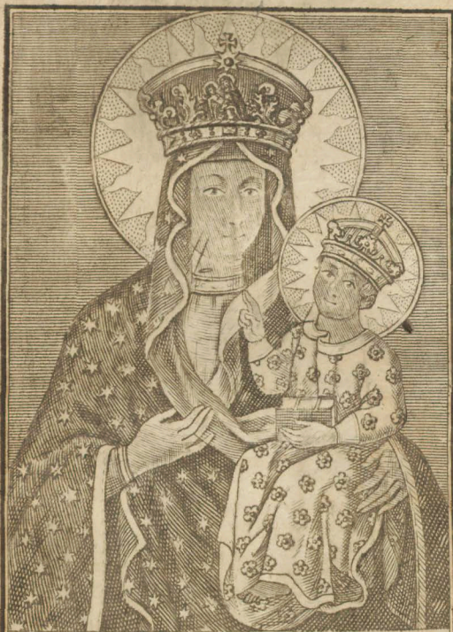
Eigentl. Abbildung n. L. Sr. zu Czernstochau in Pohlen, nach dem Original v. S. Luca gemahle.