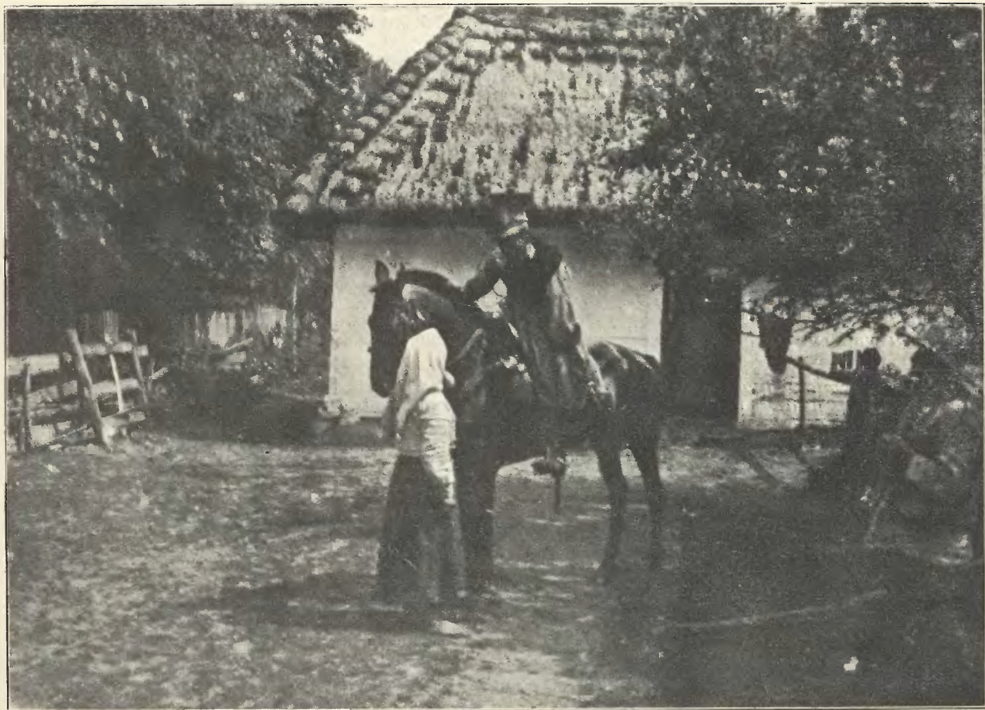
Ułan i dziewczyna.