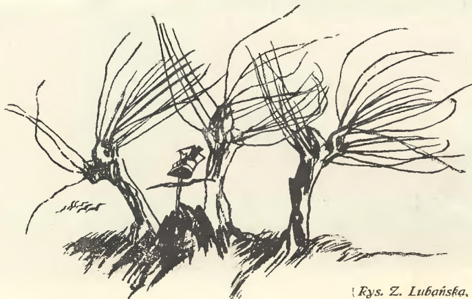
(Rys. Z. Lubańska.