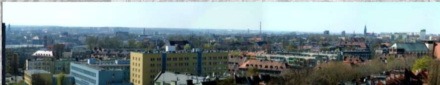
Panorama dzielnicy Zatorze.