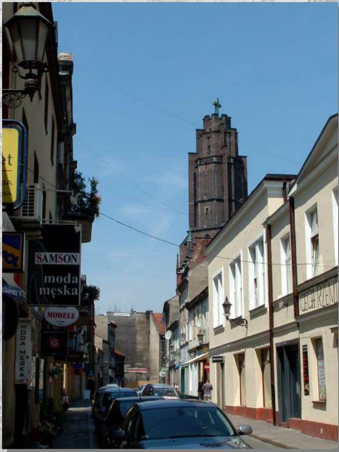
Ul. Raciborska wraz z górującą nad starówką wieżą kościoła.