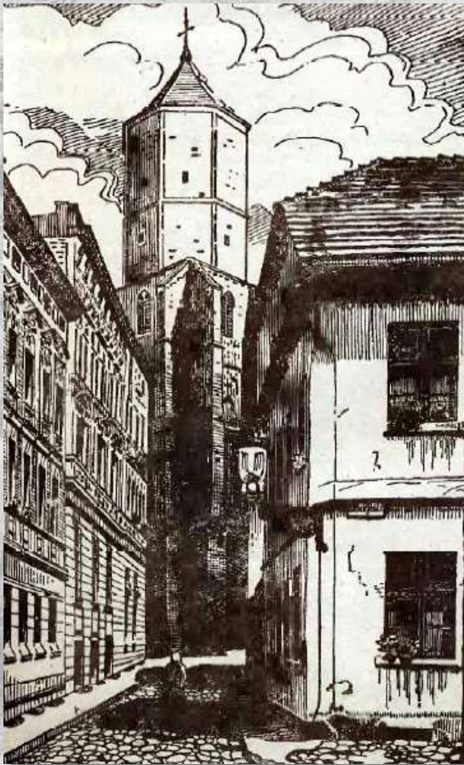
Na zdj.: XIX-wieczna rycina przedstawiająca uliczki wokół kościoła p.w. Wszystkich Świętych..