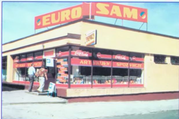
Sklep spożywczy „Eurosam” przy ul. Ratuszowej