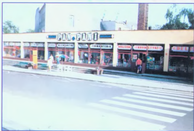
Pawilon Handlowy „Pan i Pani” przy ul. Gdańskiej

Wybudowano nowoczesną - mechaniczną piekarnię opalaną gazem. Zmodernizowano Zakład Przetwórstwa Mięsnego - oprócz produkcji mięsa i wędlin, w roku 1994 wprowadzono produkcję konserw mięsnych.