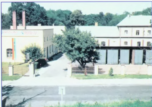
Budynek Administracji i magazyny przy ul. Dworcowej