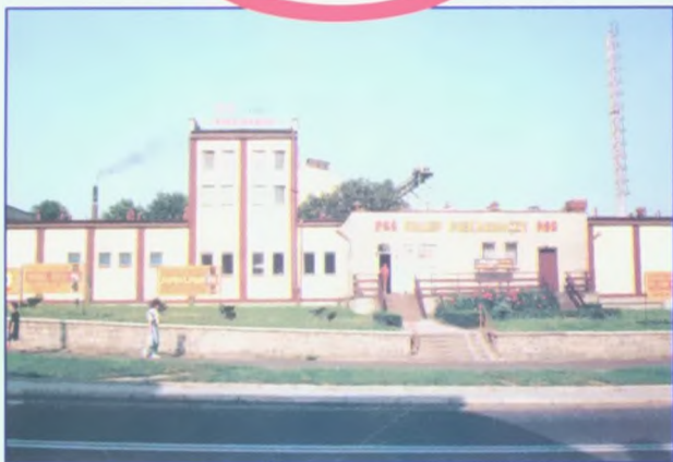
Piekarnia mechaniczna przy ul. Moniuszki wybudowana w roku 1989.

Najlepsza jakość i trwałość pieczywa tylko z piekarni przy ul. Moniuszki 48 - 100 Głubczyce tel. 85 - 27 - 66