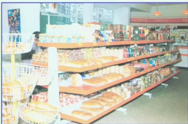
Stoisko w sklepie spożywczym „Eurosam” przy ul. Krętej.