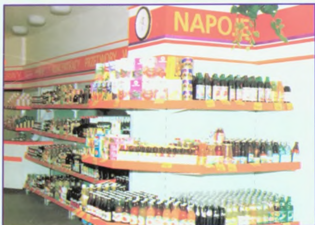
Sklep z napojami w sklepie „Eurosam” przy ul. Krętej.