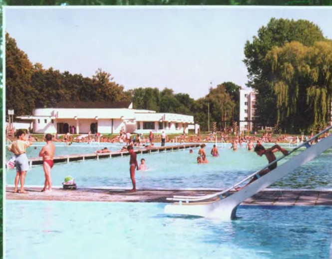
Zachęcamy do kąpieli i relaksu na basenie OSiR Głubczyce ul. Powstańców 2