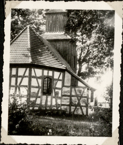
Die Lönkro Kirche