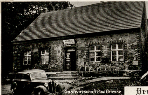
Gastwirtschaft Paul Brieske