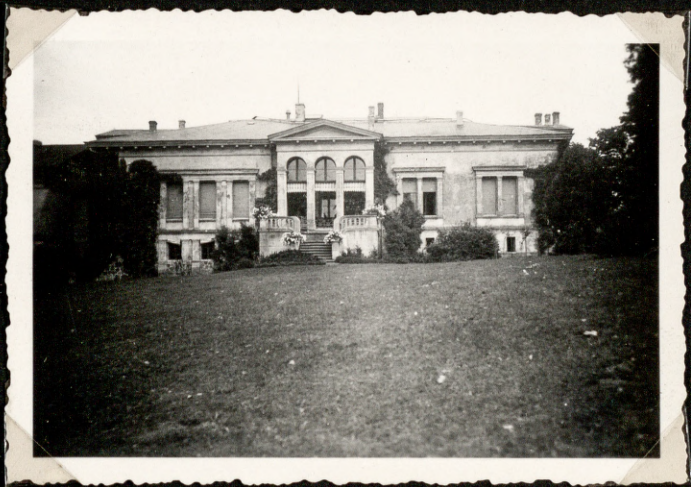
Pls. 2 b.