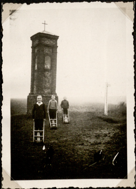
Die "Kloster" "