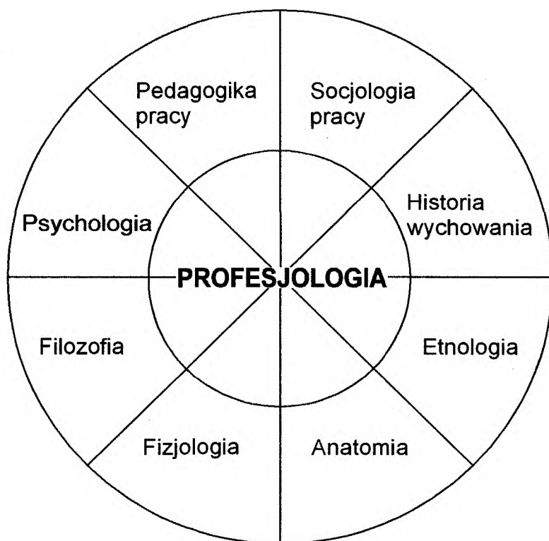
Rys. 2. Związek profesjologii z innymi naukami o człowieku

Biorąc pod uwagę przedstawione trudności, związane z wyróżnieniem wszystkich związków nauk o człowieku z profesjologią, tu zostaną ukazane tylko niektóre. Najmocniej profesjologia związana jest z psychologią, a szczególnie psychologią rozwoju człowieka. Cele, funkcje i zadania profesjologii mają korzenie w celach, funkcjach i zadaniach psychologii rozwojowej. Jest ona również powiązana z psychologią pracy, zwłaszcza ta jej część, która dotyczy rozwoju zawodowego pracujących. Psychologia pracy jest zakresowo węższą dziedziną wiedzy od profesjologii, gdyż dotyczy rozwoju zawodowego tylko człowieka pracującego, a profesjologia obejmuje całe życie człowieka. Na podstawie dwóch podanych przykładów można stwierdzić, że profesjologia i psychologia są ze sobą powiązane nie tylko takimi samymi lub bardzo zbliżonymi problemami rozwojowymi, terminologią, metodologią badań, ale również teoretycznymi podstawami rozwoju człowieka.