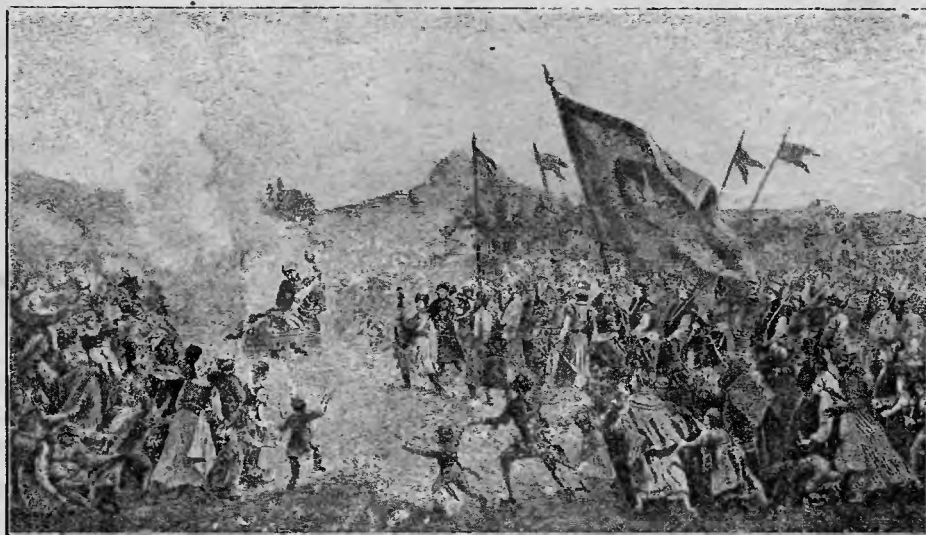
Procesja Konika Zwierzynieckiego w Krakowie.