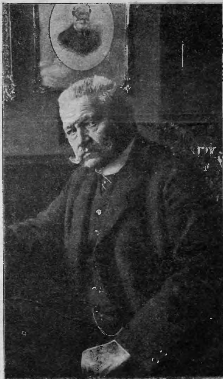
Ostatnia fotografia gen. Hindenburga w ubraniu cywilnem,

Zapewne jednak świat cały pozna się na tym farbowanym lisie i zrozumie, że Hindenburg to powrót cesarskich Niemiec i ciągłych wojen w Europie.