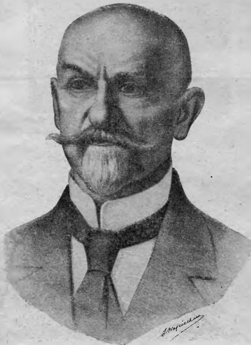
PREZYDENT ST. WOJCIECHOWSKI.

obchodzi swego patrona i prezydent Stanisław Wojciechowski. Umiał on w chwilach największego podniecenia nienawiści partyjnych uspokoić wrzenie; przy czynnym Jego współudziale dokonane zostało uzdrowienie waluty i stworzenie pieniądza polskiego. Naród cały widzi Prezydenta zawsze tam, gdzie interes państwa i narodu tego wymaga; jest On nie tylko najwyższym dostojnikiem Państwa, lecz i moralnym przewodnikiem narodu. W dniu Jego Patrona Polska cała zanosić będzie błagania do Najwyższego, by natchnął Go, aby i dalej w szczęściu, miłości i pokoju kierował nawą Najjaśniejszej Rzeczypospolitej, nie zbaczając nigdy z drogi sprawiedliwości.