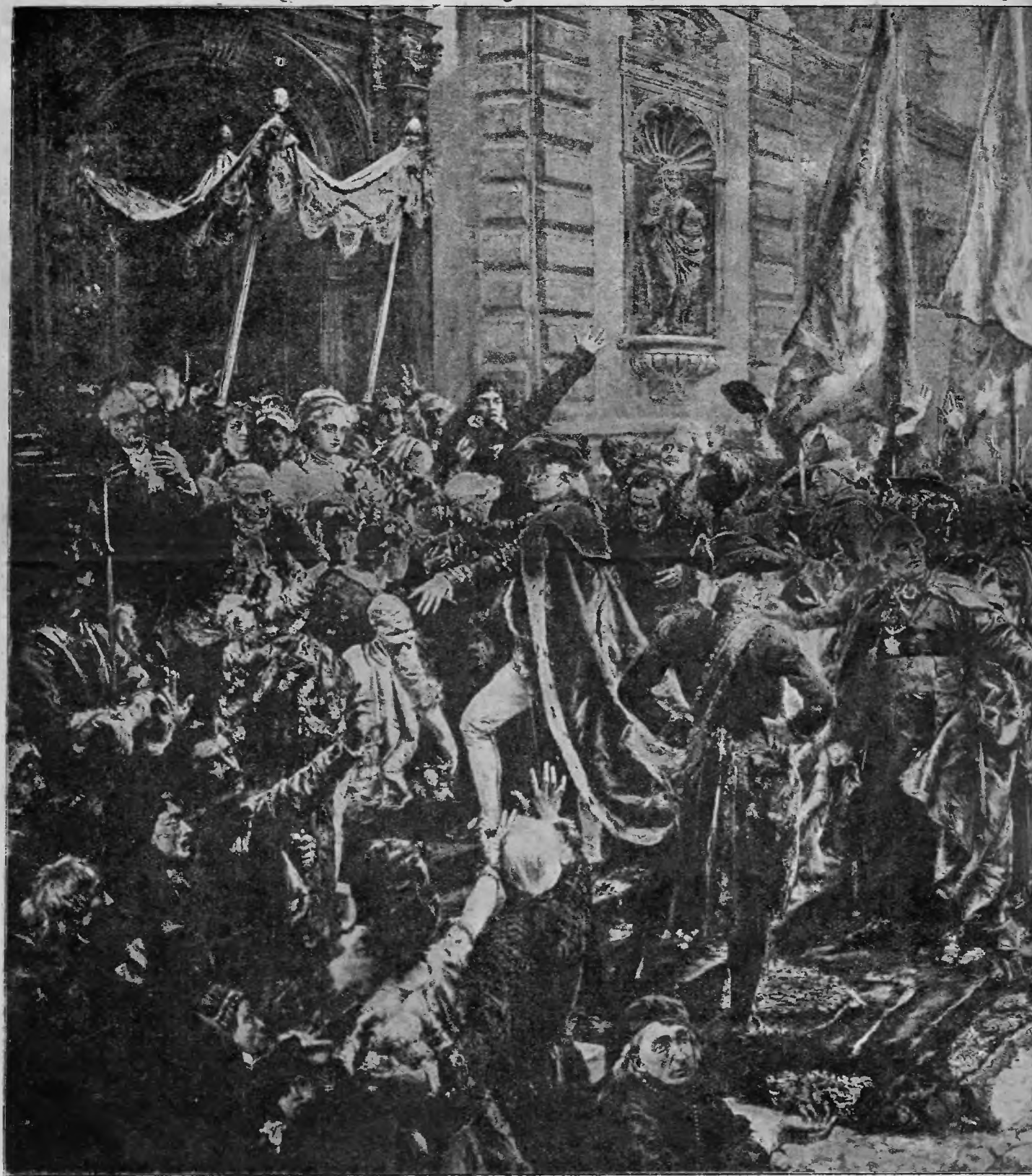
Wejście króla Stanisława Augusta z Senatem i Sejmem