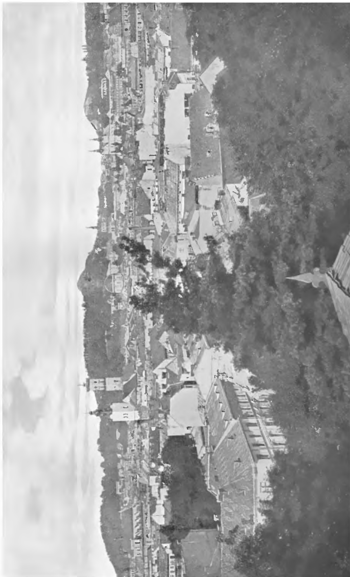
Lwów. — Widok ogólny miasta od strony południowo-zachodniej.

W głębi, na ostatnim planie, widać kopiec Unii Lubelskiej, niespożyta pomiatkę wielkiego dzieła Jagiellonów. Mimo wszelkich usiłowań wrażej potęgi moskiewskiej przetrwa ono wieki i zawsze świadczyć będzie o wielkiej myśli państwowej twórców Unii Lubelskiej oraz o głębokim echu, jakie znalazła ona po wiekach w wielkiem sercu twórcy kopca — Smolki i w sercach obywatelstwa lwowskiego.