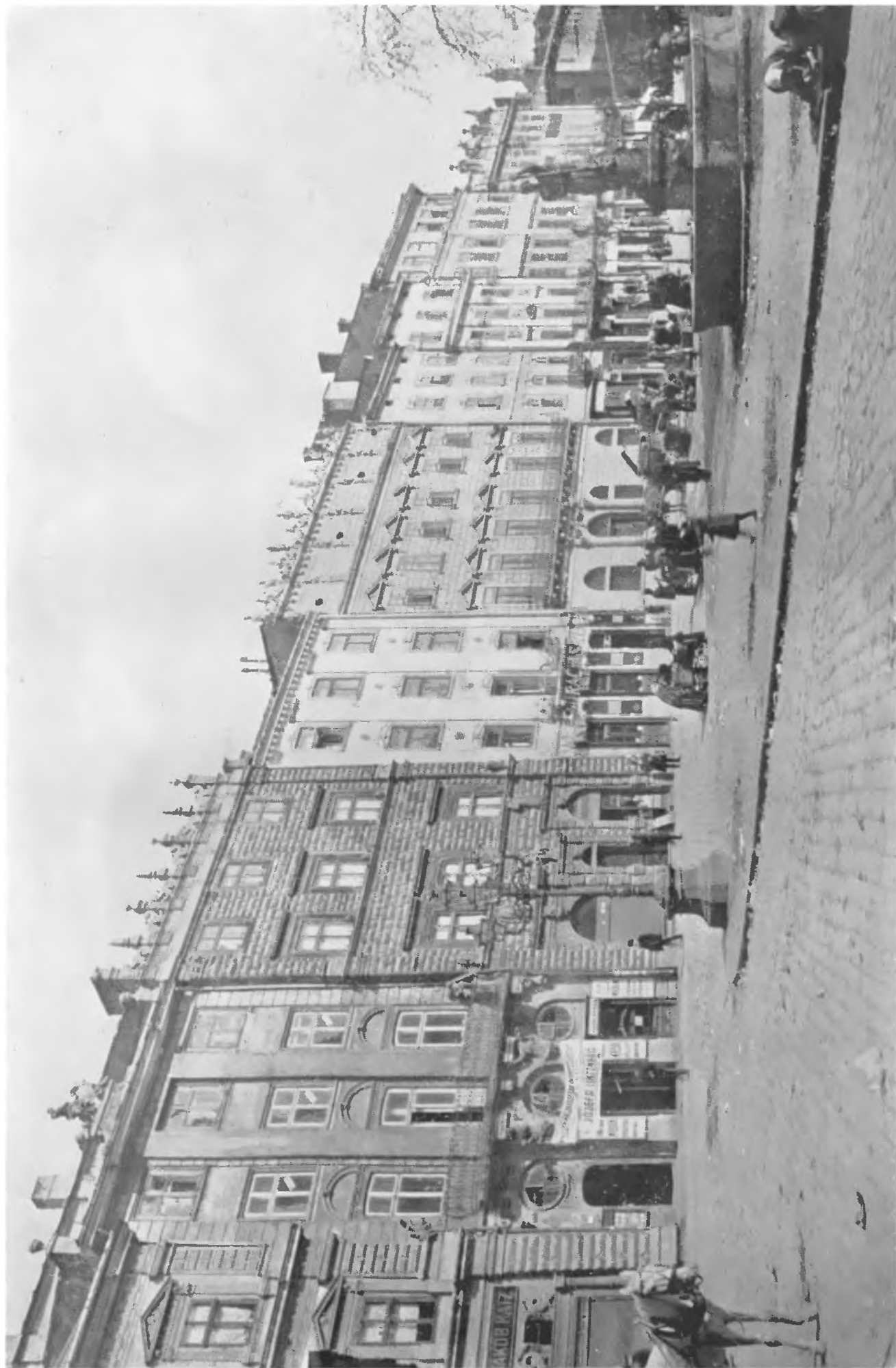
Lwów. — Wschodnia połąć rynku z domami patrycyuszów lwowskich.