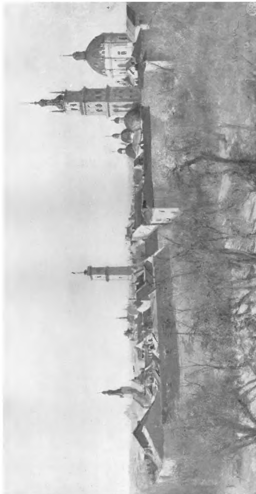
Lwów. — Widok ogólny miasta od strony południowo-wschodniej.