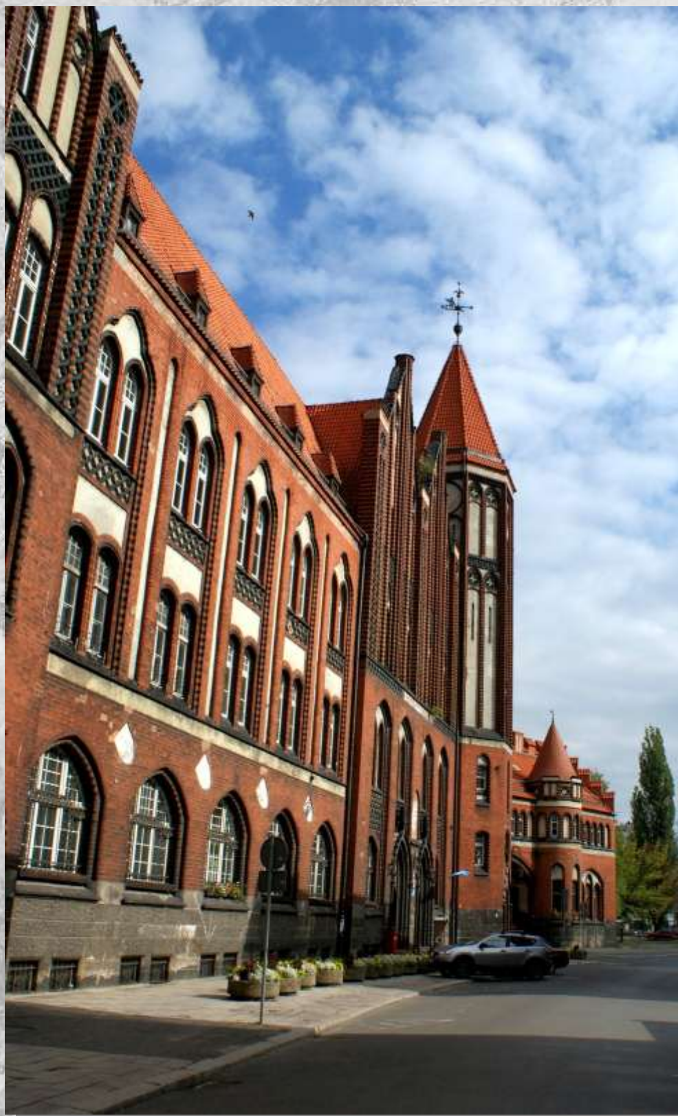
Na zdj.: ul. Dolnych Wałów oraz budynek poczty głównej.