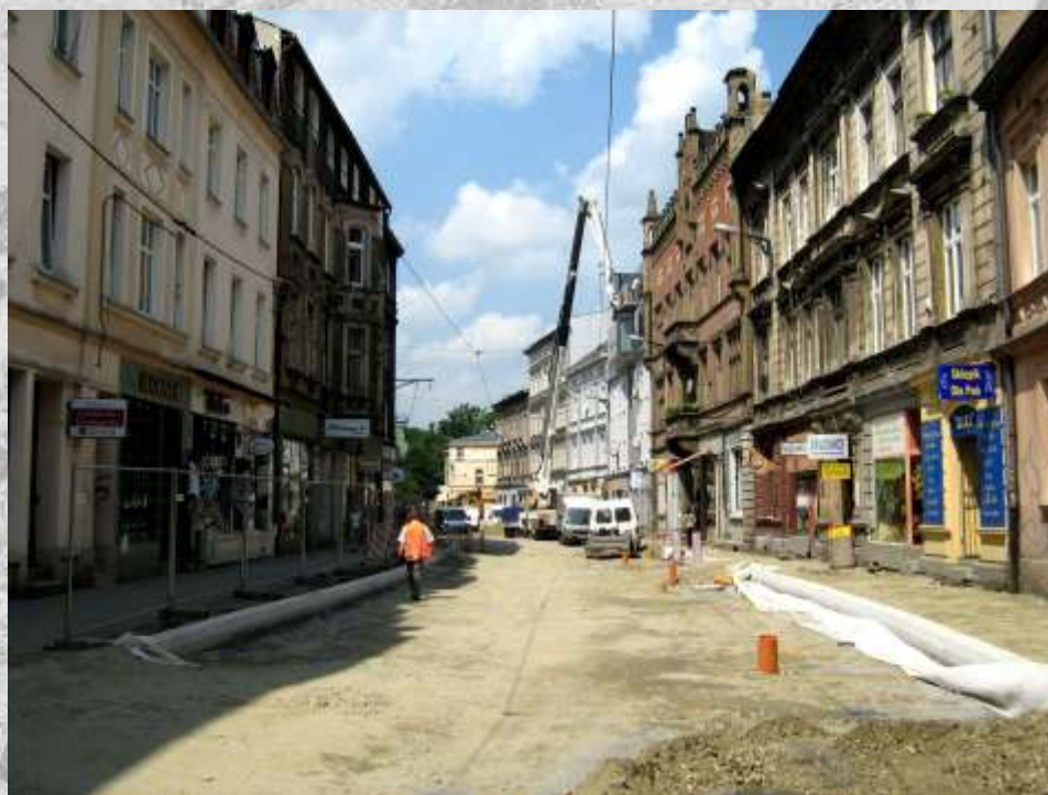
Na zdj.: remont ul. Wieczorka.