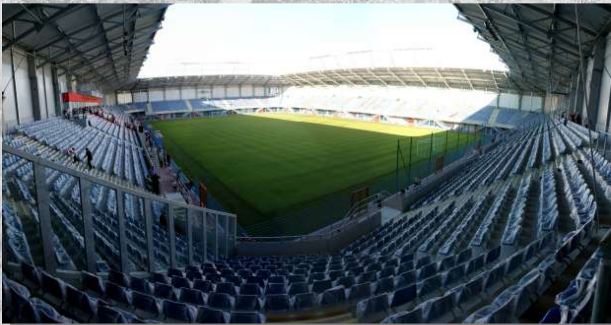
Na zdj.: Panorama Palmiarni Miejskiej oraz nowego stadionu.