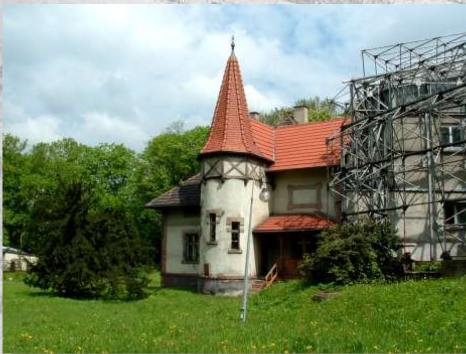
Na zdj.: Domek Ogrodnika – pozostałość starych zabudowań gliwickiej palmiarni.