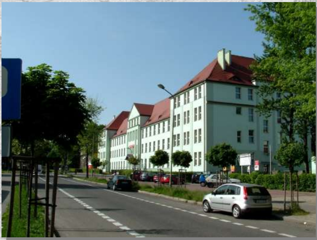
Szkola przy ul. Okrzei.