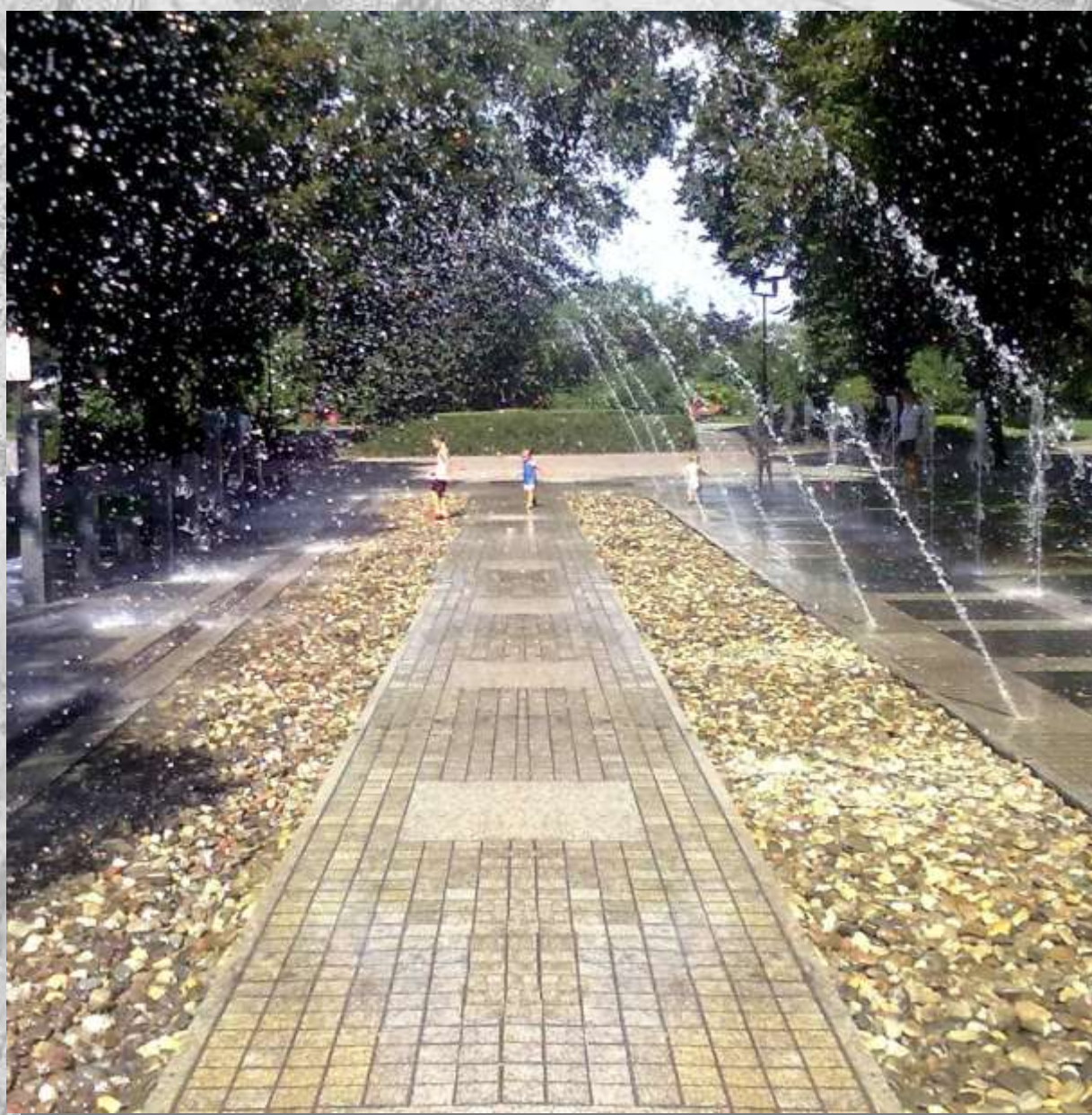
Na zdj.: nowa fontanna miejska na Placu Piłsudskiego.