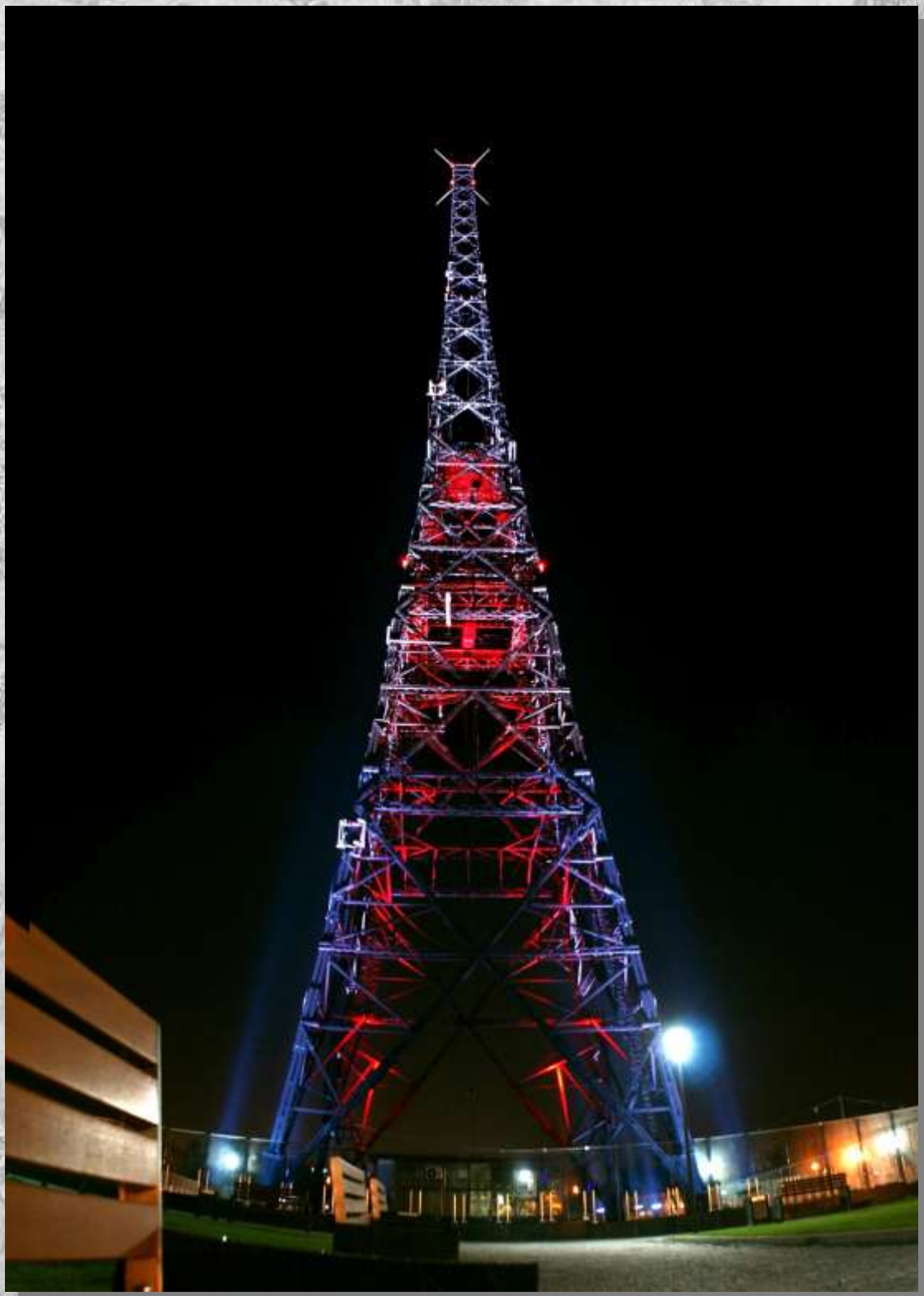
Na zdj.: Nowe, reprezentacyjne oświetlenie gliwickiej radiostacji.