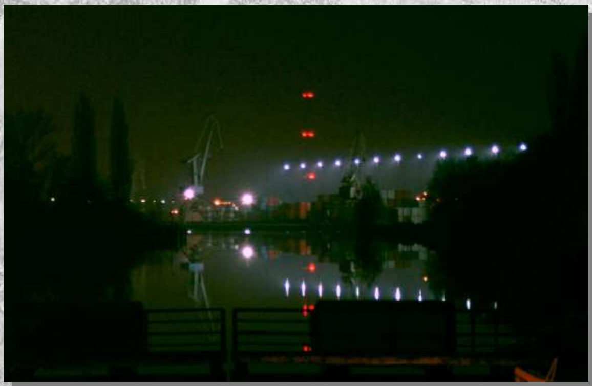
Na zdj.: Gliwicki port nocą.