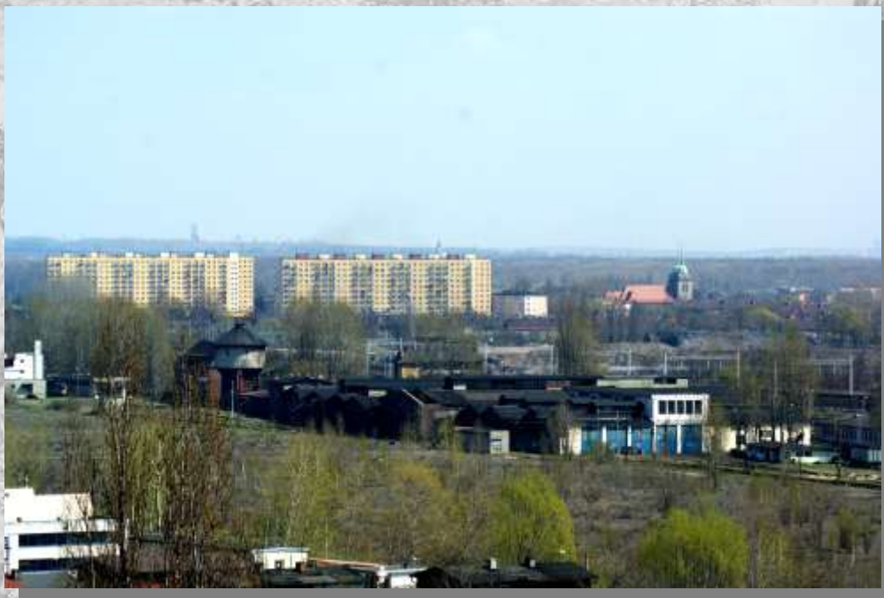
Lokomotywnia oraz panorama Sośnicy.