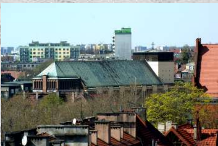
Na zdj.: kościół p.w. Chrystusa Króla.