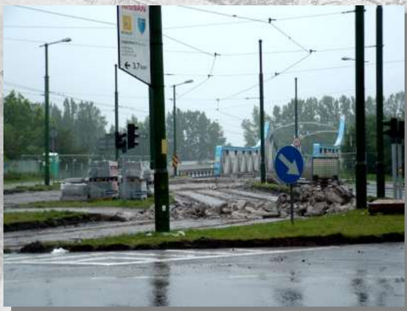
Na zdj.: Remont wiaduktu w ciągu ul. Zabrskiej.