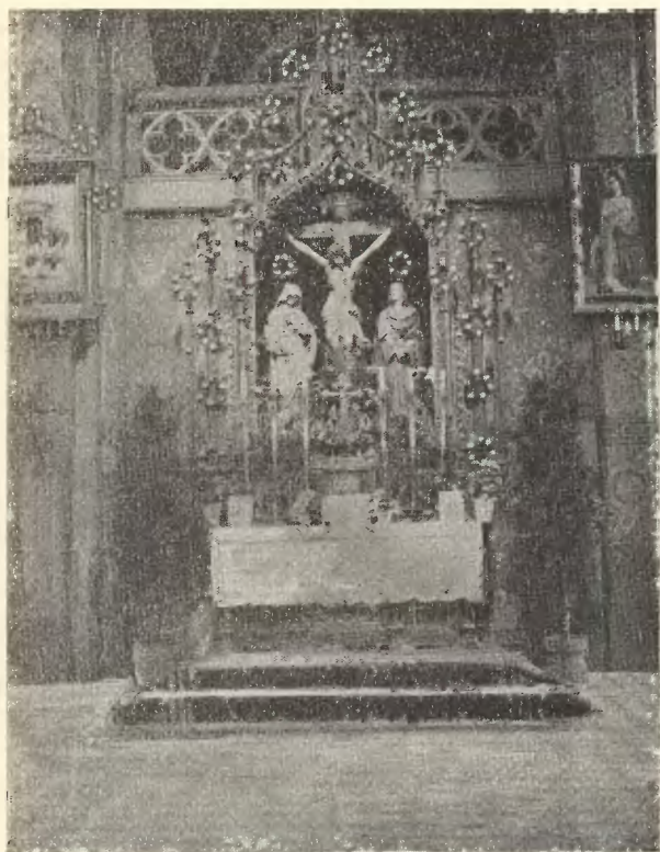
Ołtarz Krzyża Św.