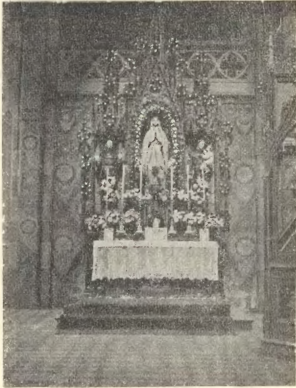
Ofiarz Matki Boskiej.