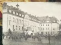
BRANICE ZAMEK FUNDACJA ŚW. RAFAŁA