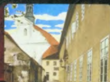
GLUBCZYCE KLASZTOR O.O. FRANCISZKANÓW