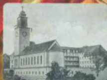
BRANICE BAZYLICA ŚW. RODZINY