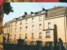
DZBAŃCE OSIEDLE DOM DLA PSYCHICZNIE CHORYCH